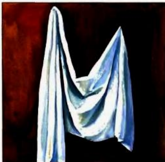
3. Окончательная прорисовка складок, уточнение tonальных отношений, завершение работы.