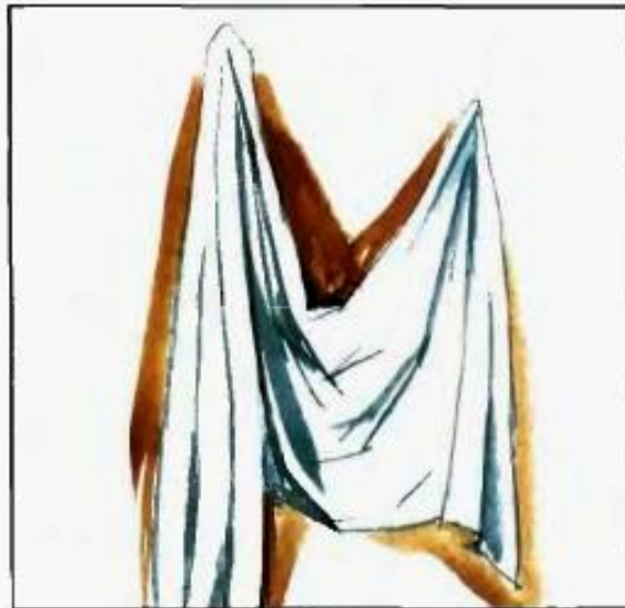
1. Выполнение рисунка кистью.