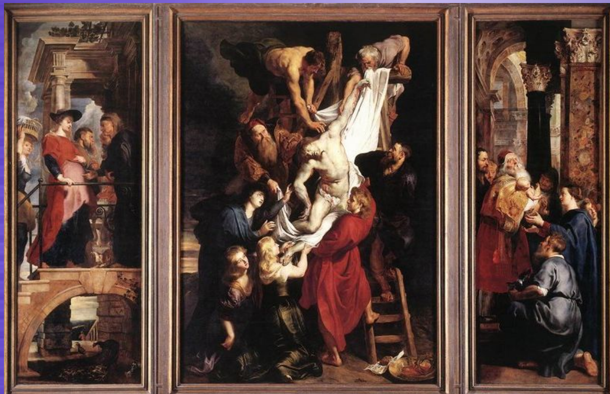
Зняття з хреста