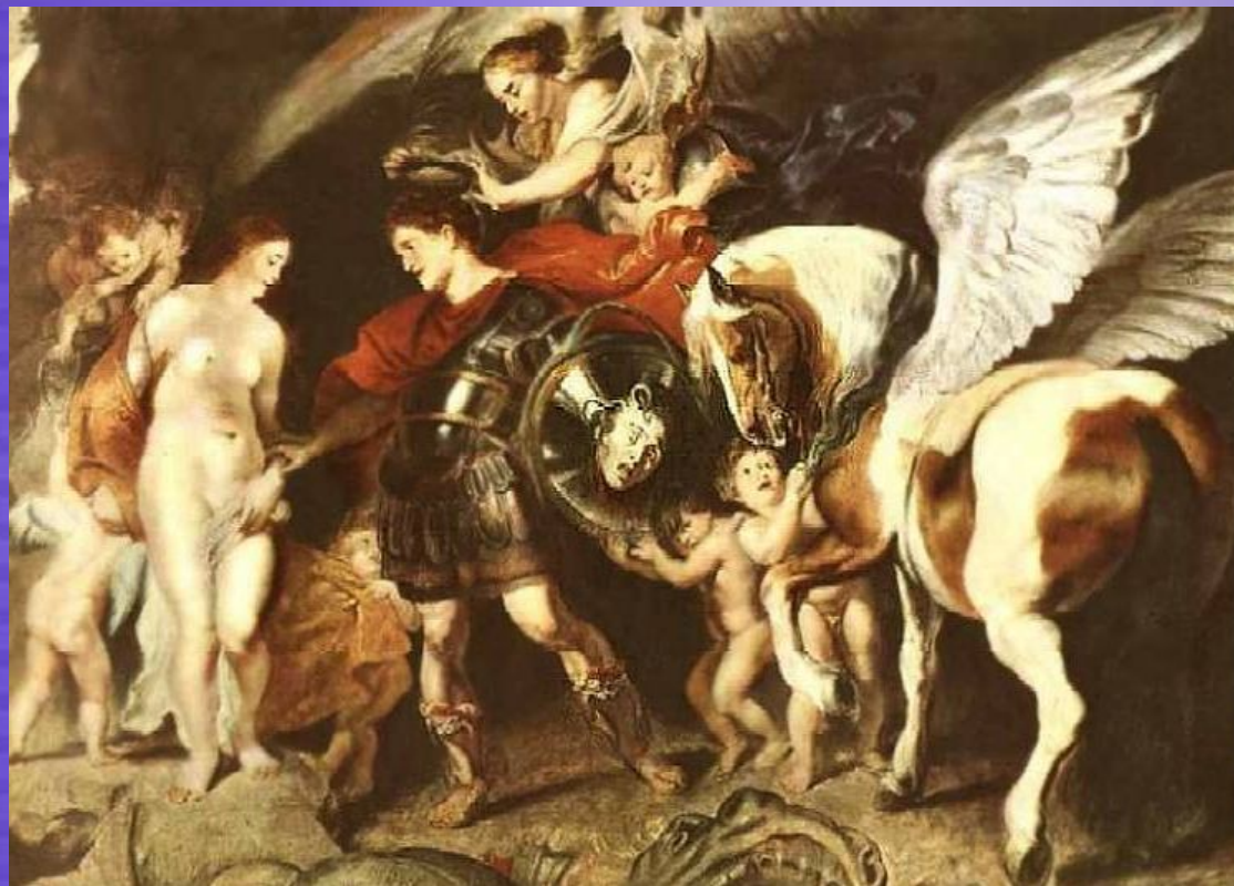
Персей та Андромеда