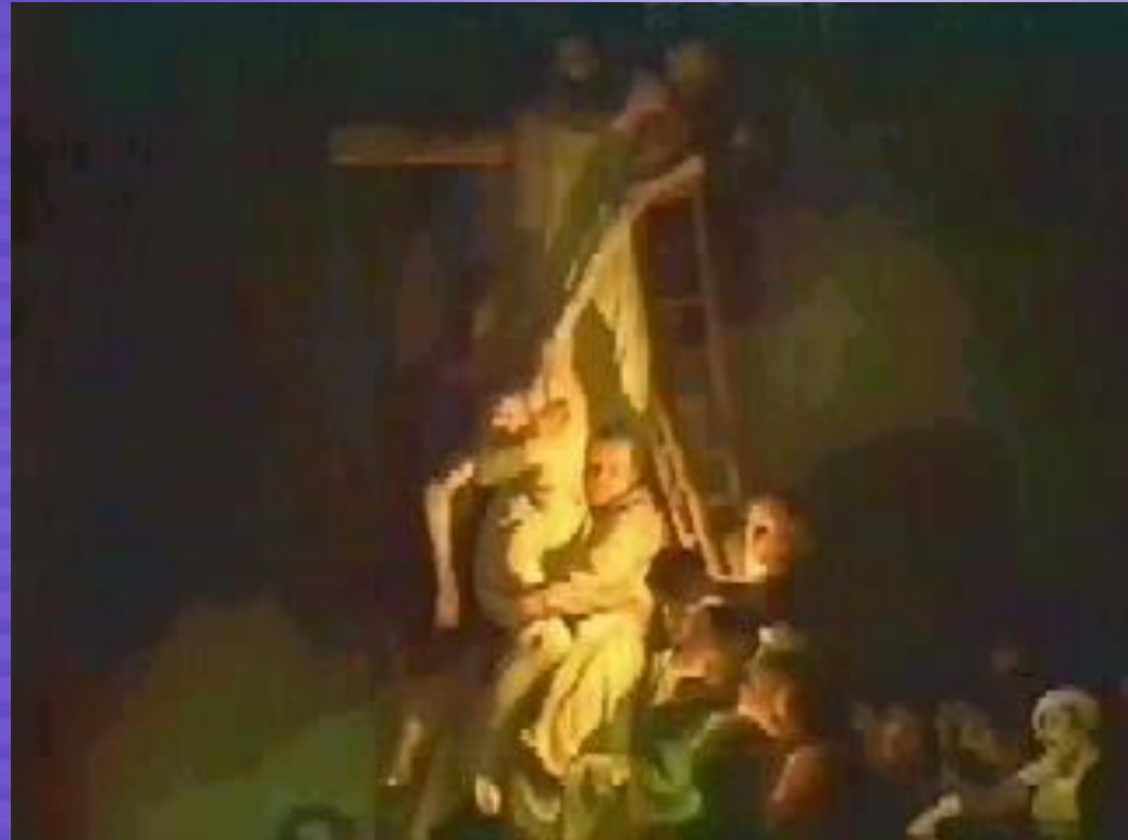
Зняття з хреста