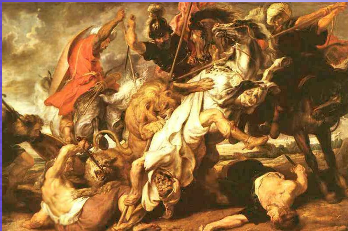
Полювання на левів