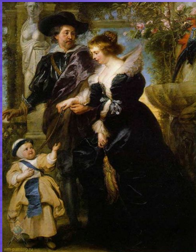
Автопортрет з дружиною і сином