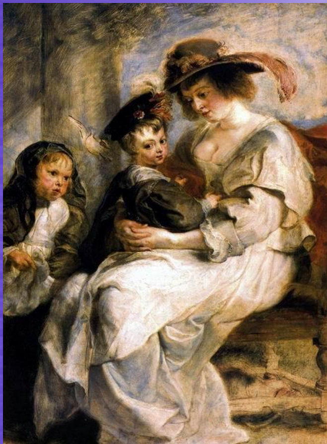
Портрет Олени Фоурмен з дітьми