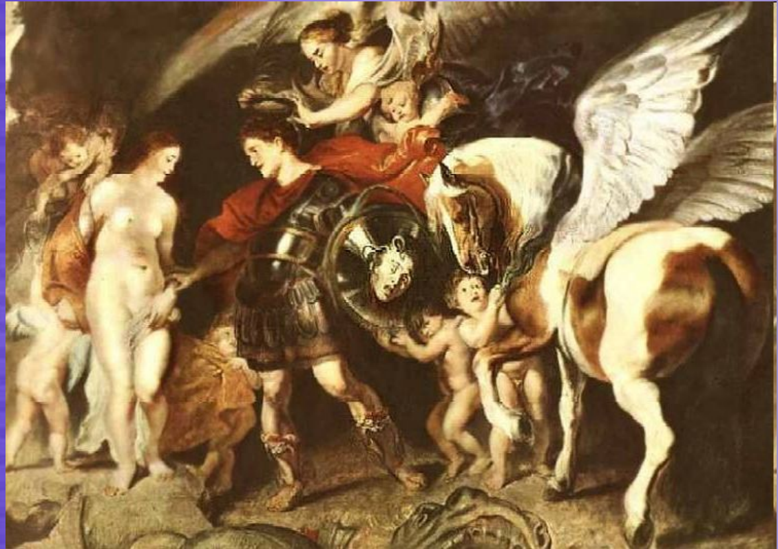
Персей та Андромеда