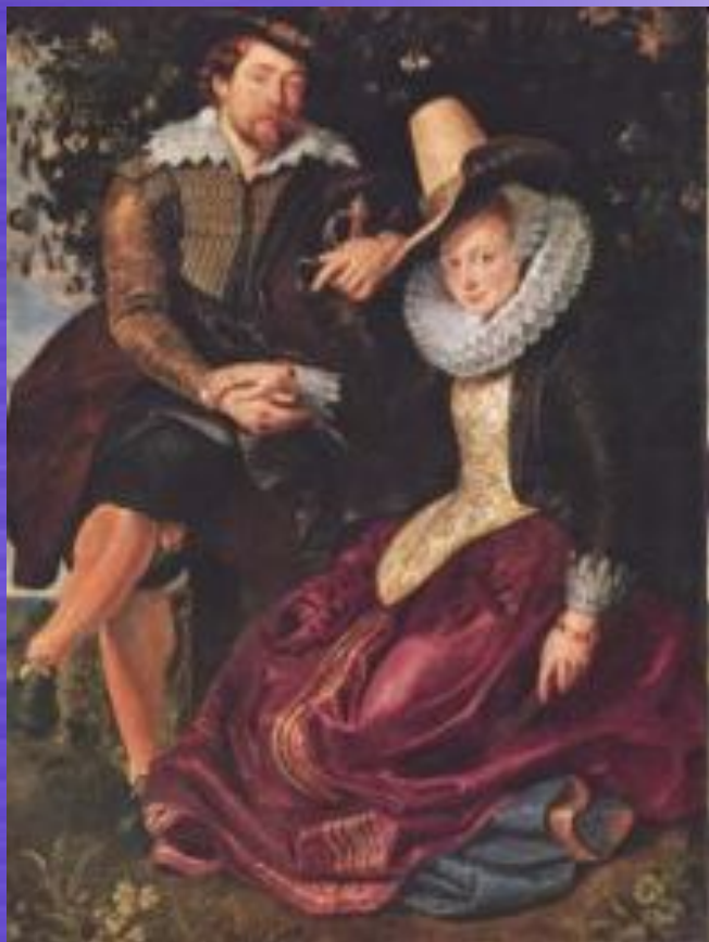
Автопортрет з Ізабеллою Брант