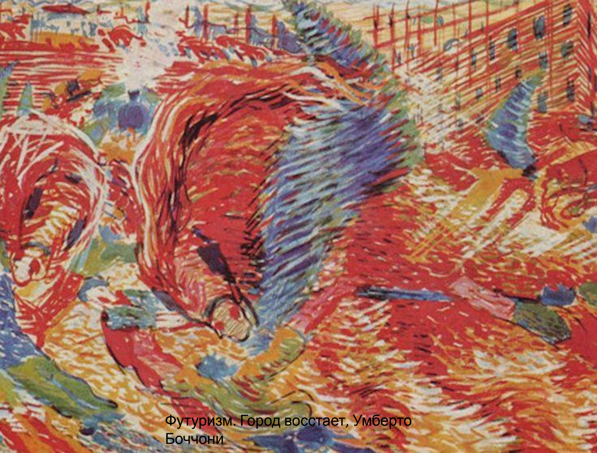
Футуризм. Город восстает, Умберто Боччони