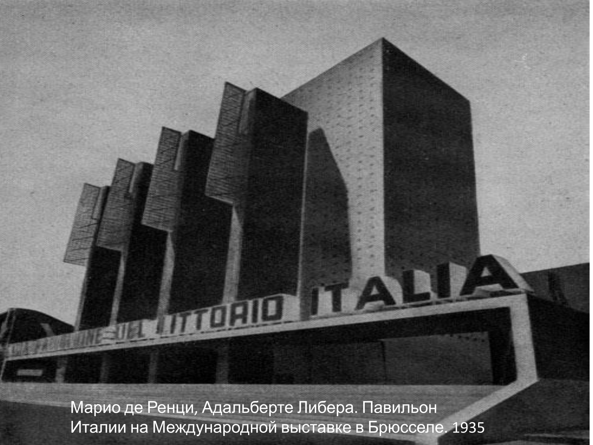
Марио де Ренци, Адальберте Либера. Павильон Италии на Международной выставке в Брюсселе. 1935