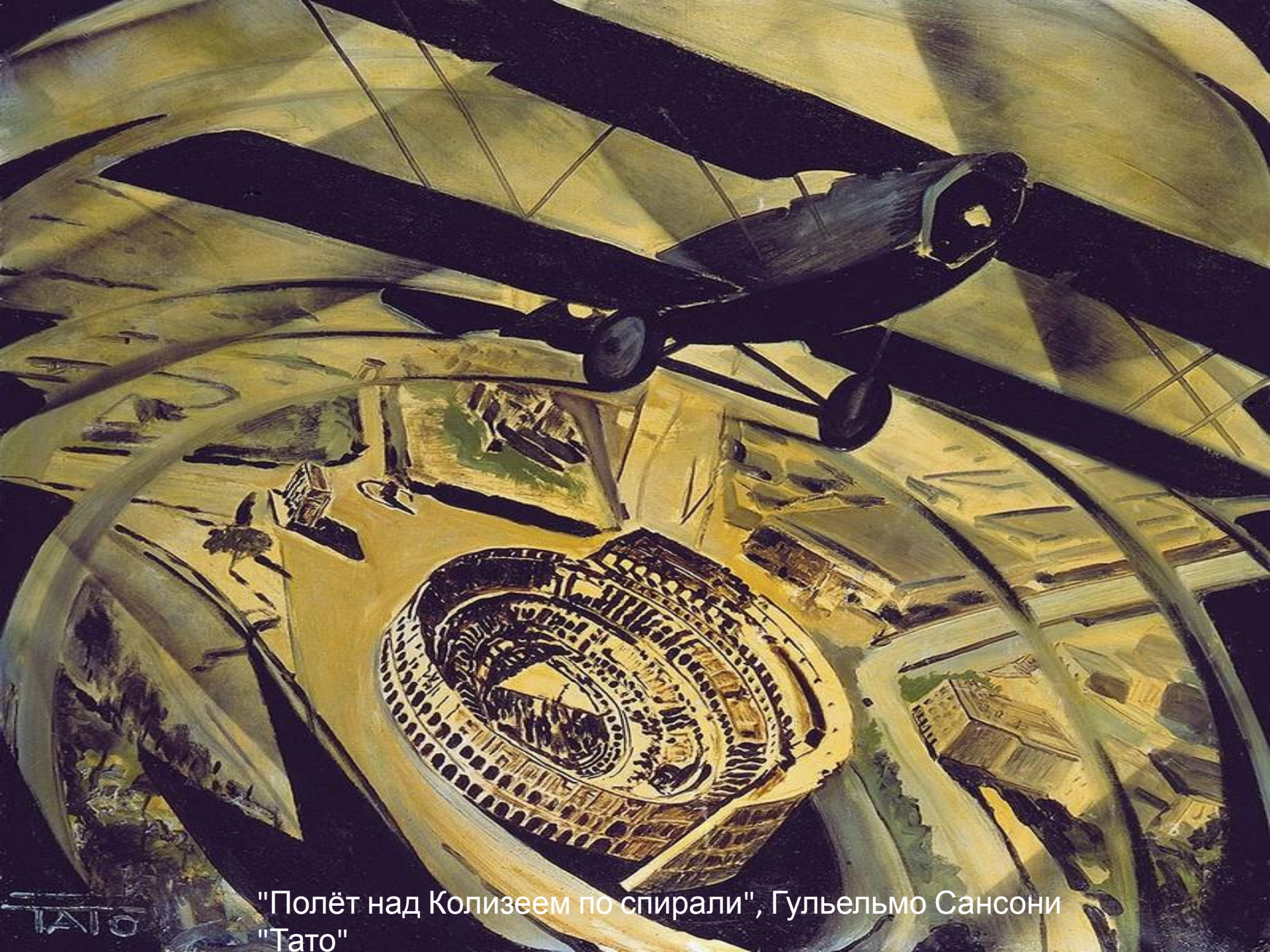
"Полёт над Колизеем по спирали", Гульельмо Сансони "Тато"