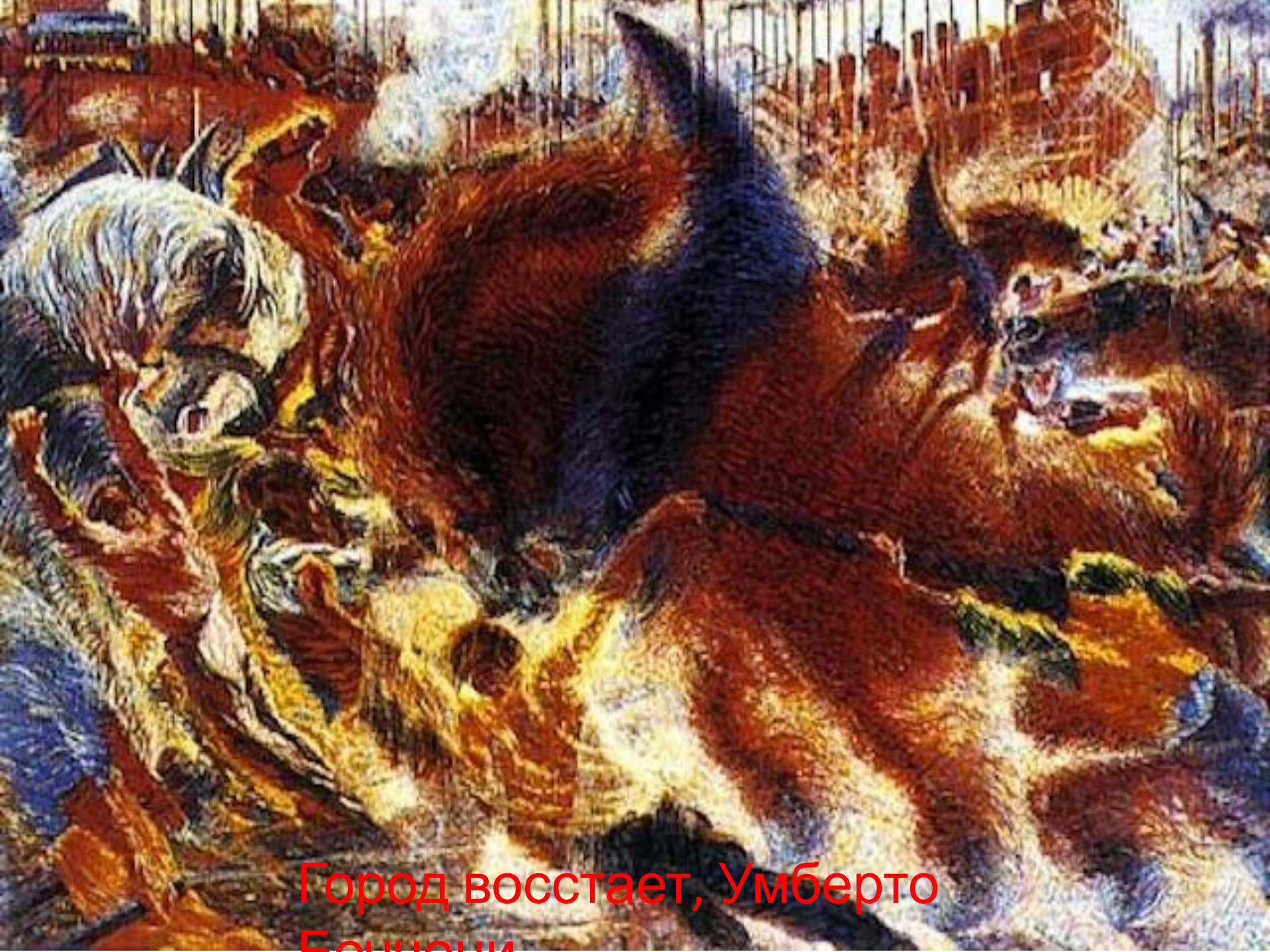
Город восстает, Умберто Боччони