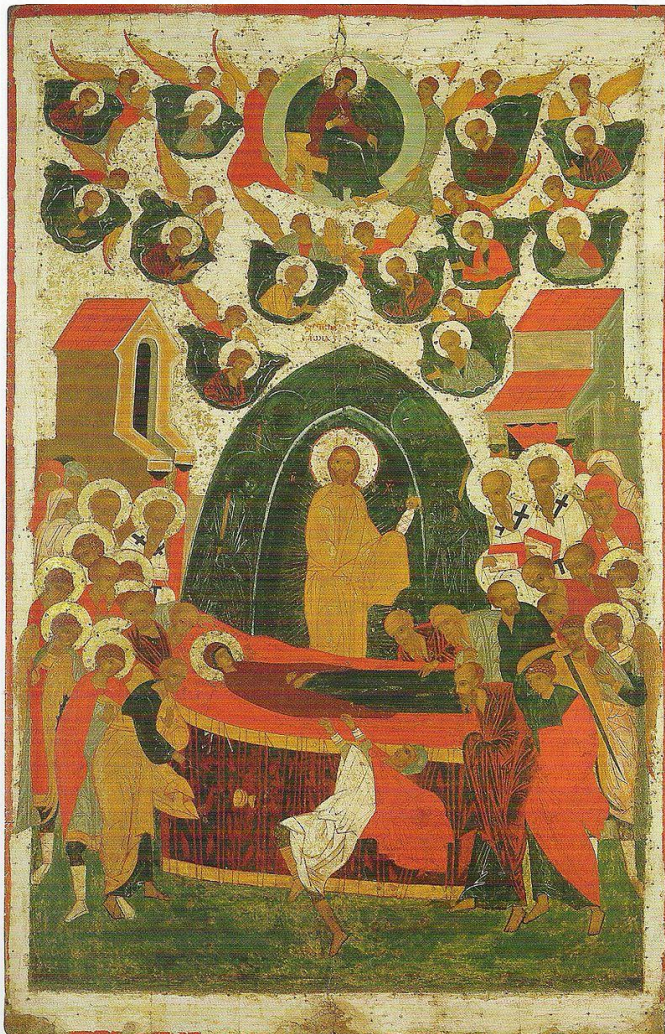
Успение Богоматери. Первая четверть XVI века.

Вологодская иконопись: Вологодская иконопись формировалась как сплав новгородской, ростовской и тверской школ, позднее испытала сильнейшее влияние московской школы. Расцвет и наиболее самостоятельный период существования вологодской школы иконописи пришёлся на XV век.