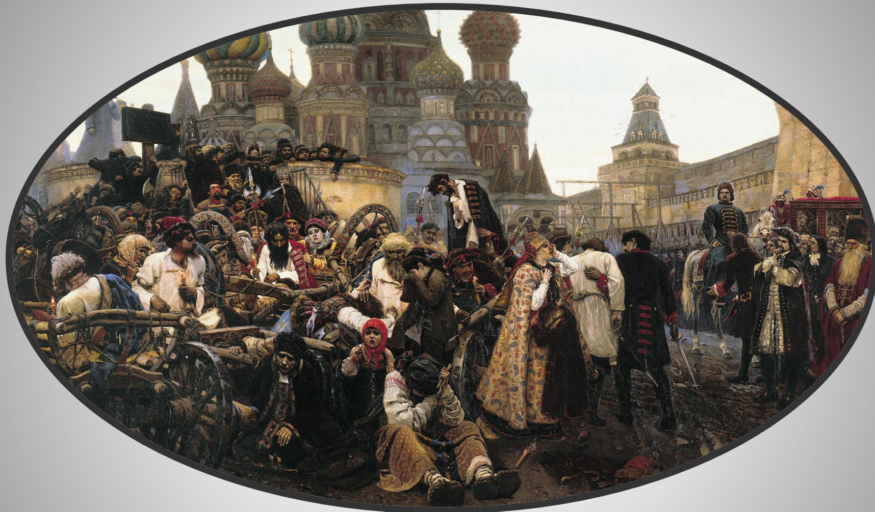
В. И. Суриков «Утро стрелецкой казни»