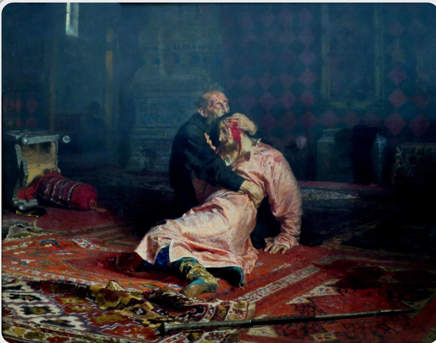
И. Е. Репин «Иван Грозный и сын его Иван»