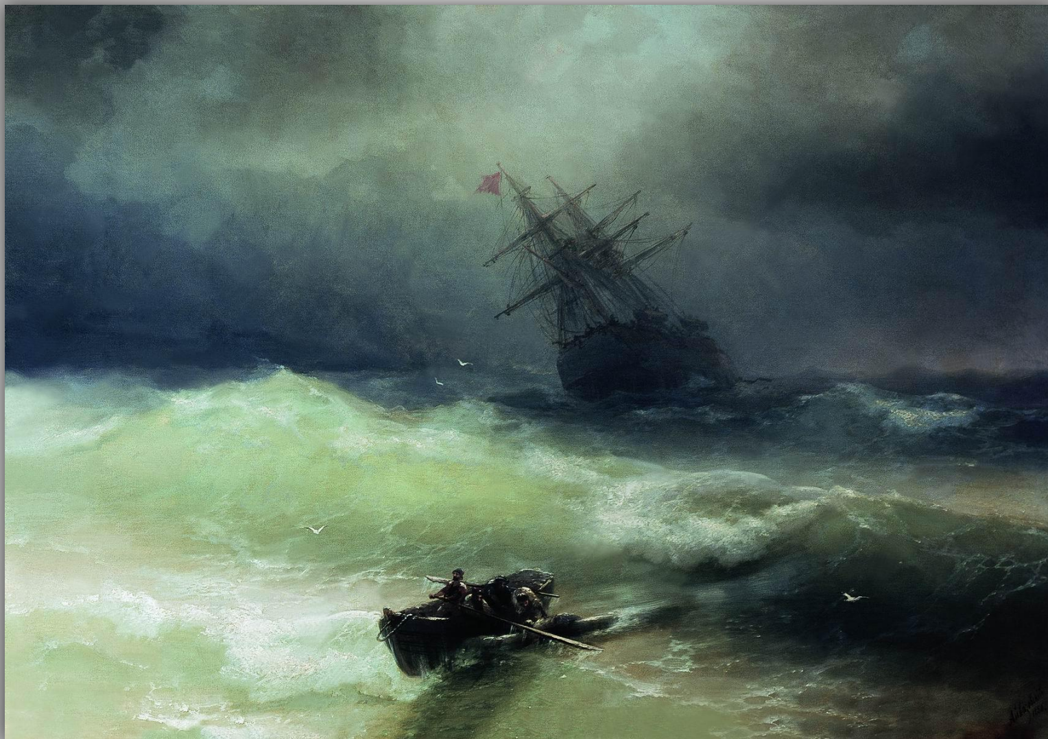
Айвазовский Иван Константинович «Буря»