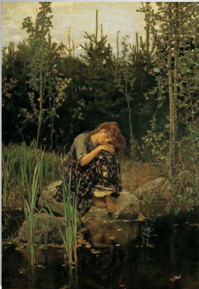
В. М. Васнецов «Алёнушка»