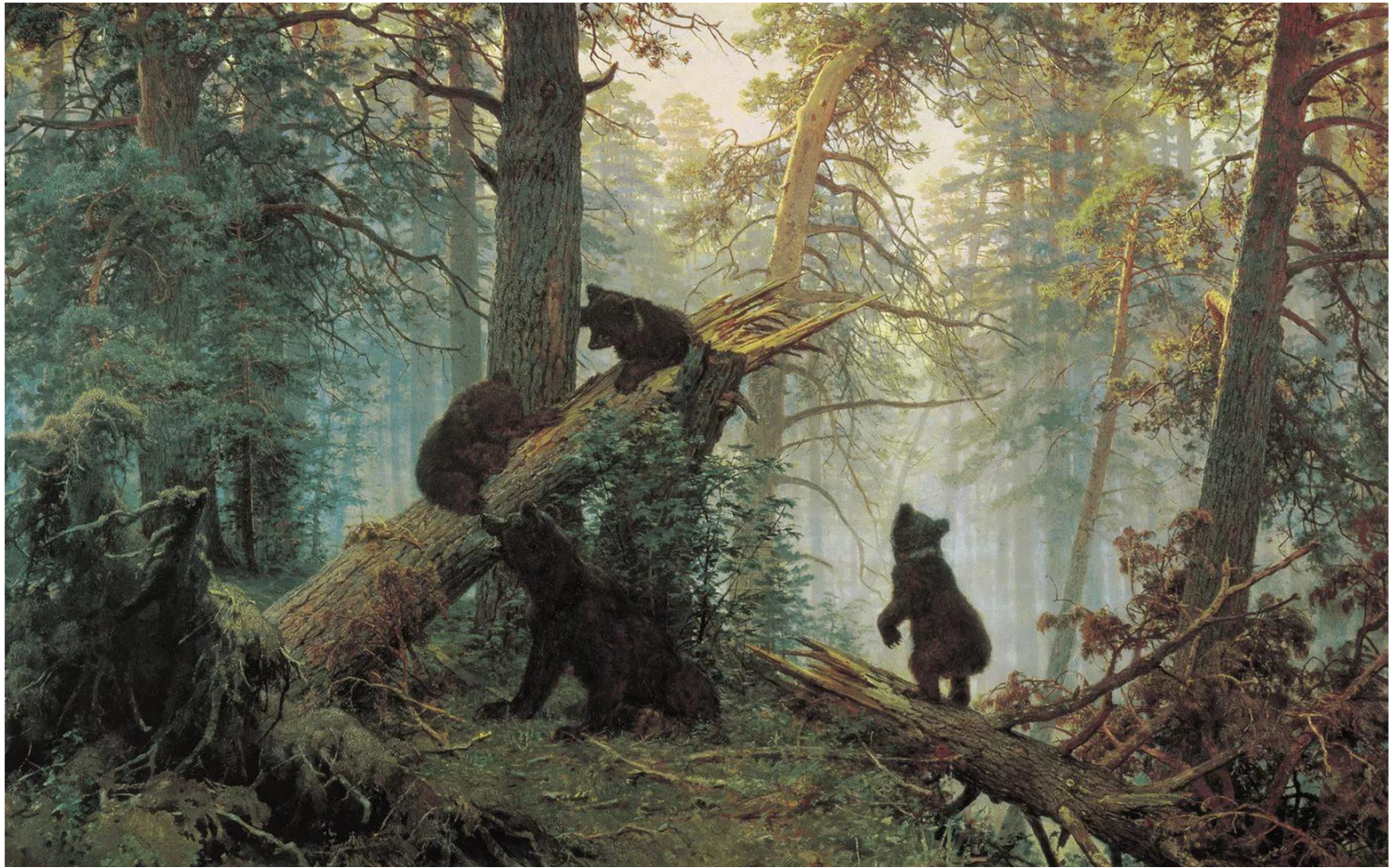
И. И. Шишкин «Утро в сосновом лесу»