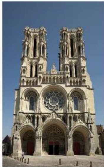
Катедральний собор міста Лан (Ланський собор)