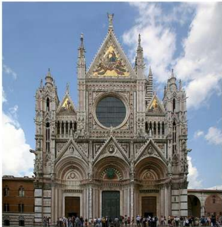
Сієнський собор. Західний фасад.