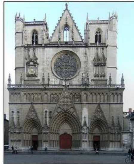
Кафедральний собор Івана Хрестителя в Ліоні