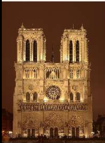
Собор Паризької Богоматері

Готика зародилася в Північній частині Франції (Іль-де-Франс) в середині XII ст. і досягла розквіту в першій половині XIII ст.