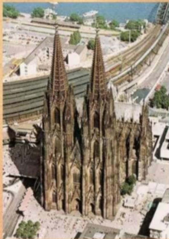
Кельнский собор. Германия 1248-1880 гг.