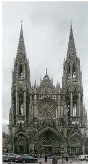
Церква Сен Уен, м. Руан