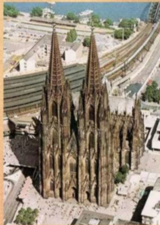
Кельнский собор. Германия 1248-1880 гг.