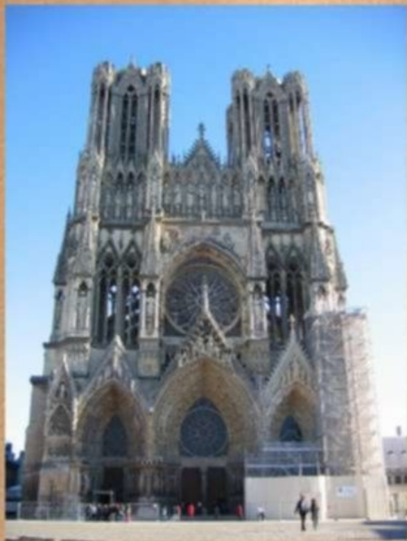
Собор в Реймсе. Франция 1211 – XV в.