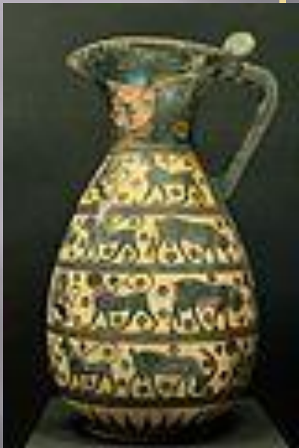
ГРЕЦЬКА ОЛЬПА З ТВАРИНАМИ, ОРІЄНТАЛІЗУЮЧИЙ СТИЛЬ, ЛУВР, ПАРИЖ.