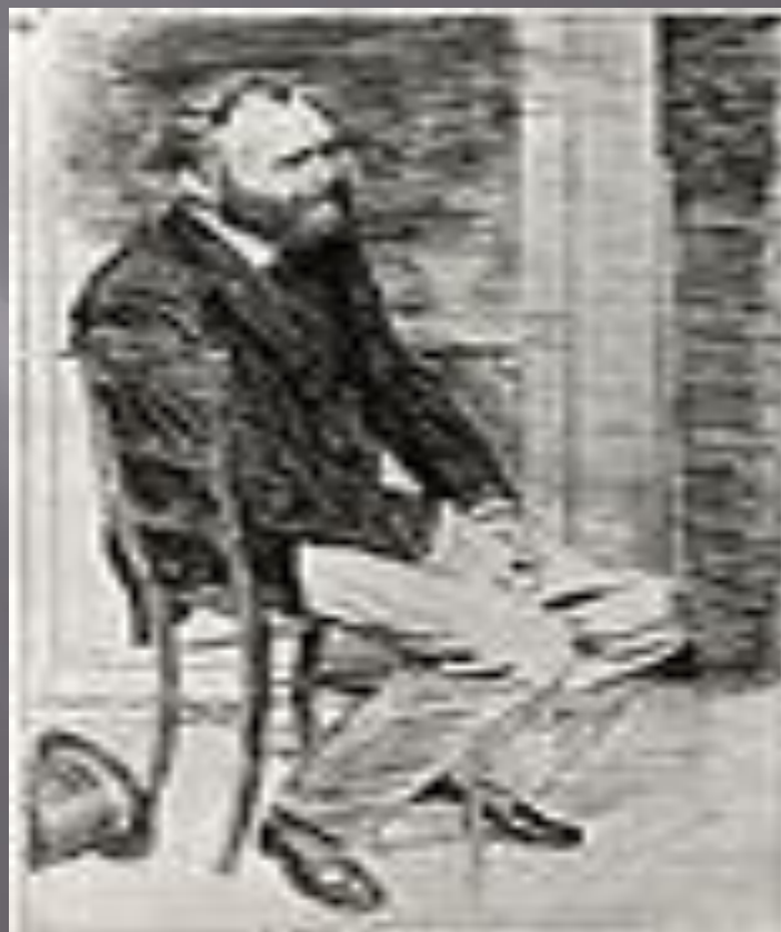
ОФОРТ Е.ДЕГА,ПОРТРЕТ ХУДОЖНИКА ЕДУАРДА МАНЕ