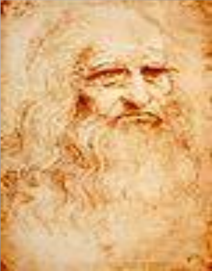
АВТОПОРТРЕТ ЛЕОНАРДО ДА ВІНЧІ