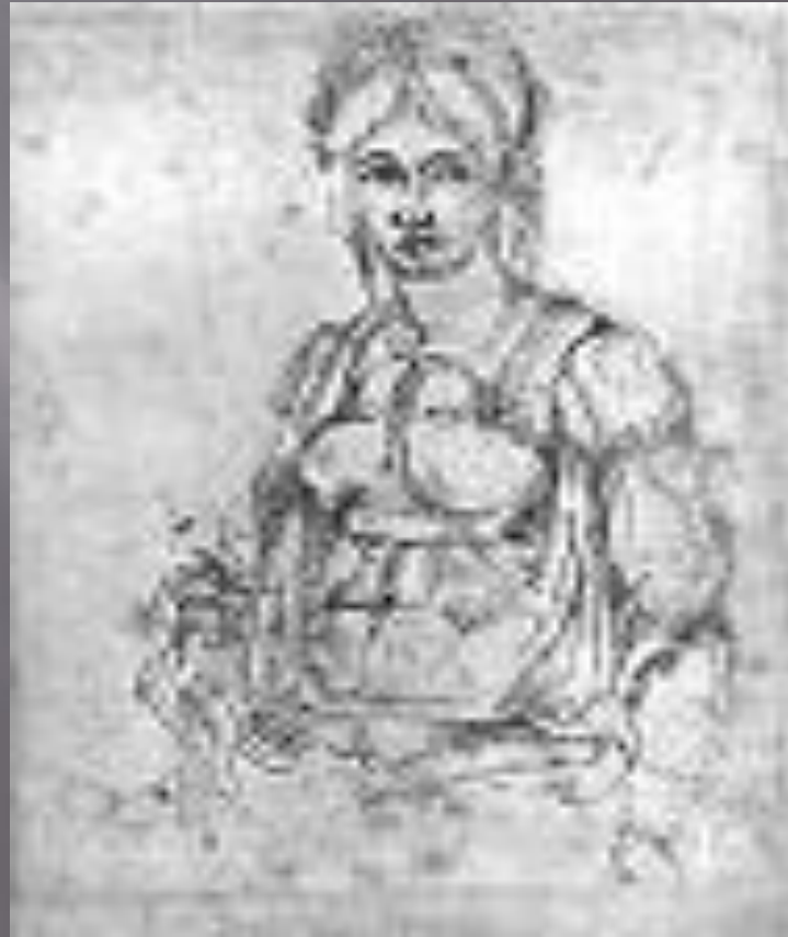
МАЛЮНОК МІКЕЛАНДЖЕЛО (ВІТТОРІЯ КОЛОННА )