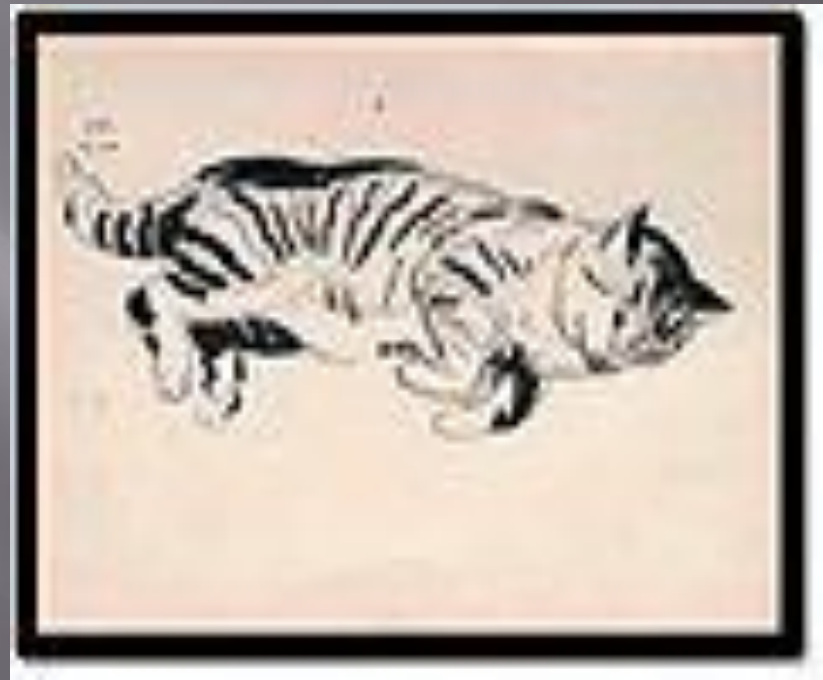
СЕРГІЙ КОНОНЧУК. «КІТ», 1937, ТУШ, ПЕРО