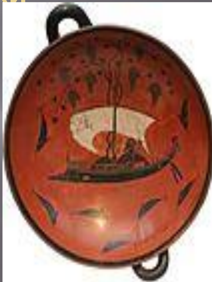
ЧАША З ОЧАМИ «ДІОНІС НА КОРАБЛІ ПІРАТІВ», ВАЗОПИСЕЦЬ ЕКСЕКІЙ.