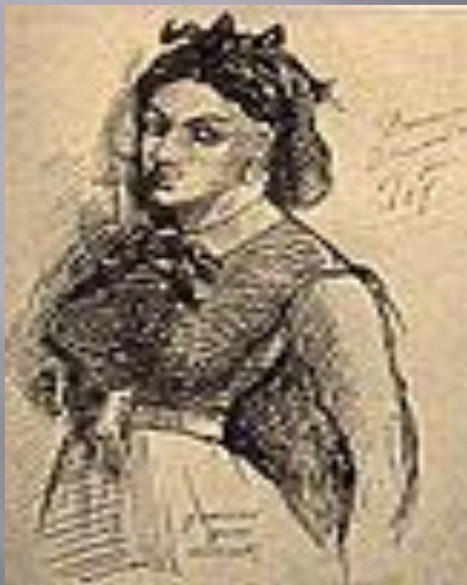
АКТОРКА І КОХАНА БОДЛЕРА-ЖАННА ДЮВАЛЬ. МАЛЮНОК БОДЛЕРА