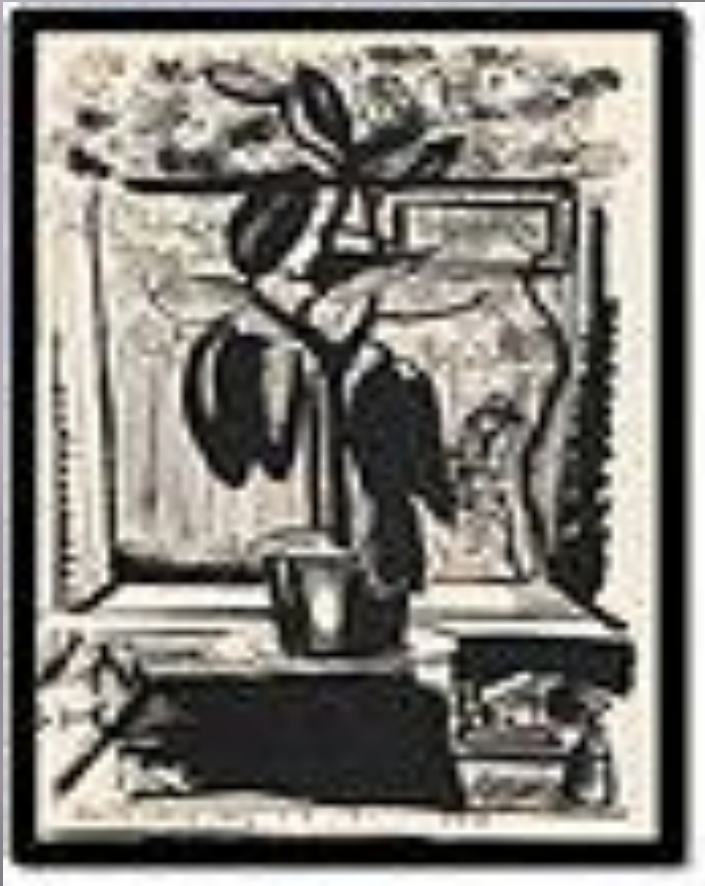
СЕРГІЙ КОНОНЧУК. «ДОЩ, ДОЩ, ДОЩ...», 1934, ТУШ, ПЕНЗЕЛЬ