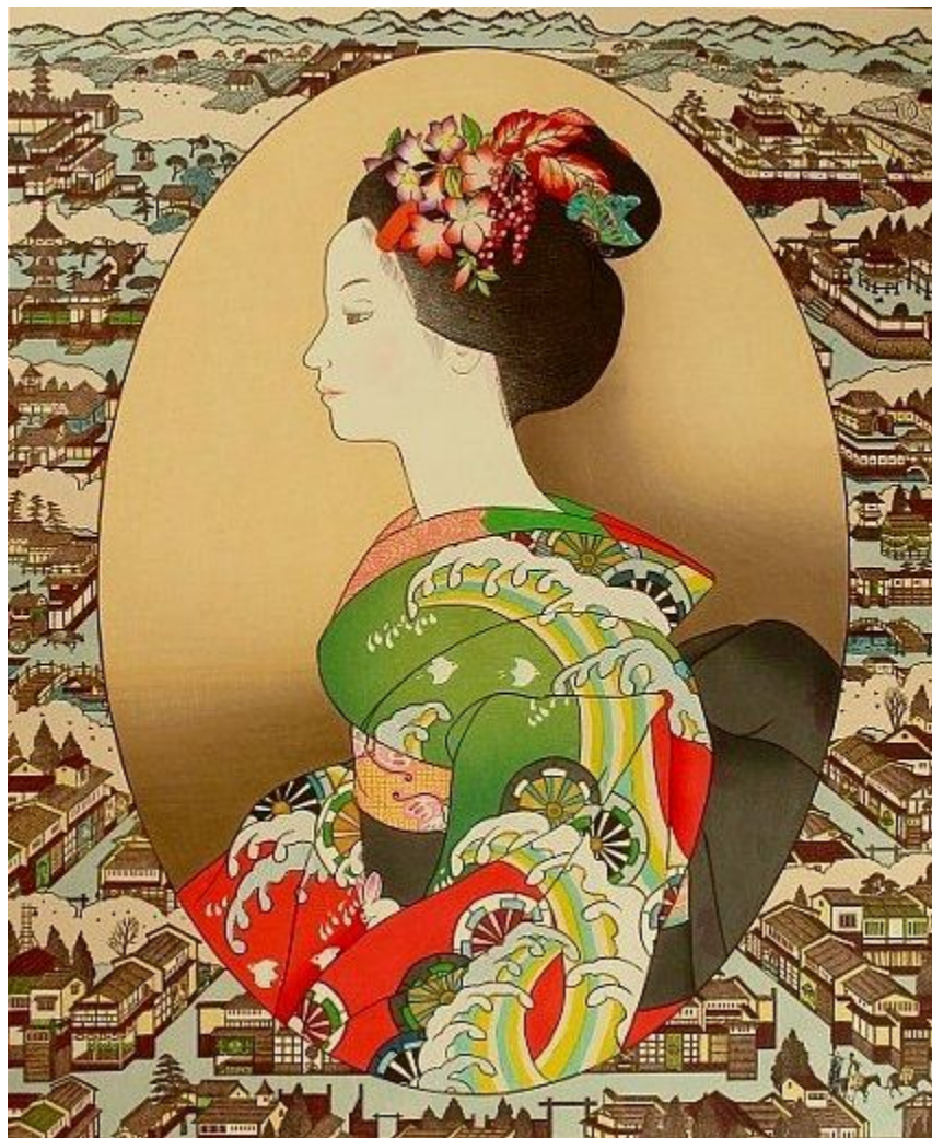
Ryusei Okamoto, born 1949