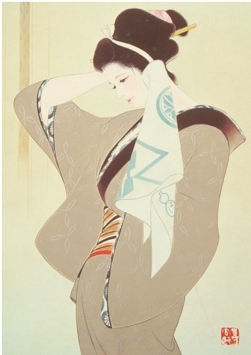
Sentaro Iwata 1901-1974 - Красавица после ванны