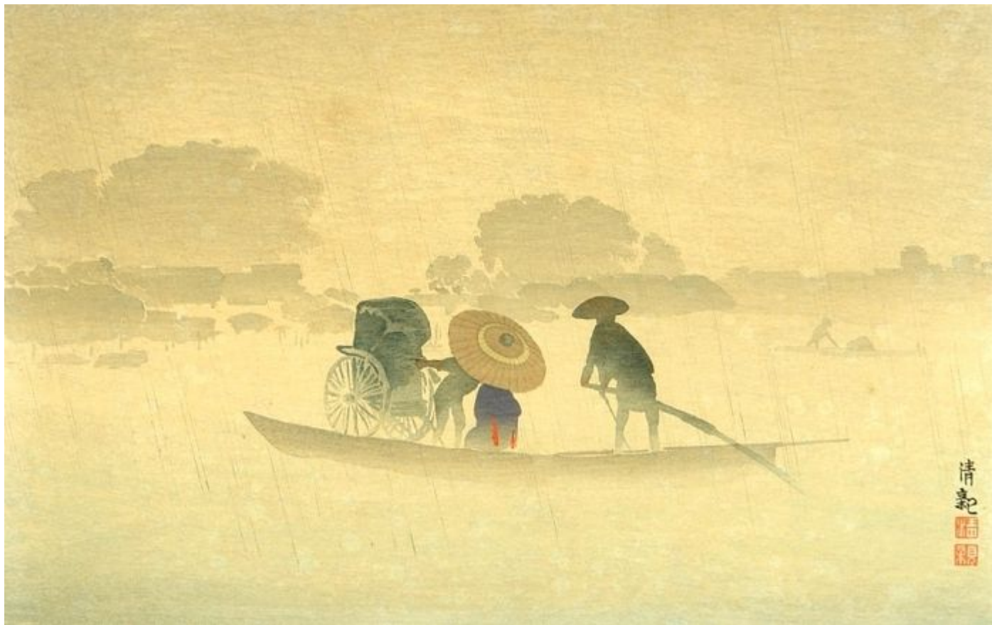
Kiyochika Kobayashi 1847-1915 - Паром в весенний дождь

Одно доброе слово может согреть три зимних месяца