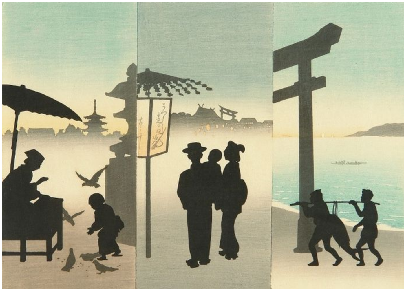
Неизвестный художник - Силуэты людей, ок.1930

Холодный чай и холодный рис терпимы, но холодный взгляд и холодное слово — невыносимы