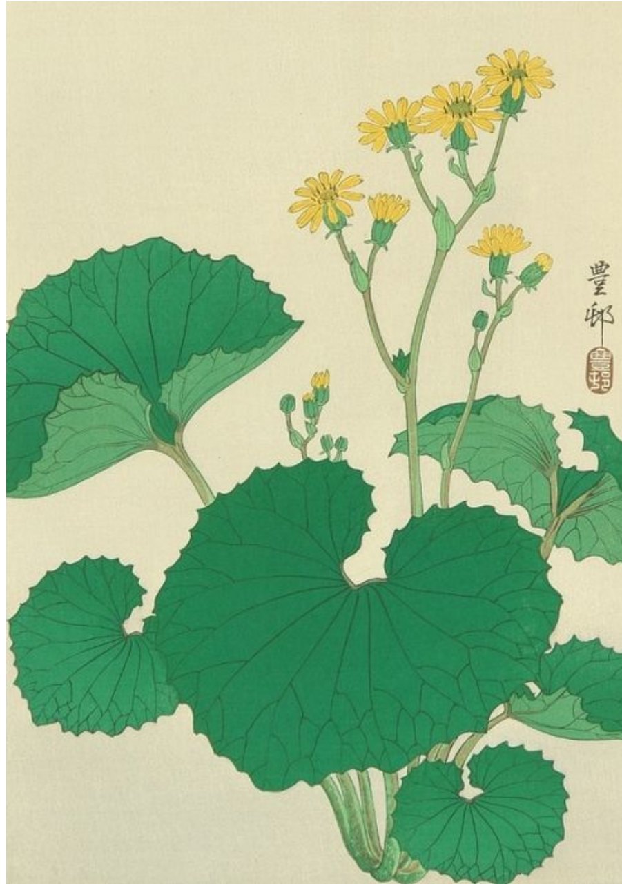
Koson Ohara 1877-1945 - Ligularia - Японский Серебряный лист

Чем меньше умения, тем больше самоуверенности