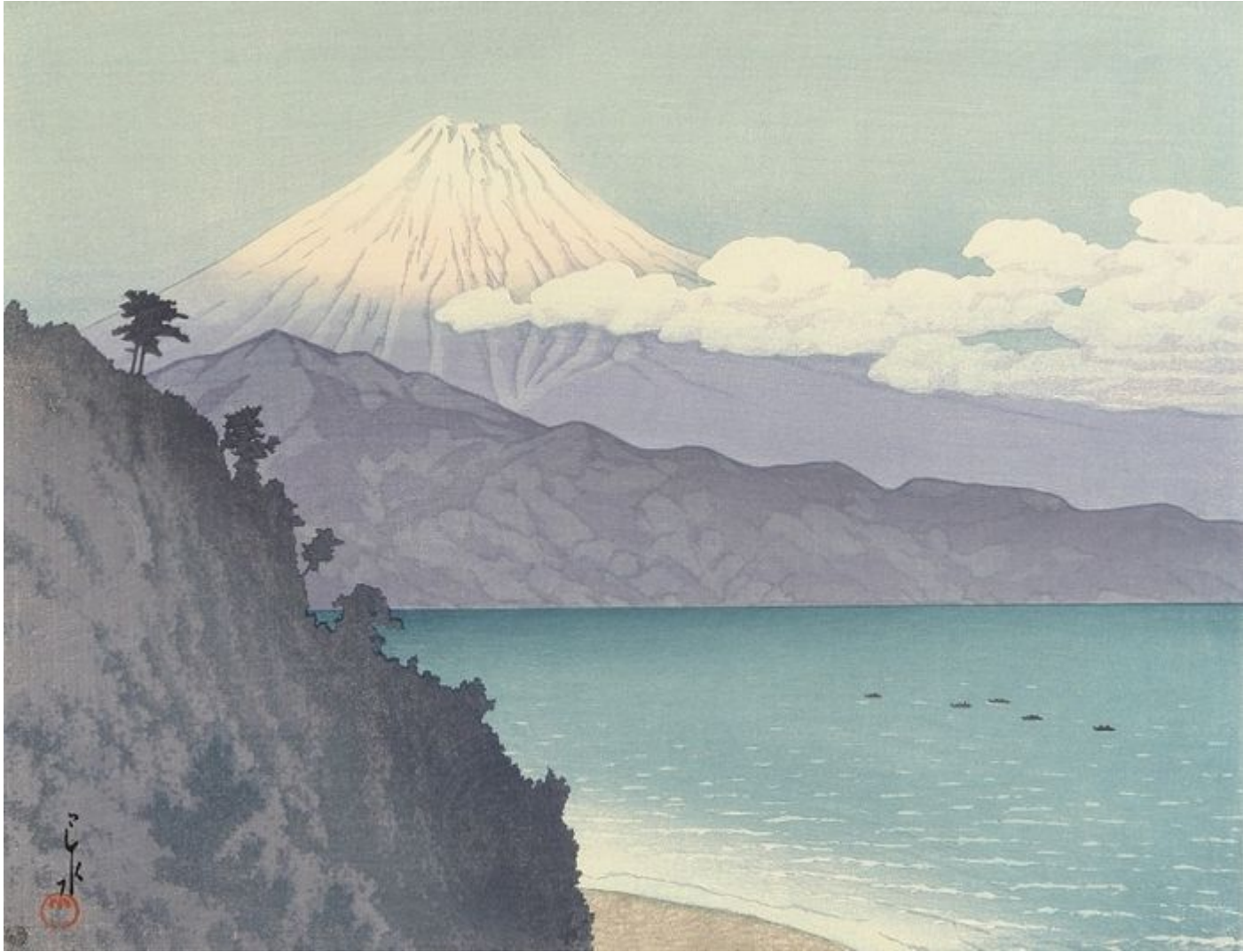
Hasui Kawase 1883-1957 - Гора Фуджи от перевала Satta