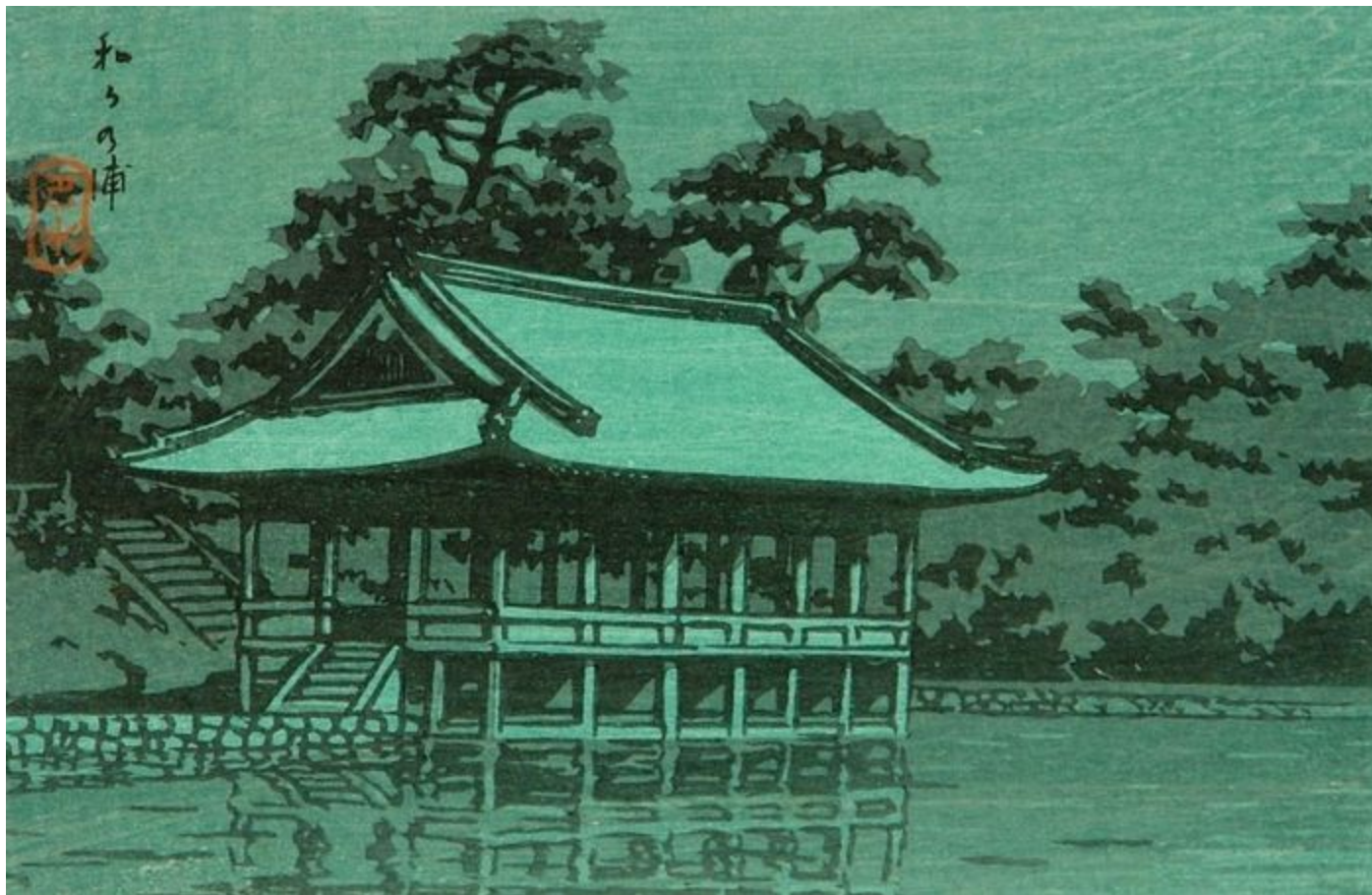
Hasui Kawase 1883-1957 - Wakanoura

Море потому велико, что и мелкими речками не брезгует