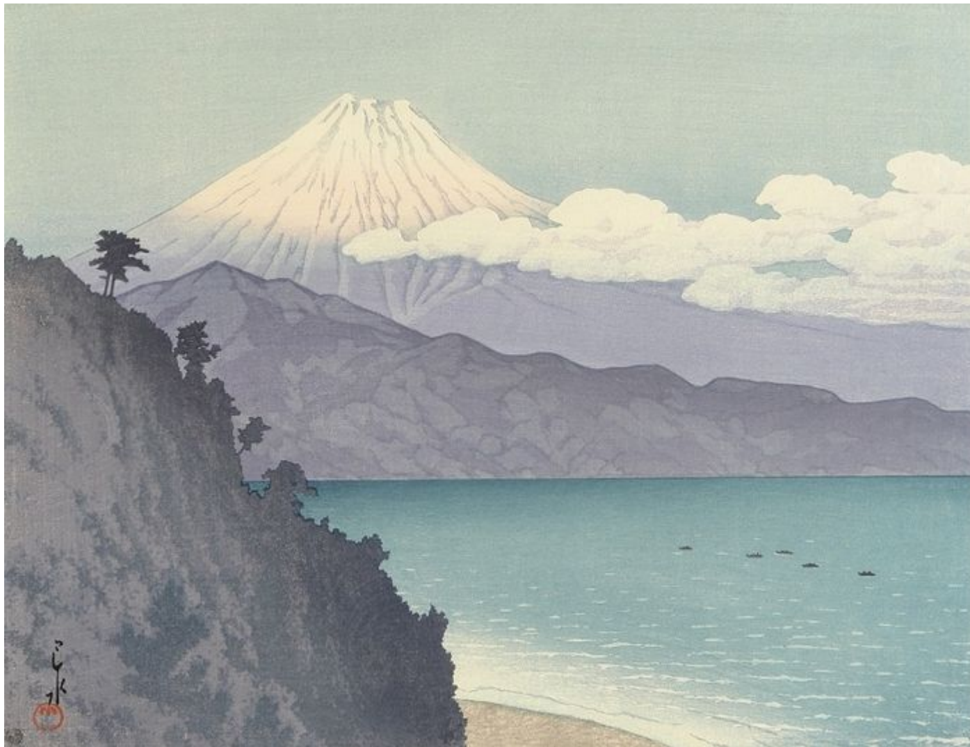
Hasui Kawase 1883-1957 - Гора Фуджи от перевала Satta