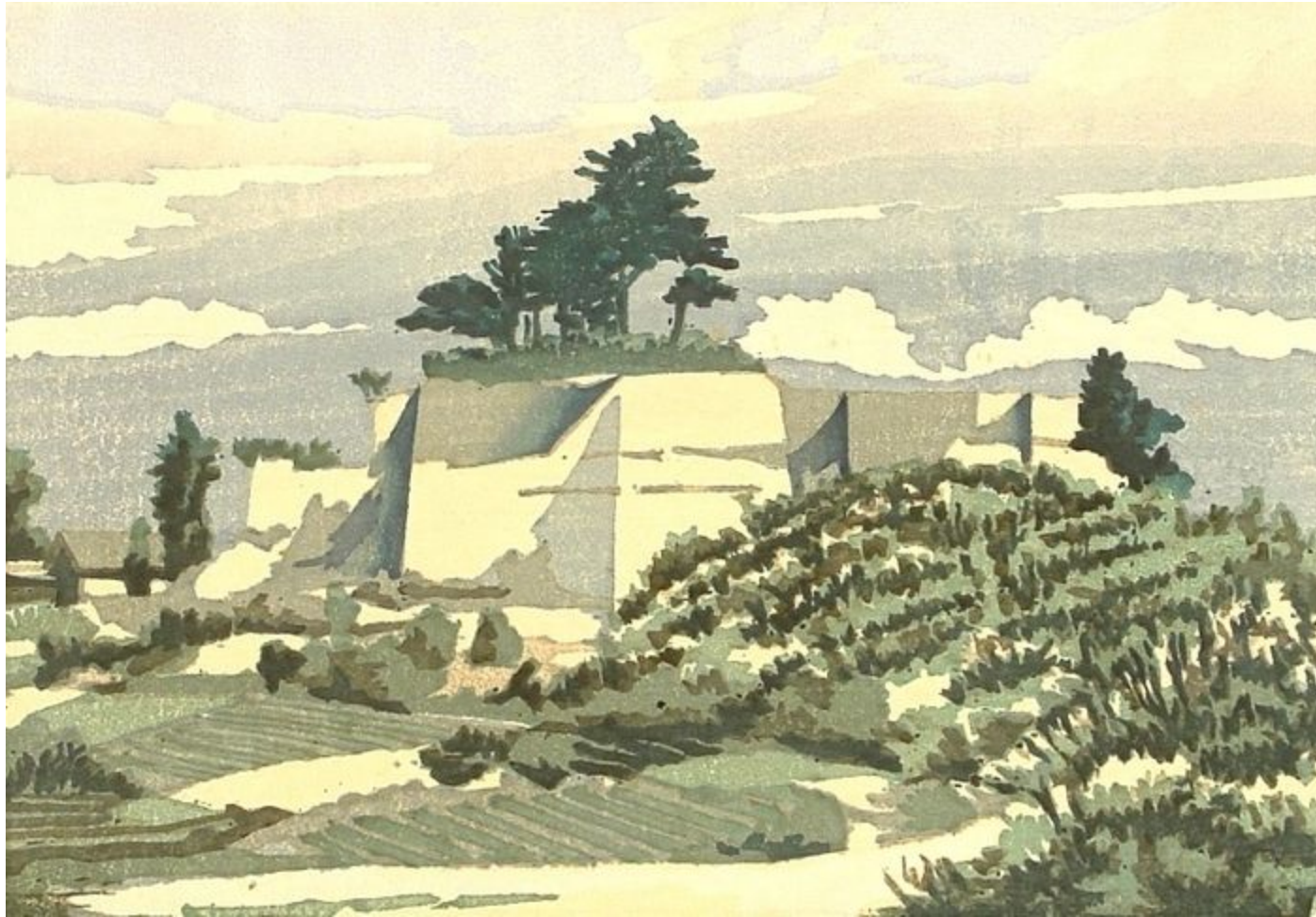
One Hundred Famous Views of Kuwana - Каменные стены, 1956

Муж с женой должны быть подобны руке и глазам: когда руке больно — глаза плачут, а когда глаза плачут — руки вытирают слёзы