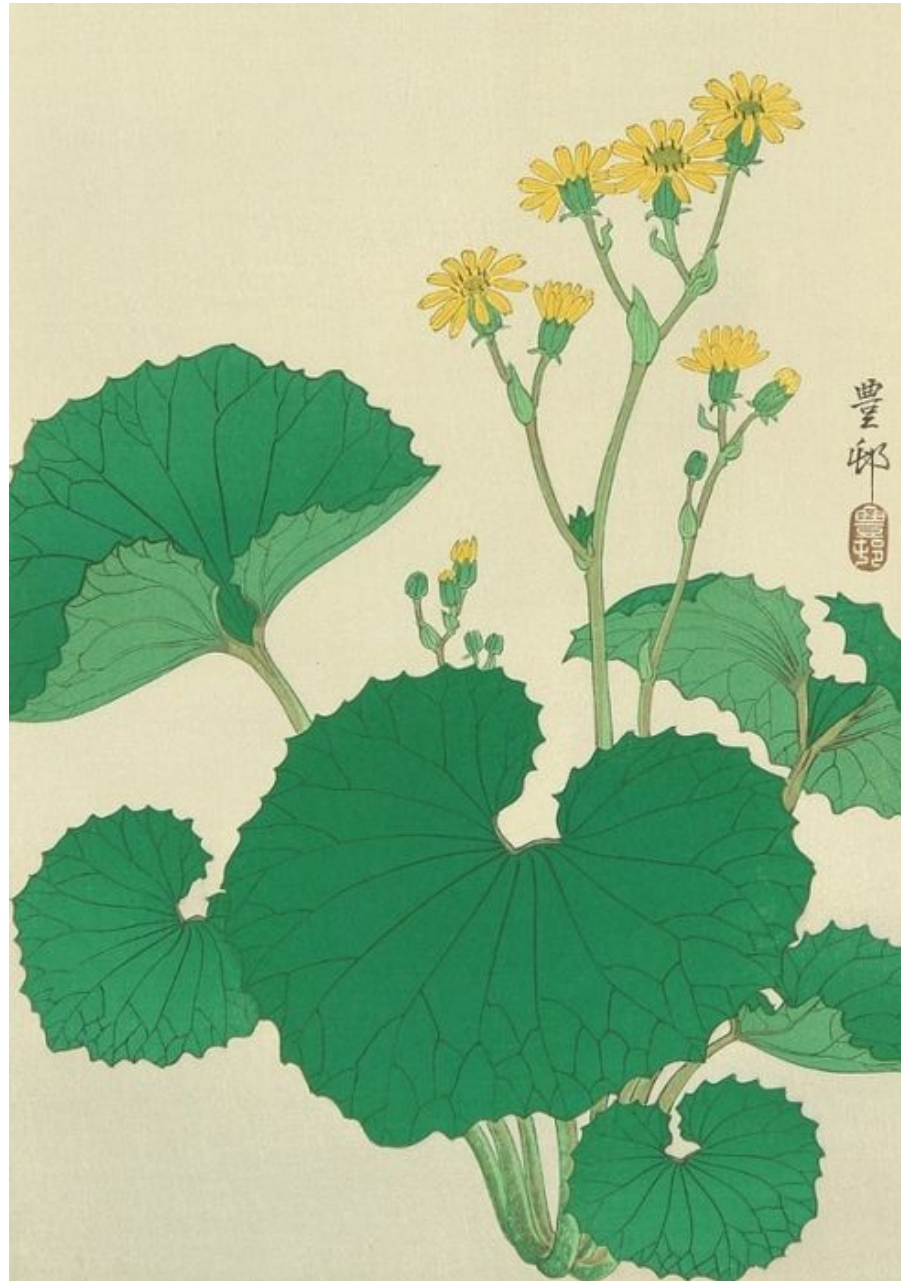
Koson Ohara 1877-1945 - Ligularia - Японский Серебряный лист

Чем меньше умения, тем больше самоуверенности