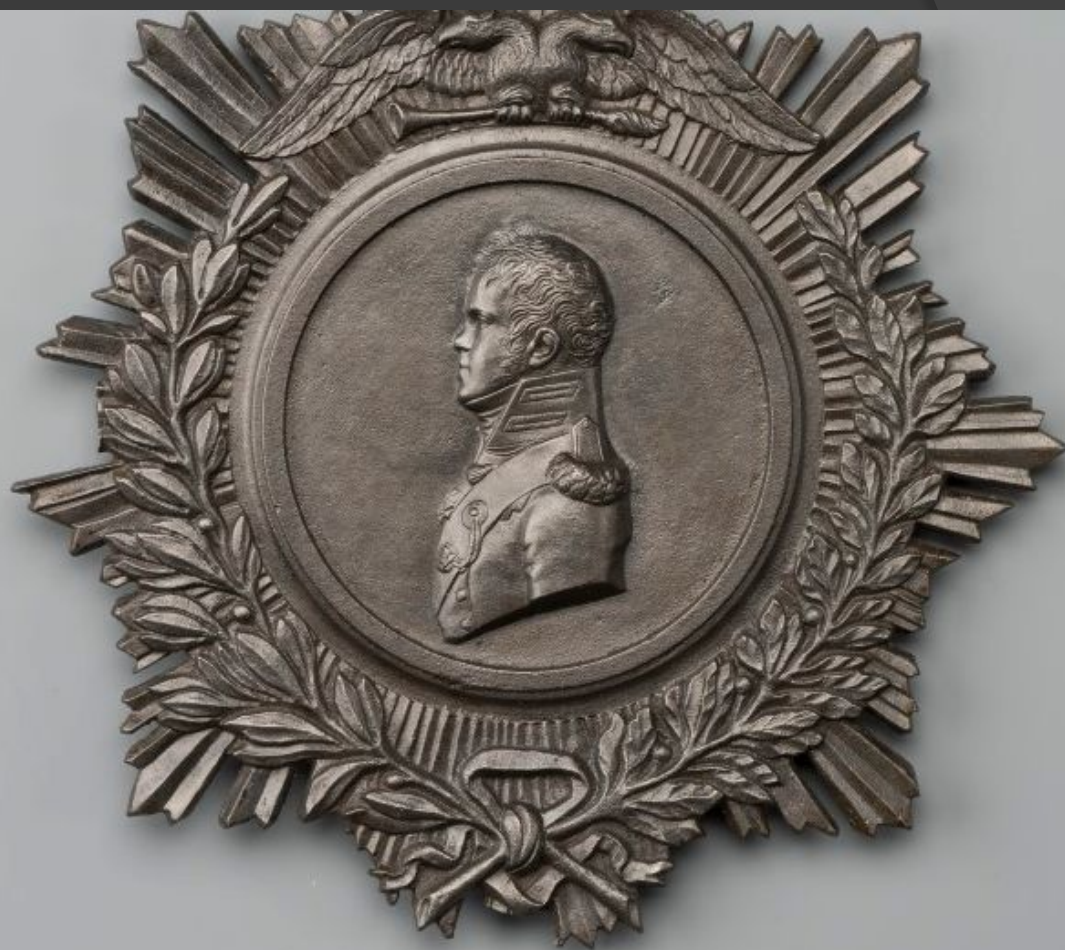
Медальон с изображением великого князя Константина Павловича. Верх-Исетский завод, 1810-е

Кстати, мало кто знает, что «родной» цвет Чугуна – белый или серый, просто Традиционно окрашивается он голландской сажей.