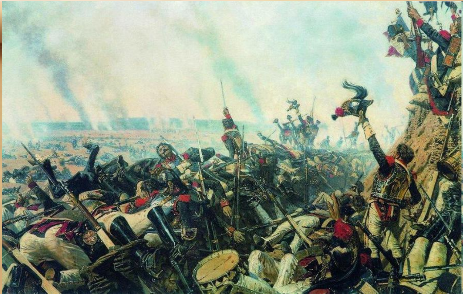
Конец Бородинской битвы, 1900