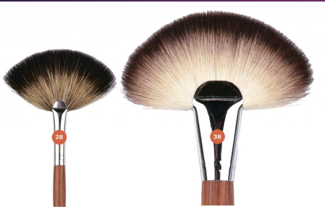
Jean's КИСТЬ ВЕЕРНАЯ

№28 - 7 мм Изготовлена из волоса енота. Используется для удаления осыпавшейся туши, теней, излишков пудры и румян. Материал ручки - дерево.