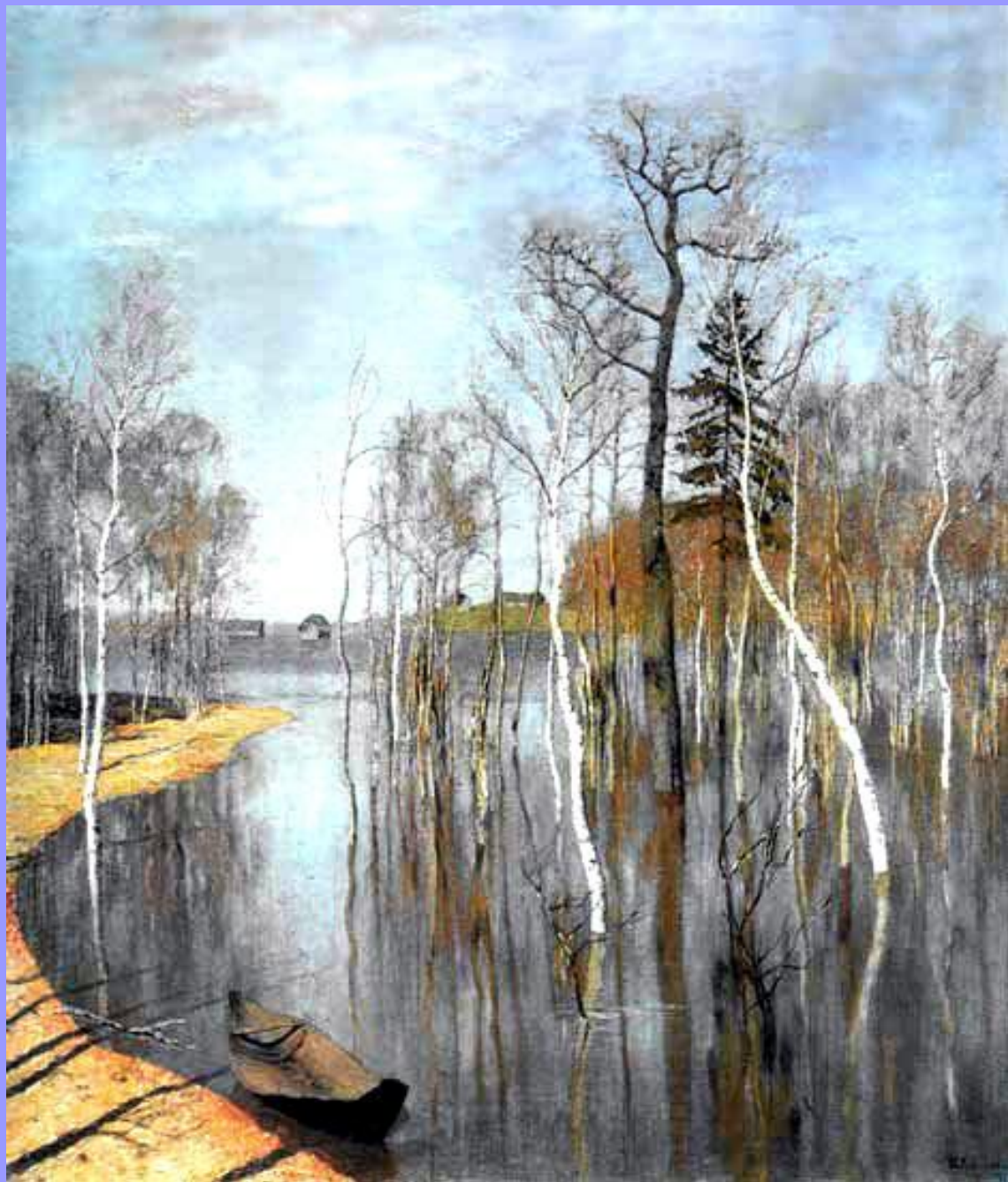
Весна. Большая вода. 1897