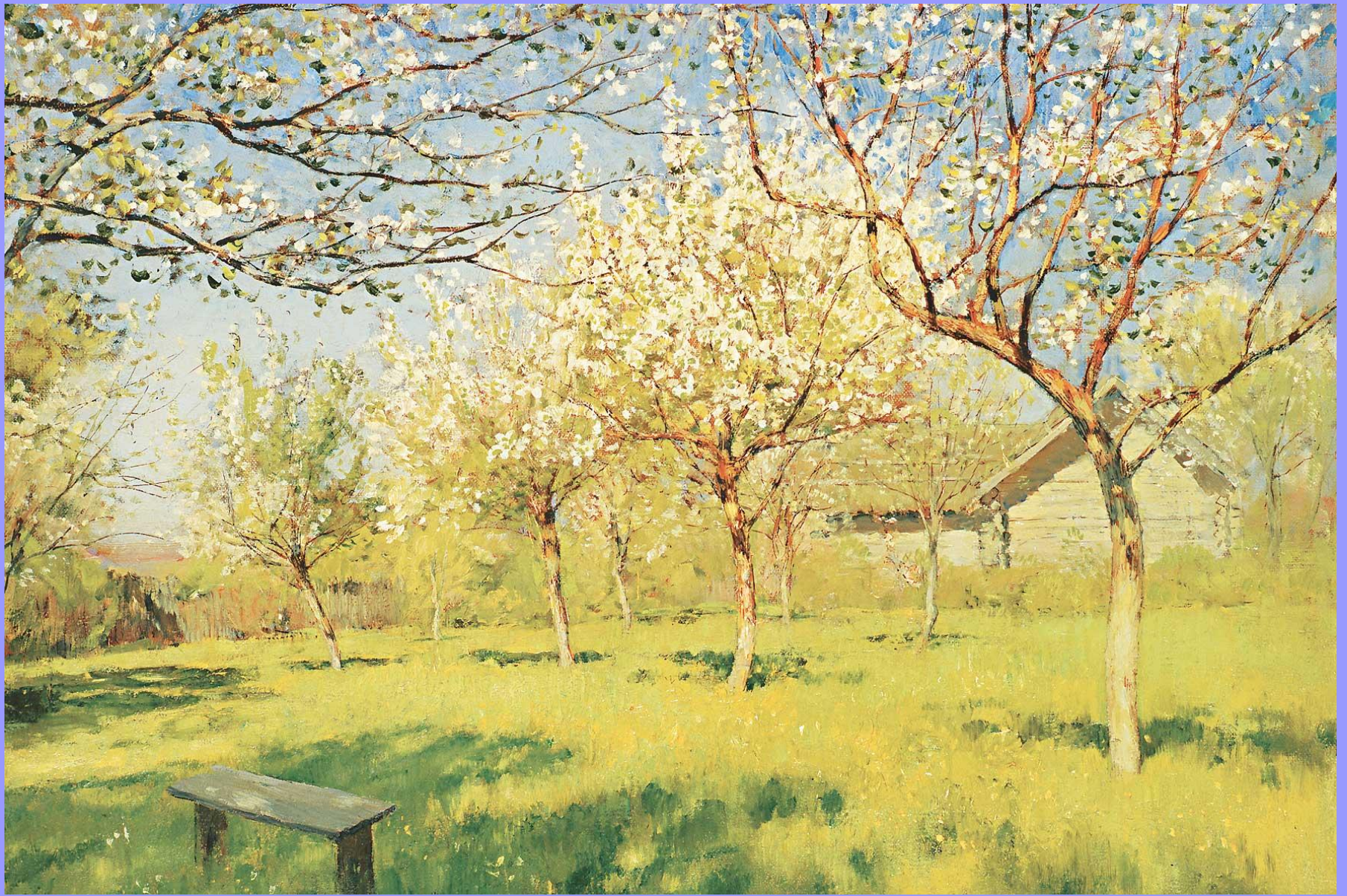
Цветущие яблони. 1896