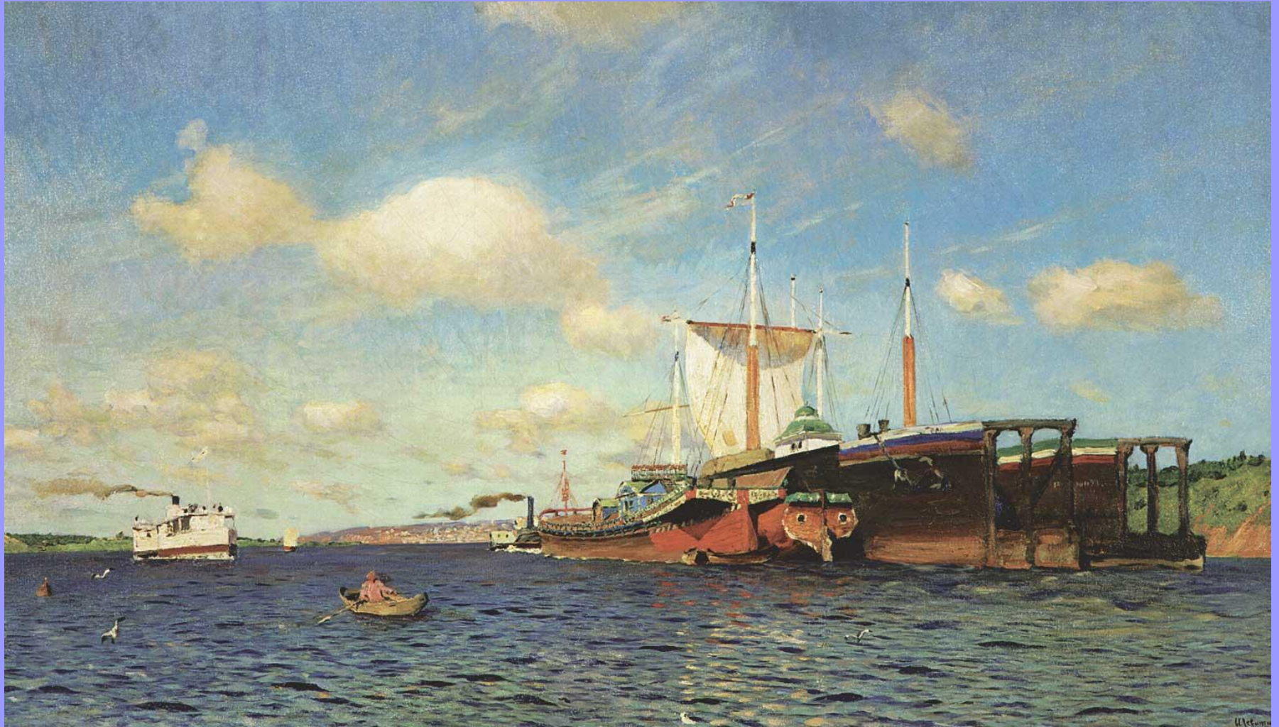
Свежий ветер. Волга. 1895

Картины, написанные во время путешествия по Волге. Поиски больших образов. В линейной стилизации картины «Над вечным покоем» есть что-то от модерна.