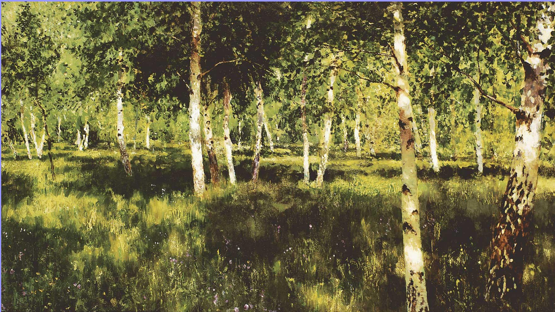
Березовая роща. 1889