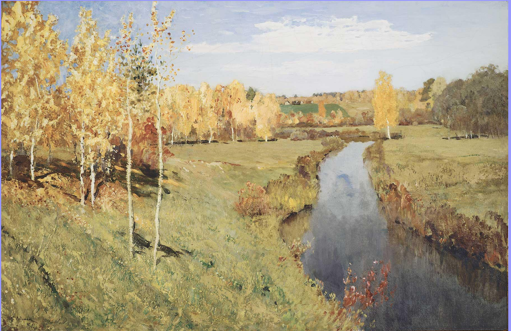
Золотая осень. 1895

«Золотая осень» и «Март» – центральные среди работ 1890-х гг.