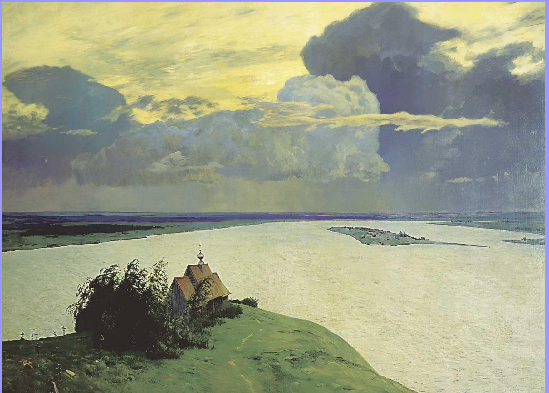
Над вечным покоем. 1894