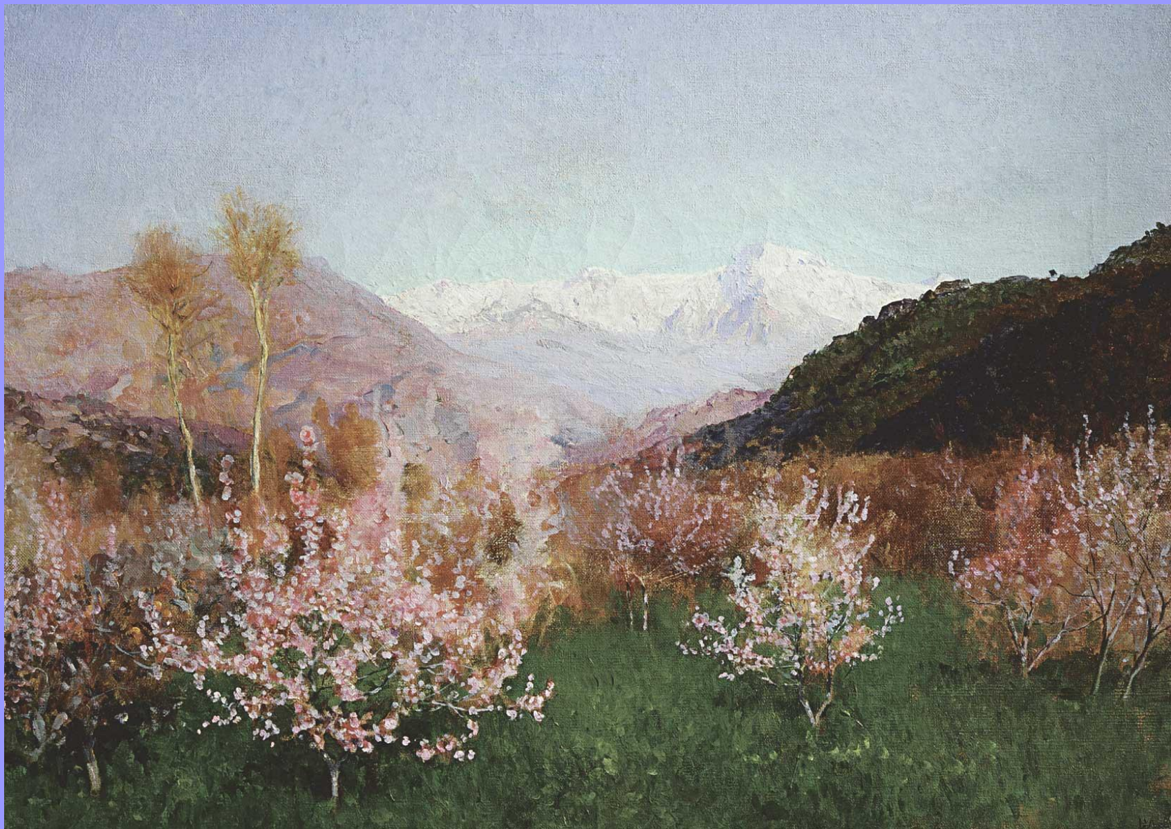
Весна в Италии. 1890