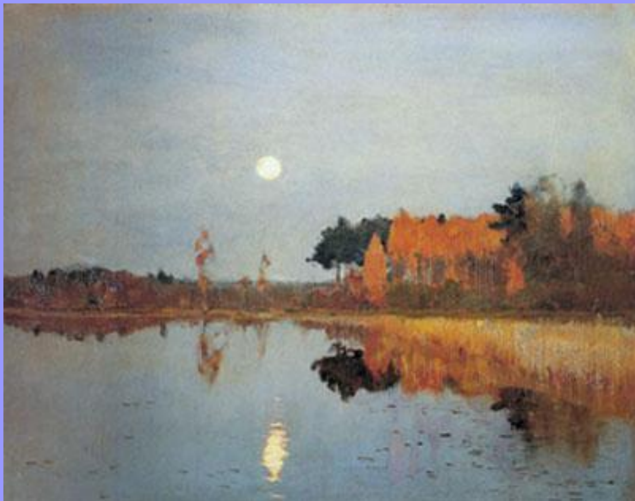
Левитан. Сумерки. Луна. 1899

Презентация подготовлена Е. Князевой на основании материала В. Хан-Магомедовой Газета «Искусство» № 2/2011