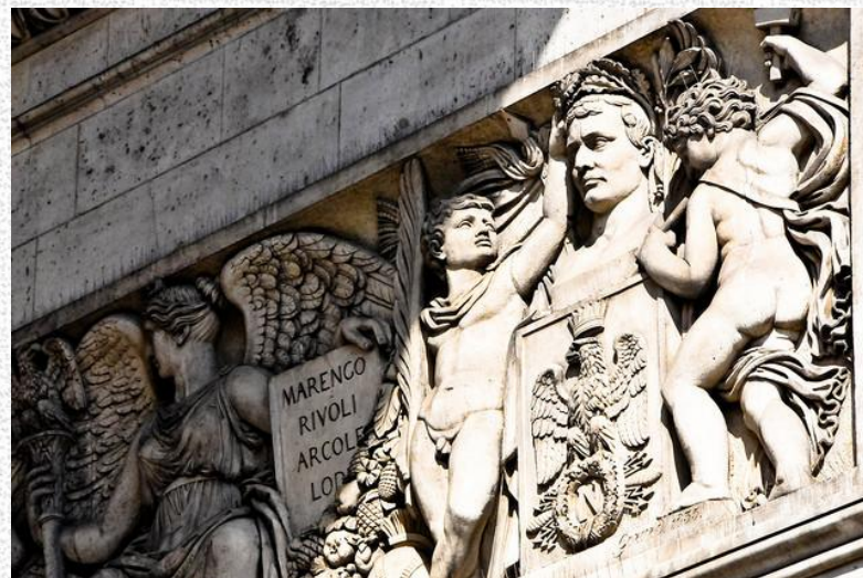
Триумфальная арка в Париже. Арх. Жан Франсуа Шальгрэн и др. Фрагменты