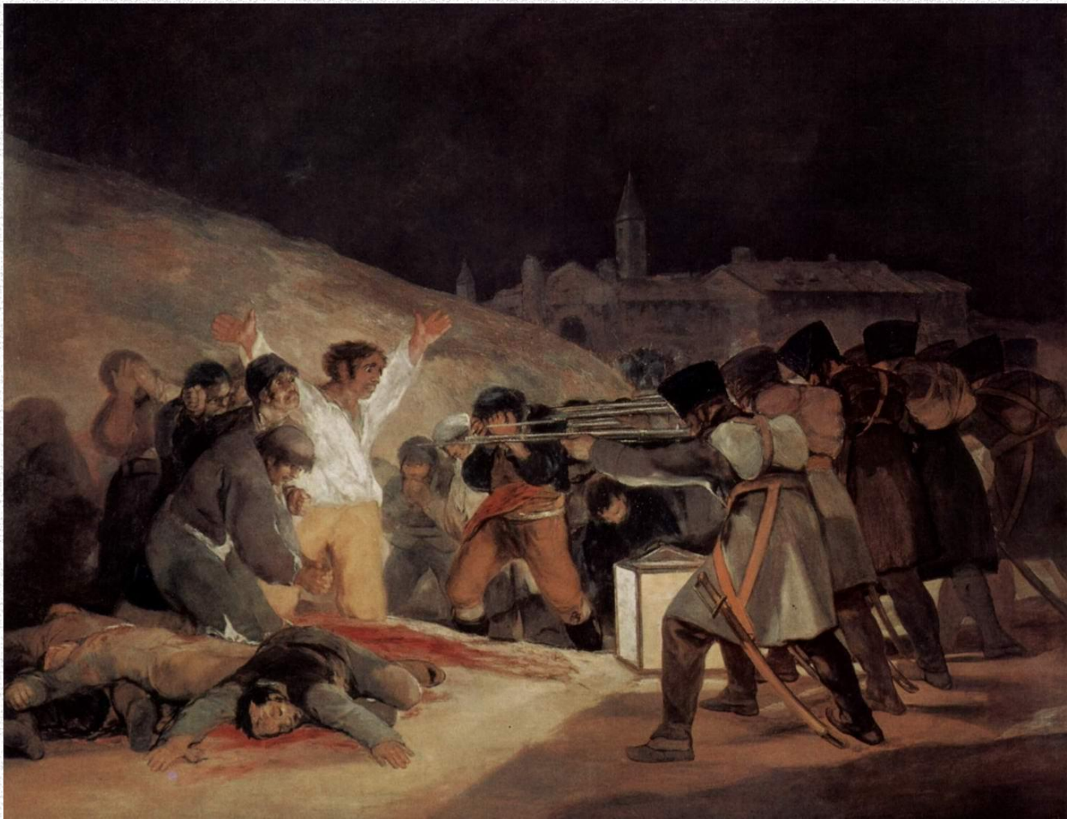
Расстрел повстанцев в ночь на 3 мая 1808 года Около 1814 Холст, масло. 268 x 347 см Музей Прадо, Мадрид