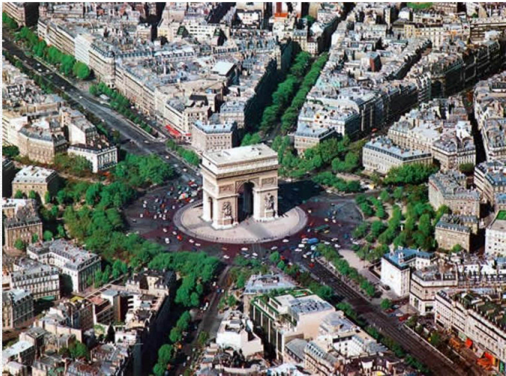
Триумфальная арка в Париже. Арх. Жан Франсуа Шальгрэн и др.