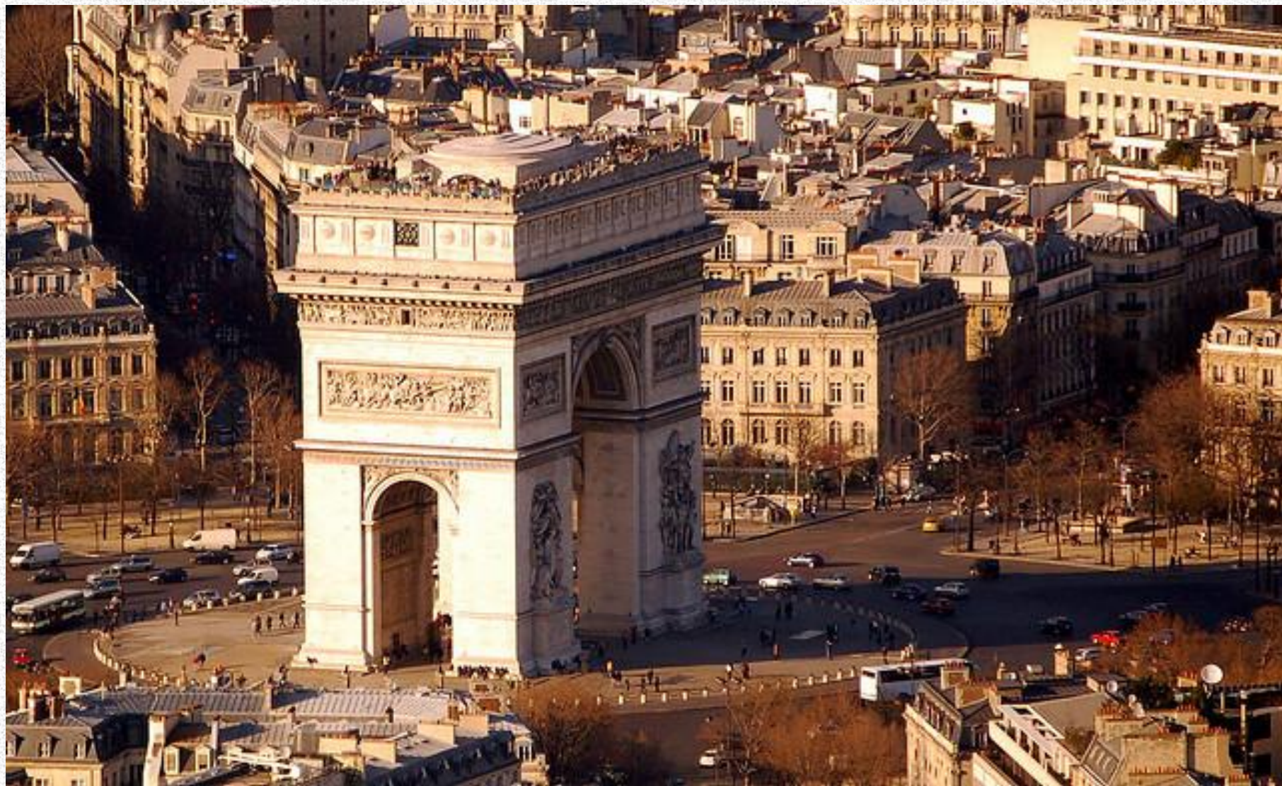
Триумфальная арка в Париже. Арх. Жан Франсуа Шальгрен и др.