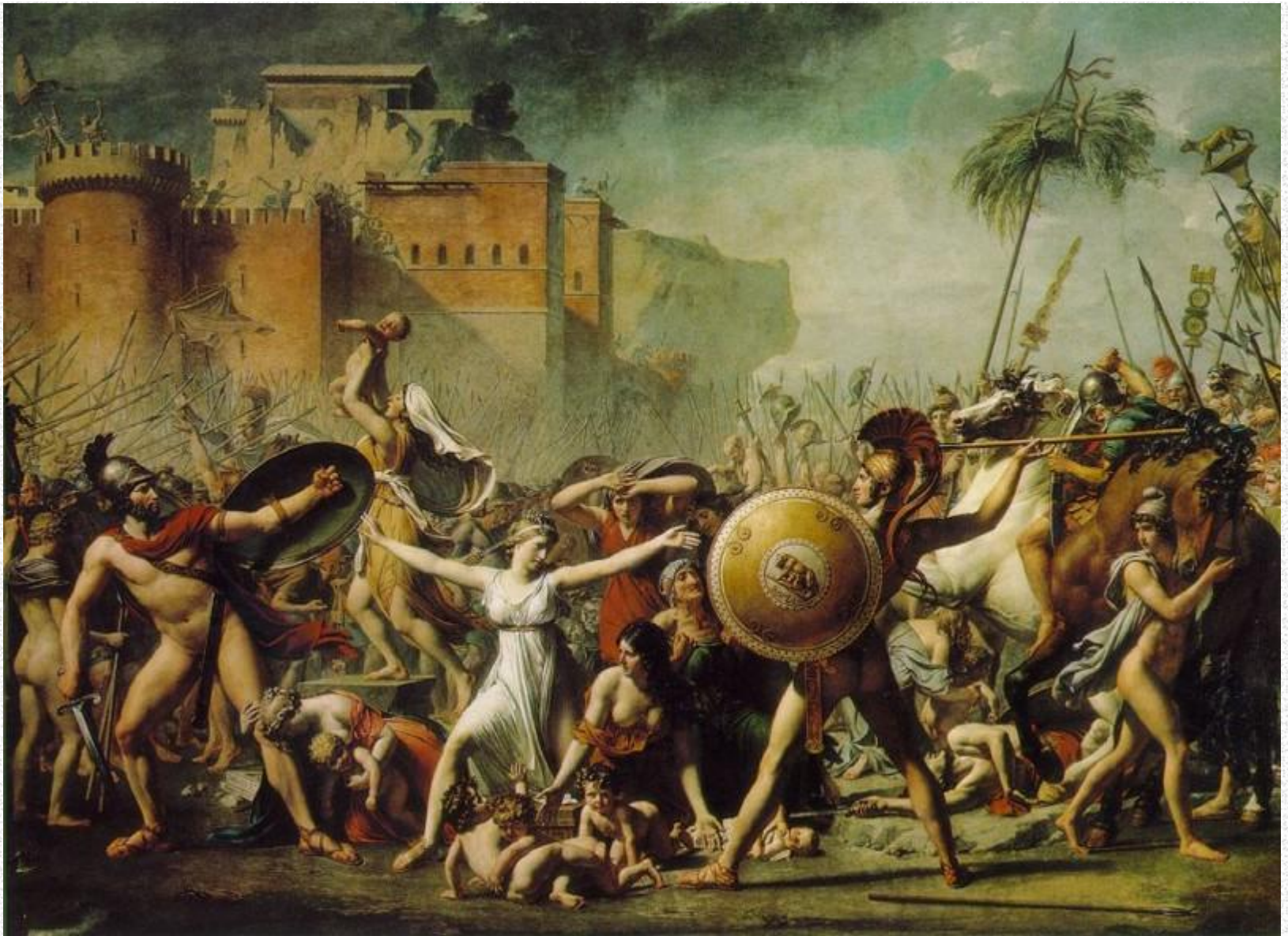
Сабинянки, останавливающие сражение между римлянами и сабинянами