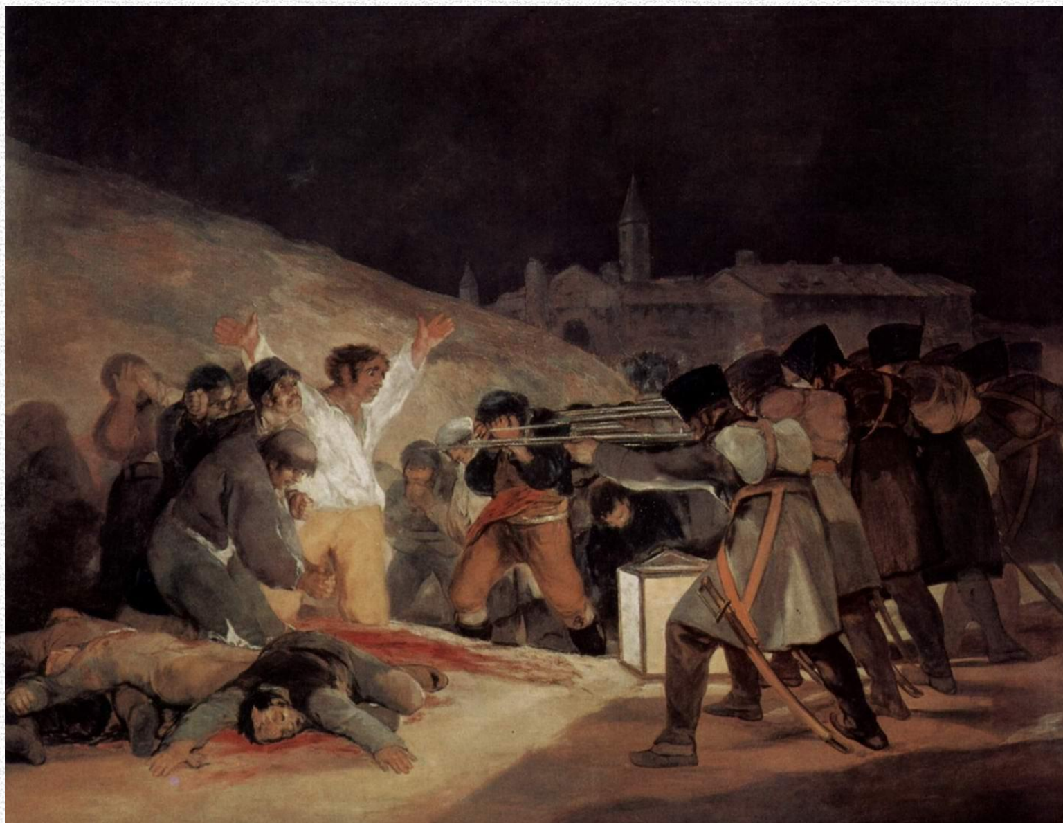
Расстрел повстанцев в ночь на 3 мая 1808 года Около 1814 Холст, масло. 268 x 347 см Музей Прадо, Мадрид