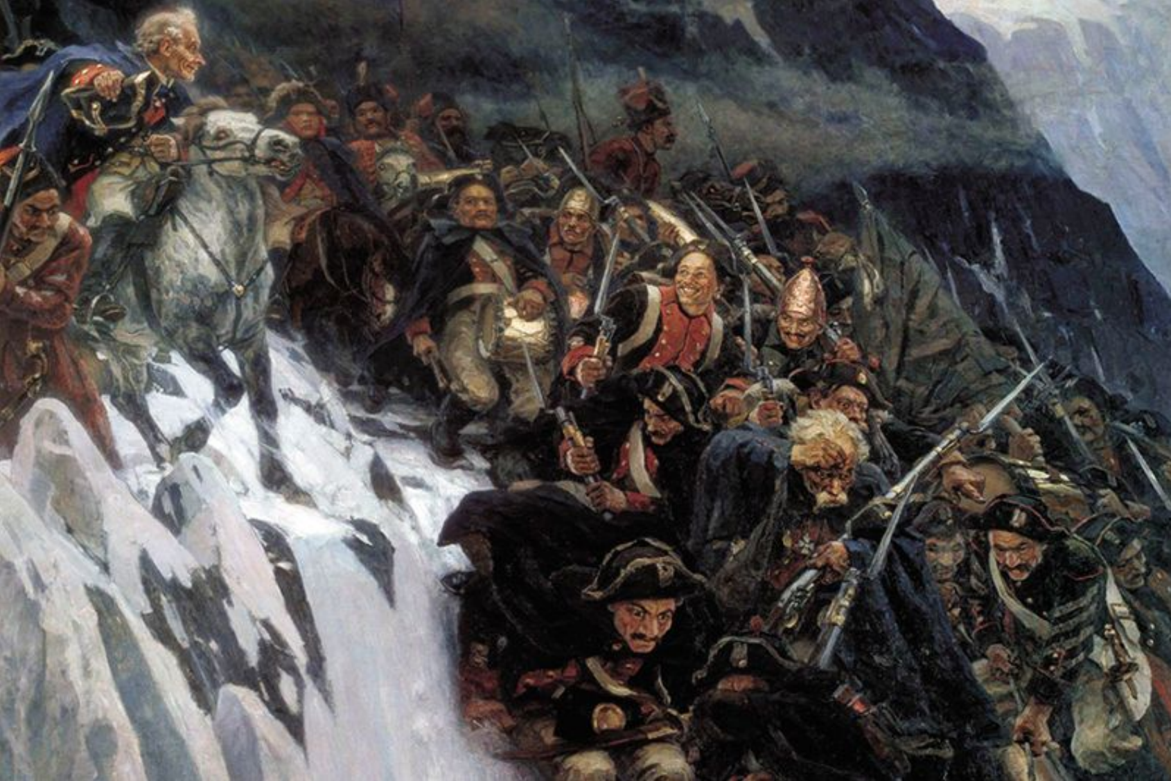
В.Суриков Переход Суворова через Альты