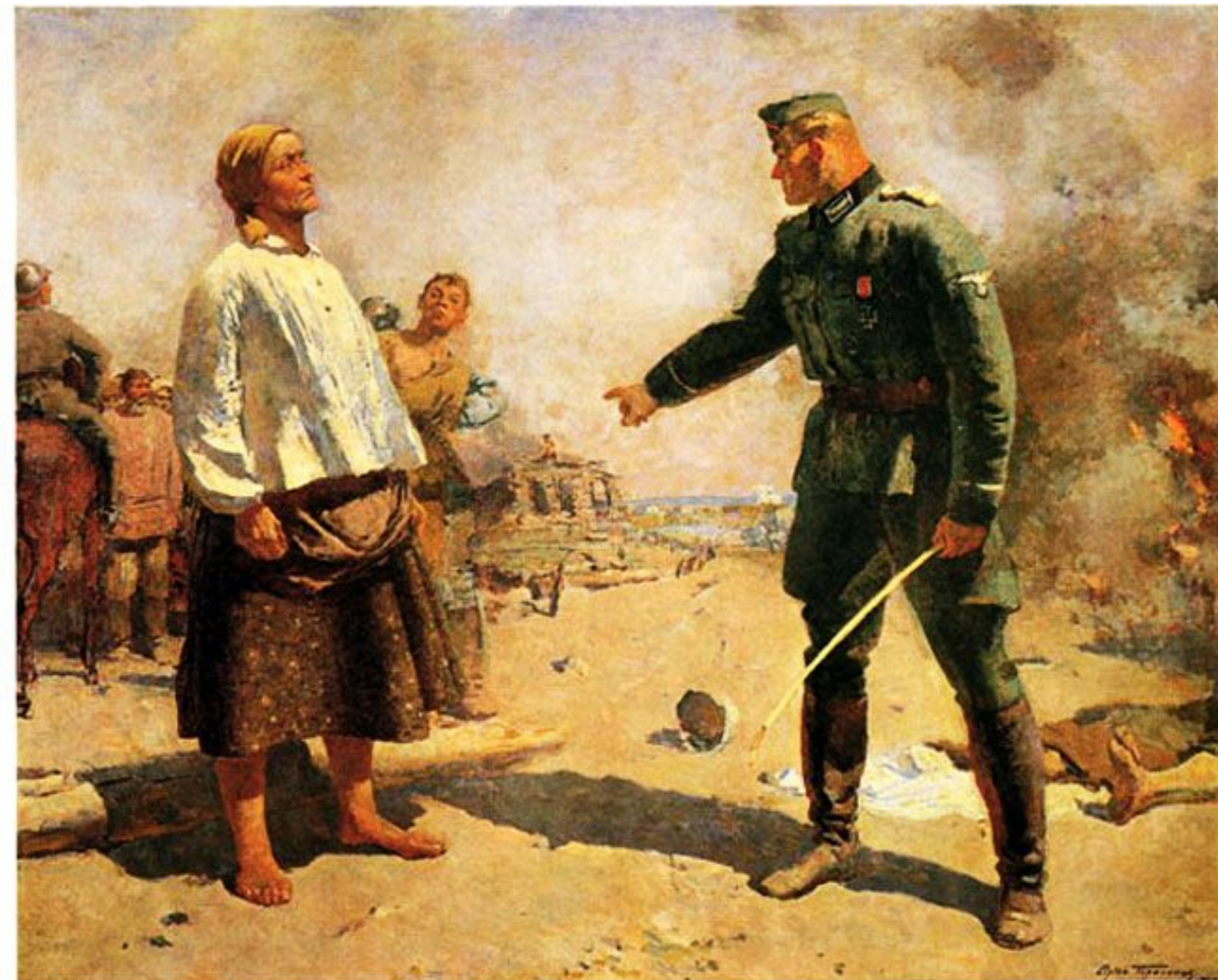
С.В.Герасимов «Мать партизана»