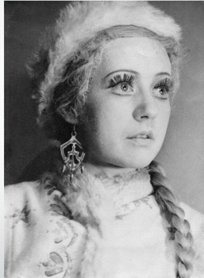
Купава, дочь богатого слобожанина - М. А. Макарова