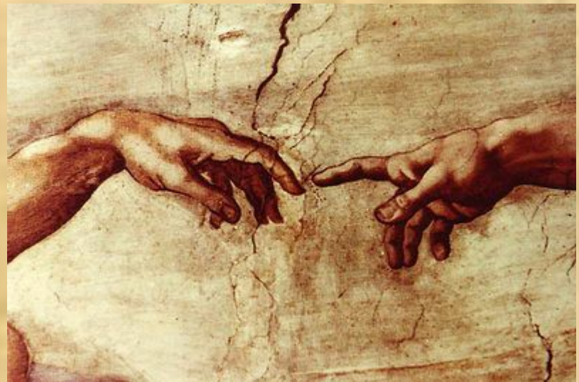
Сикстинская капелла. Ватикан. Фреска (1508 - 1512).