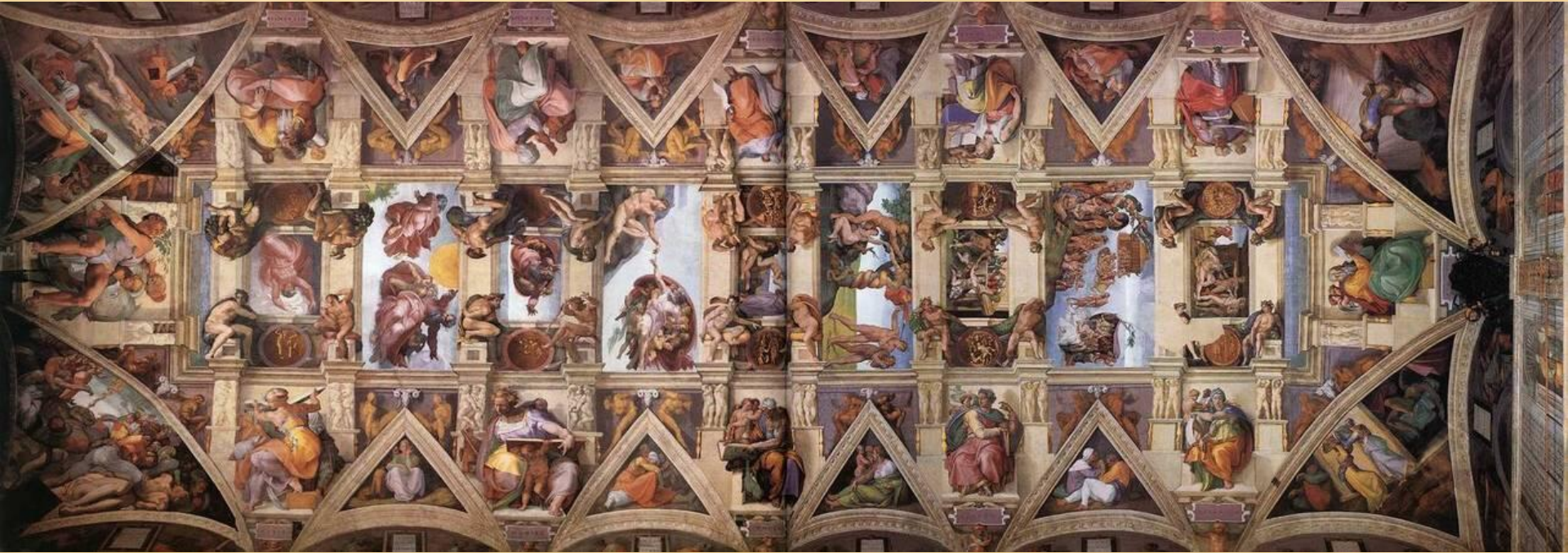
Сикстинская капелла. Ватикан. Фреска (1508 - 1512).