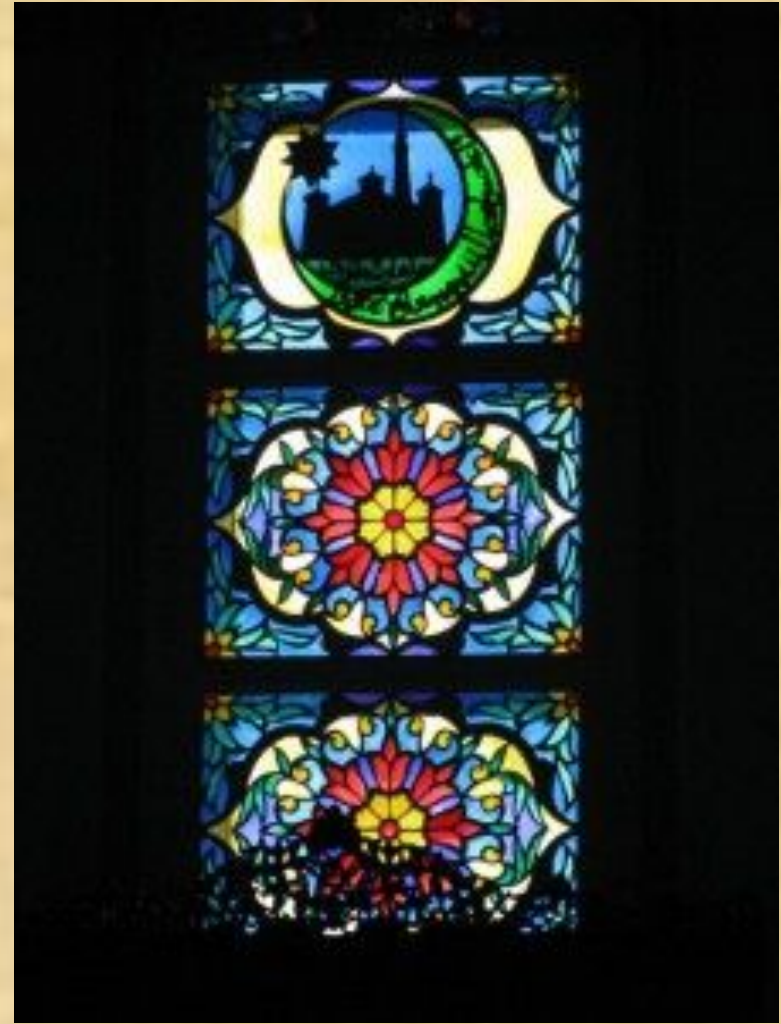
Витраж в мечети трёх сподвижников