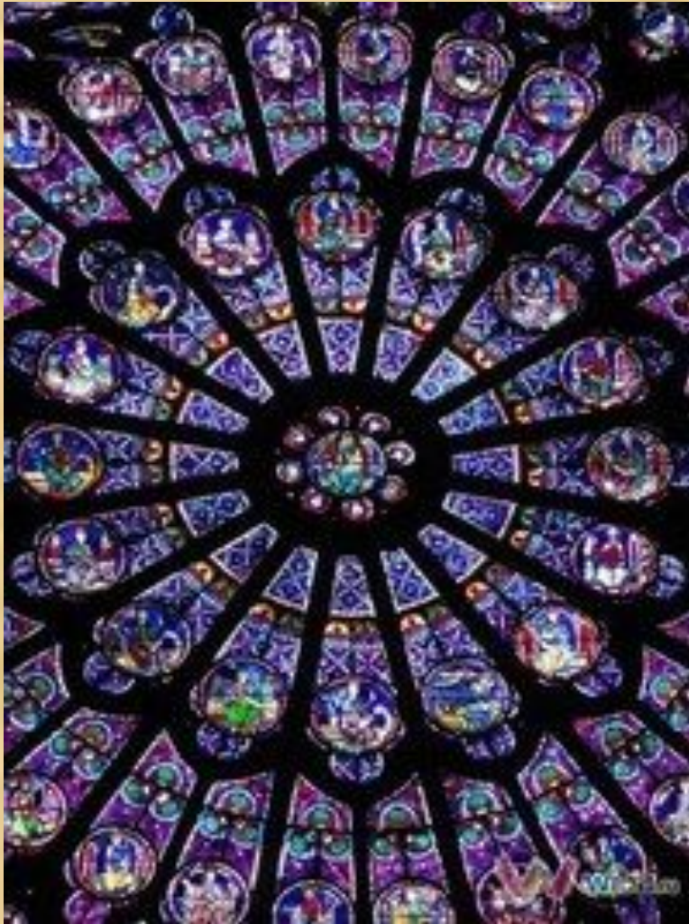
Собор парижской богородицы. Париж