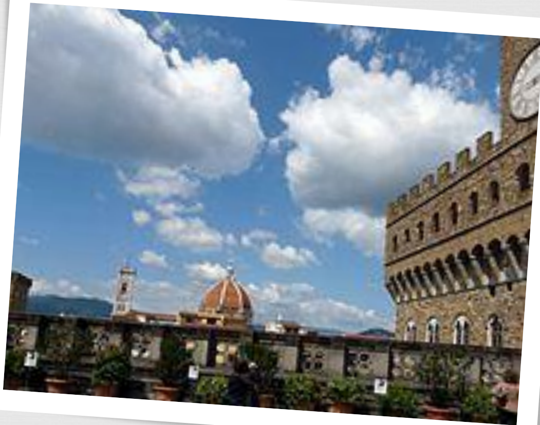
Вид с террасы Лоджии Ланци