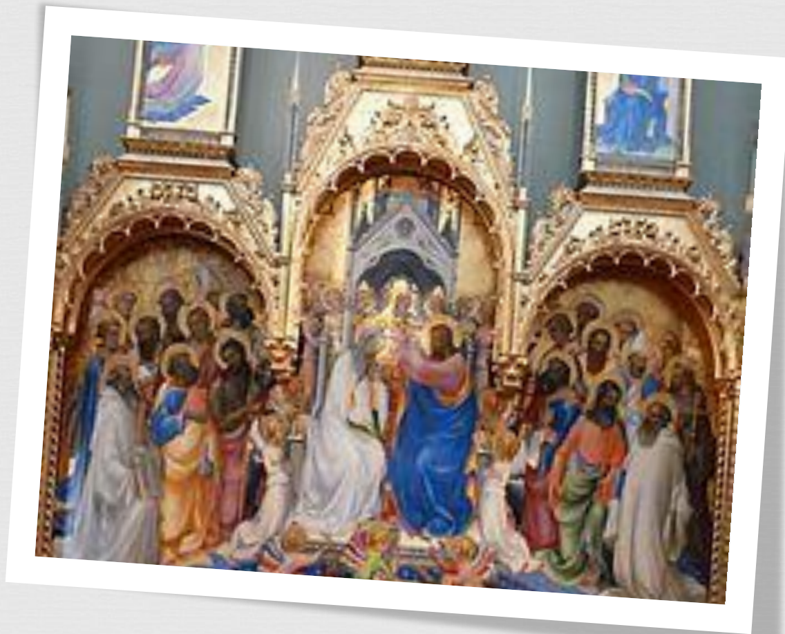
Лоренцо Монако. Коронование Марии.