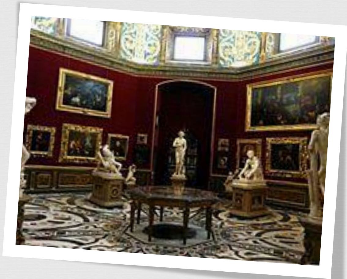
Венера Медичи (в Зале Трибуна)