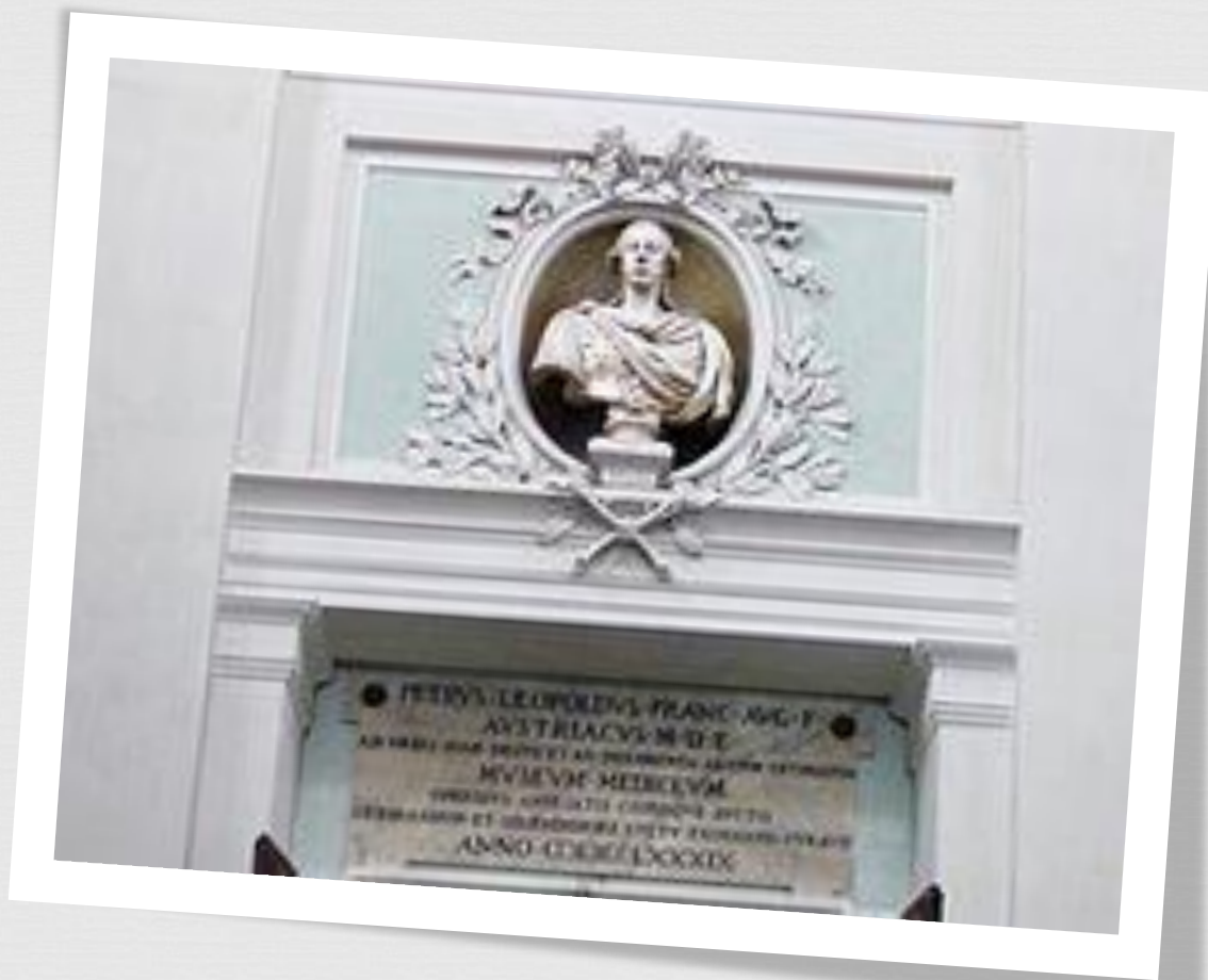
Бюст Франческа I