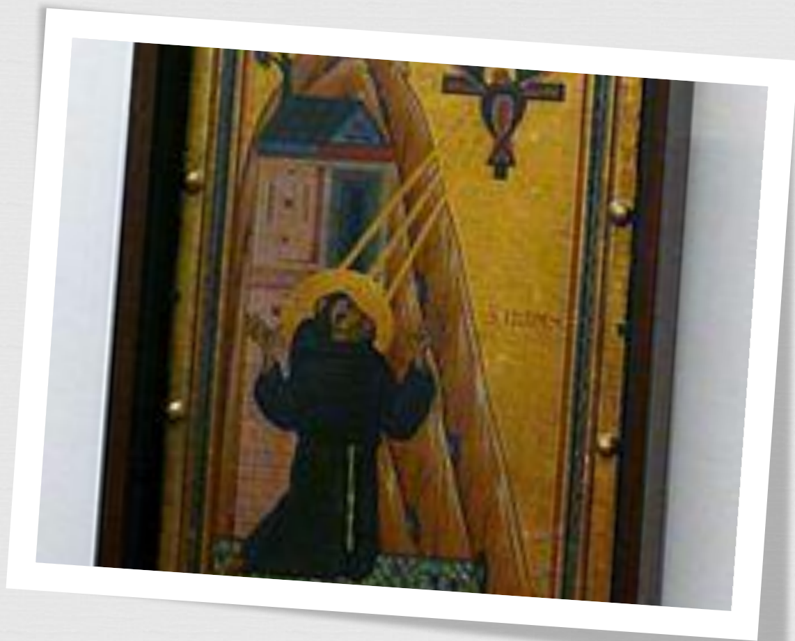
СТИГМАТЫ Св. Франциска. 1250.