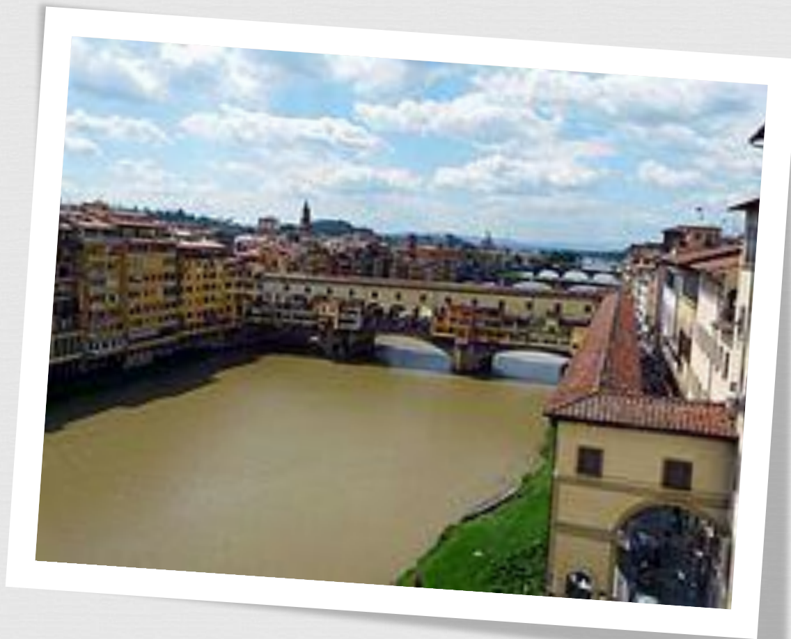
Мост Понте Веккьо и Коридор Вазари