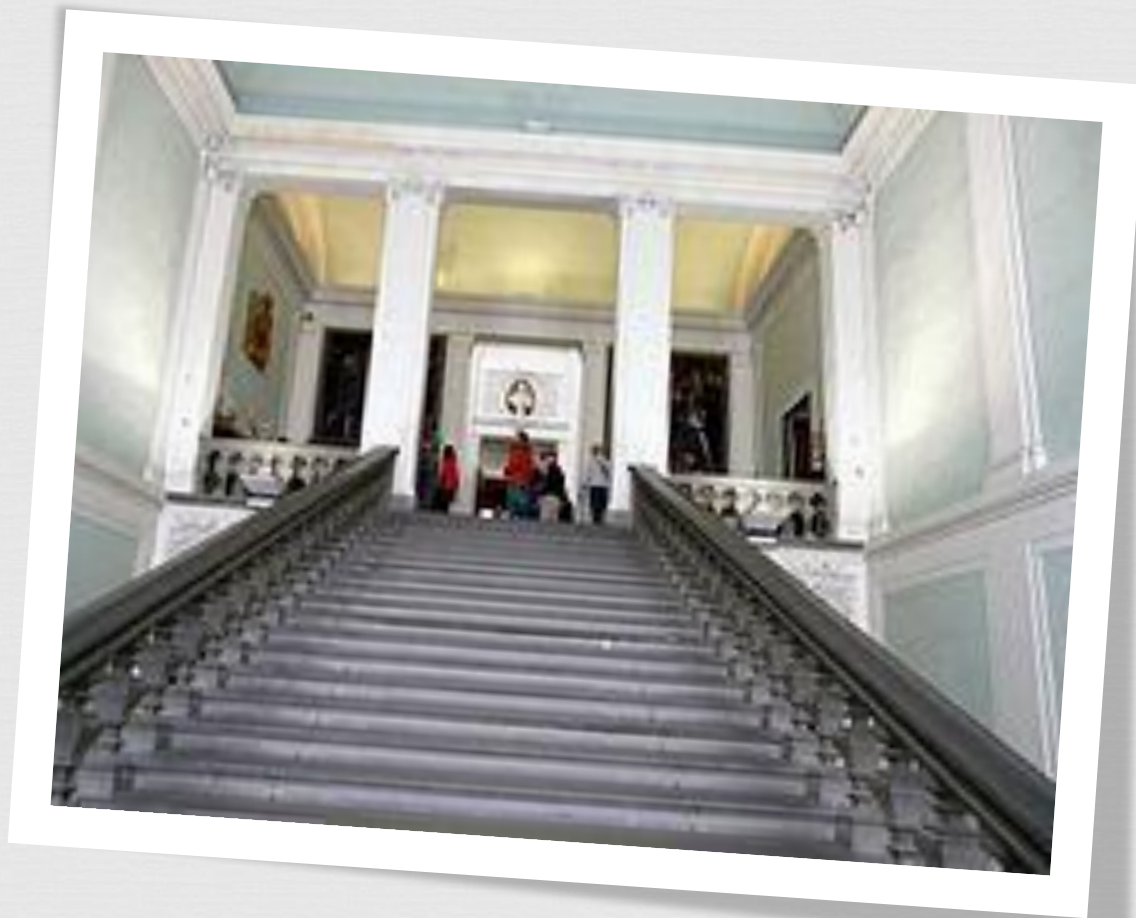
Центральная лестница Галереи