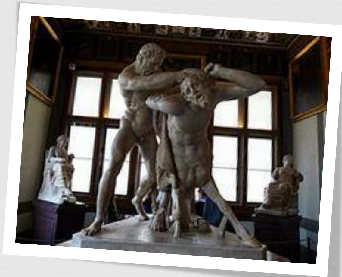
Геракл и кентавр