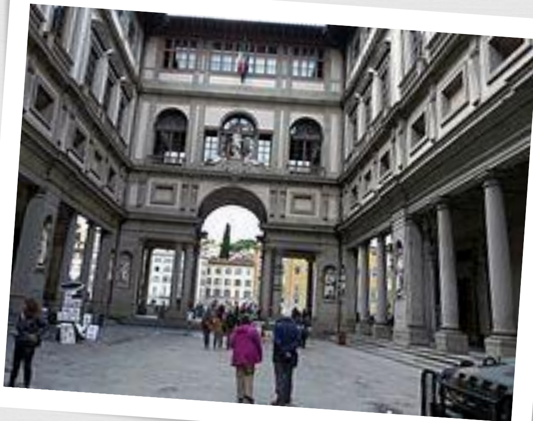
Двор с выходом на набережную