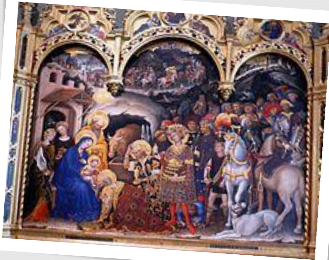
Джентиле да Фабриано. Поклонение ВОЛХВОВ.