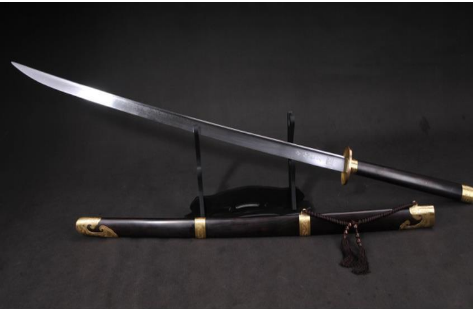
Меч Мяо Дао

Катана появилась в XV веке как следствие эволюции тати (яп. 太刀) и использовалась до конца XIX века (ранний период Муромати) как традиционное оружие самурая, прежде всего в комбинации (дайсё, яп. 大小, букв. «большой-малый») с коротким вакидзаси (яп. 脇差, яп. 小刀 сёто , букв. «малый меч»). Катана во многом похожа на более ранний китайский меч мяо дао