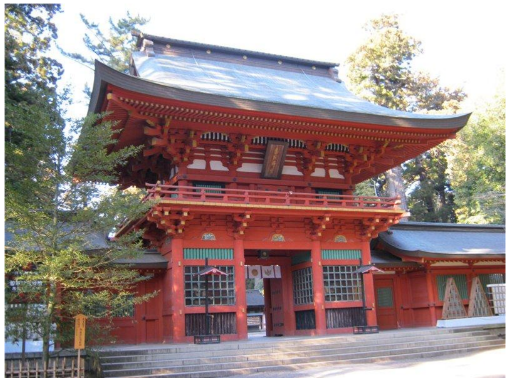
Школа Катори Синто Рю

В Японии до сих пор существуют многочисленные традиционные фехтовальные школы, которым удалось выжить после всеобщего запрета императора Мэйдзи на ношение мечей. Самыми известными являются Касима Синто Рю, Касима Син Рю и Катори Синто Рю.