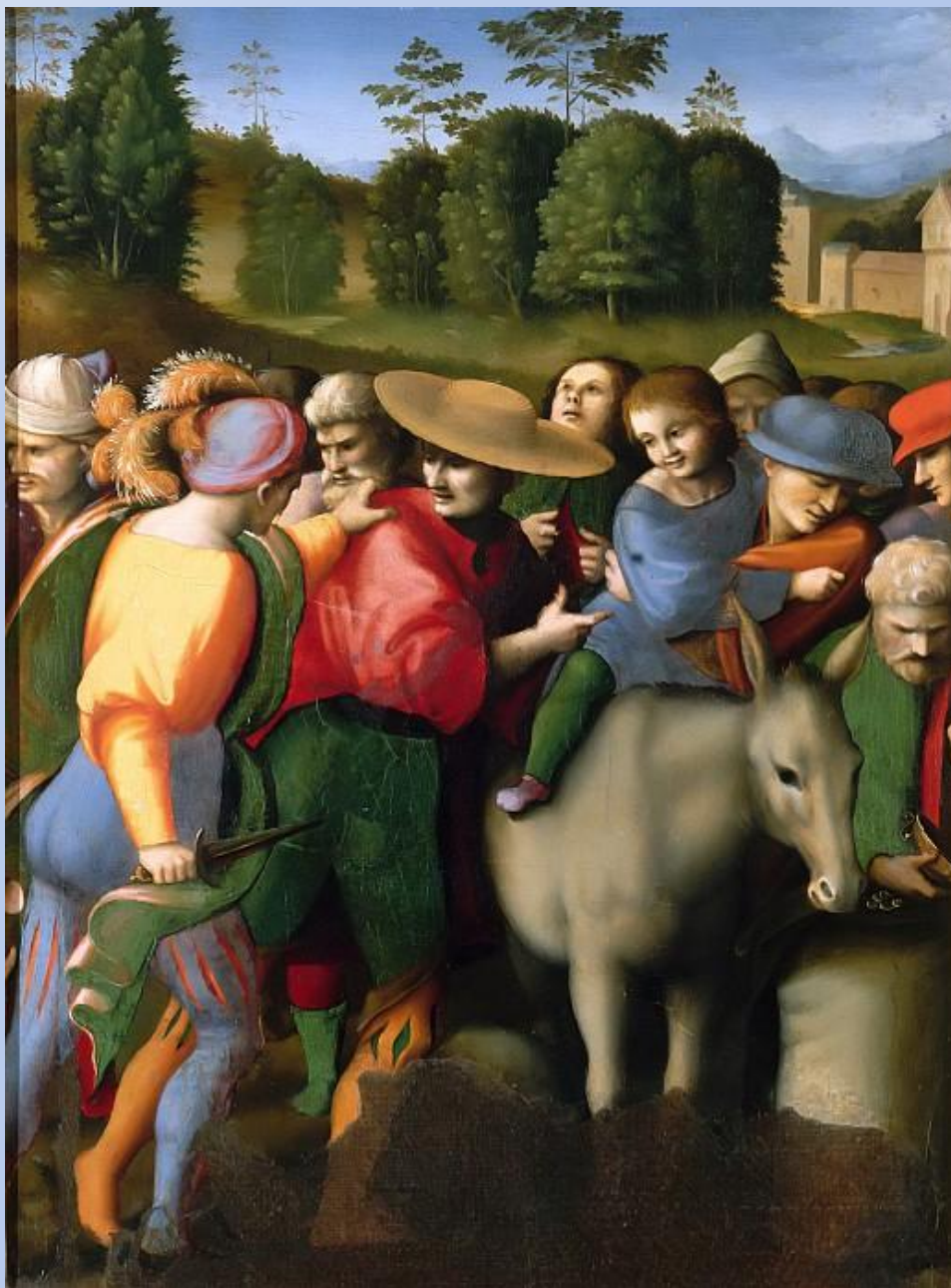
Баккьякка – История Иосифа - Нахождение чаши Иосифа 1515-1516. Галерея Боргезе, Рим (Galleria Borghese, Roma).