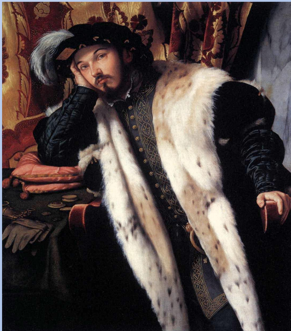
Моретто да Брешиа - Портрет молодого человека