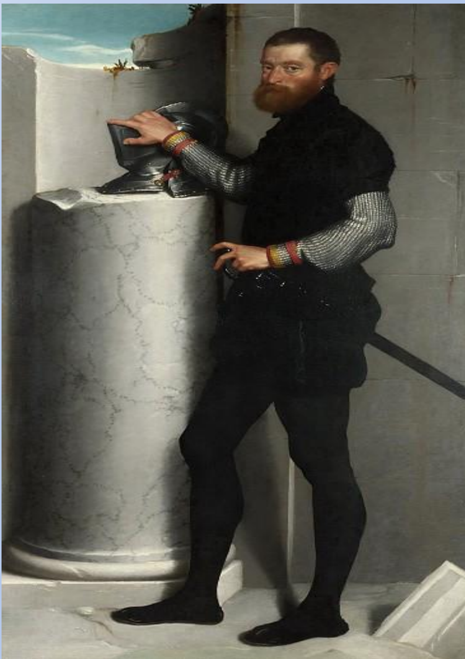
Портрет джентельмена с шлемом. Джованни Баттиста Морони