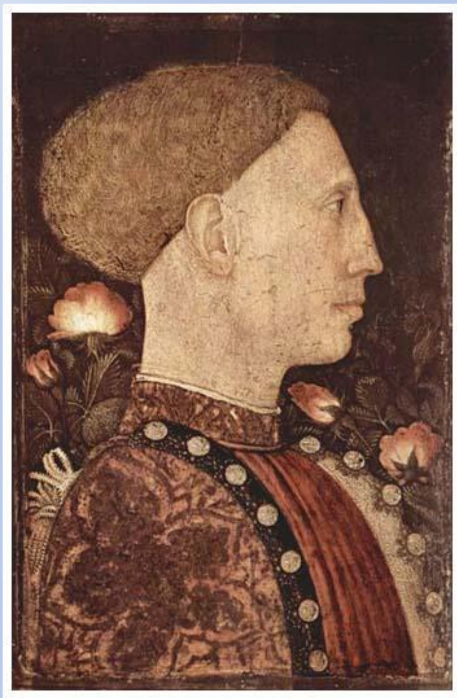
Пизанелло Портрет Лионелло д'Эсте. Бергамо. Галерея Академи Каррара. Италия.