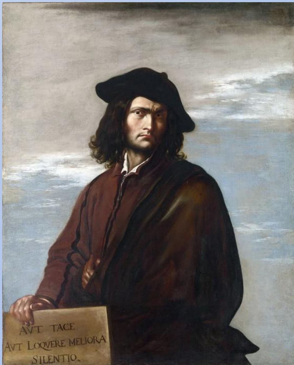
Сальватор Роза – Автопортрет .17 век