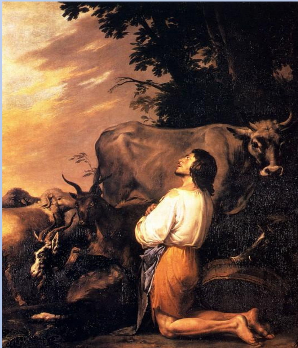
Сальватор Роза .Блудный сын.17 век