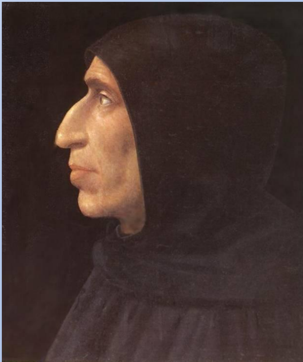
Бартоломео Фра. Портрет Савонаролы