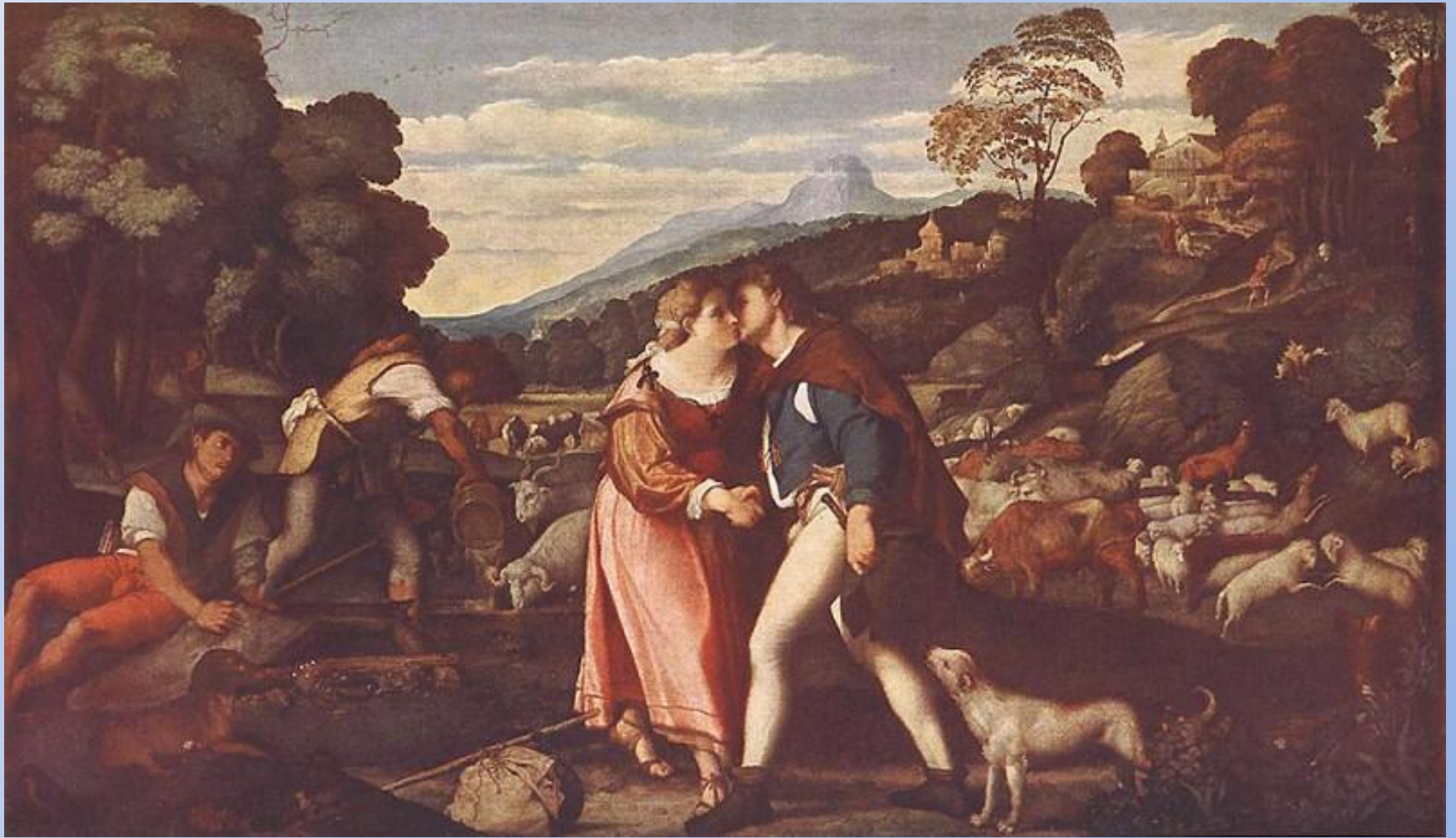
Пальма Старший – Иаков и Рахиль, ок.1520 .