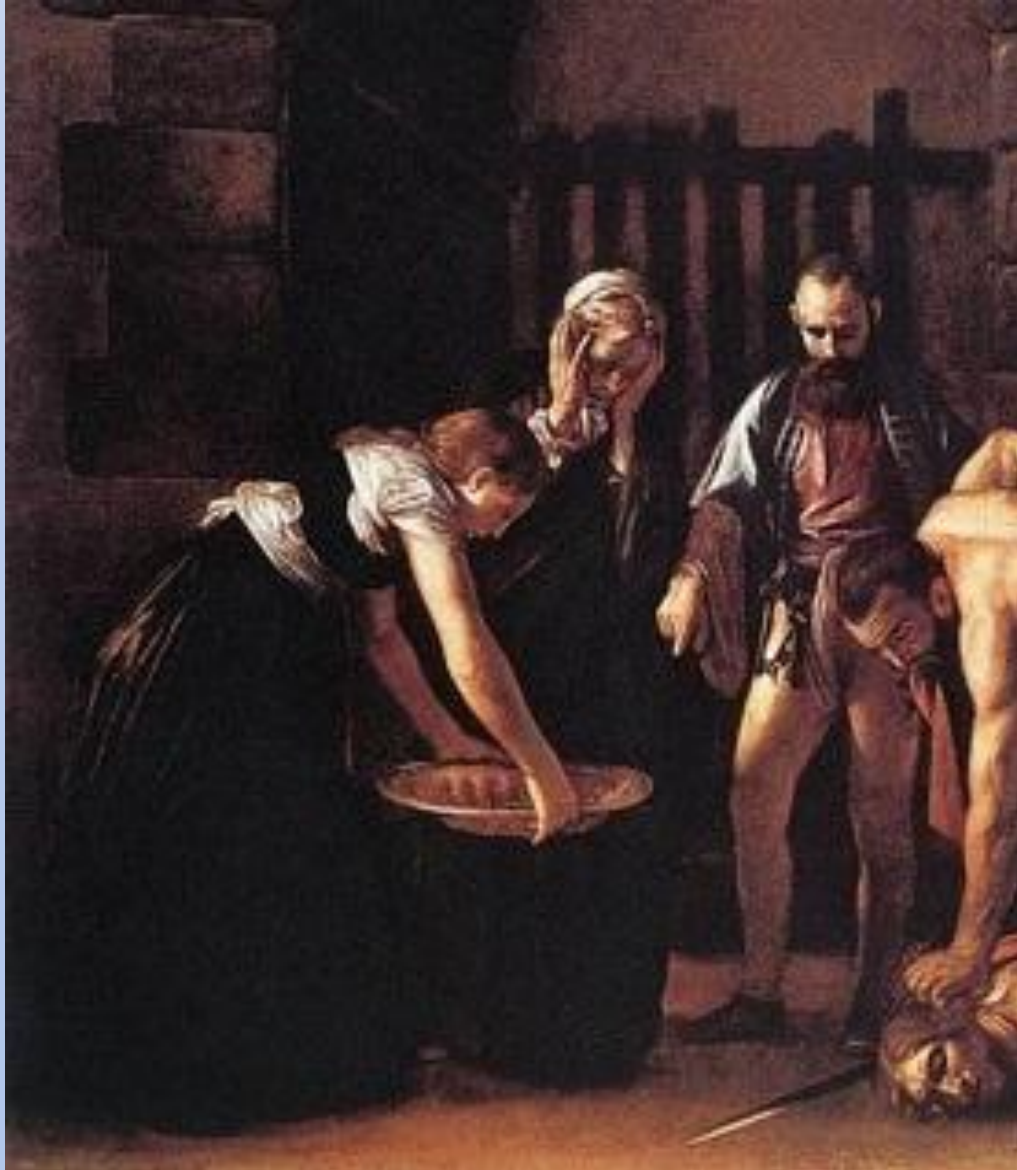
Усекновение головы Иоанна Предтечи. Караваджо. Фрагмент