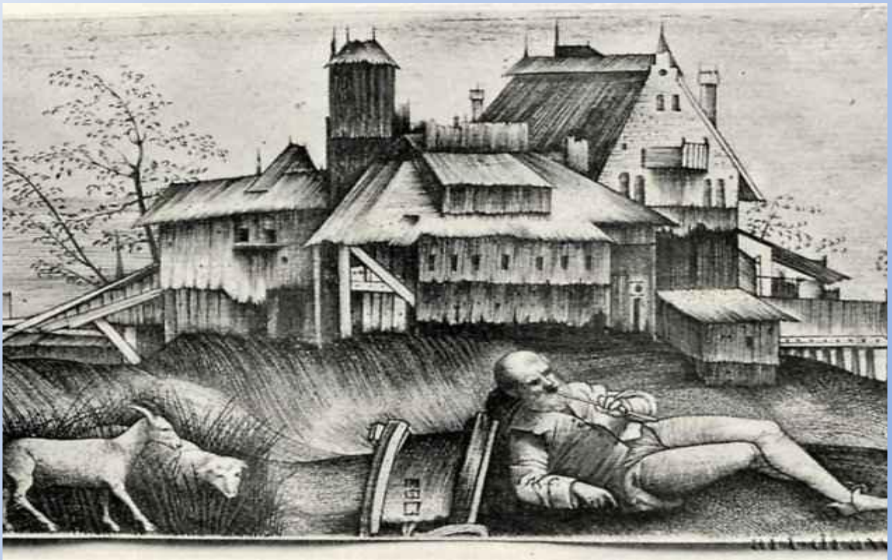
Старый пастух. 1500-1515 . Кампаньола, Джулио. Париж. Национальная библиотека, Кабинет эстампов.