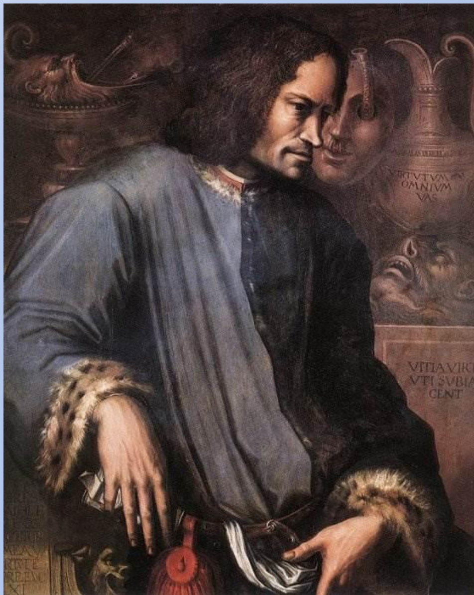
Портрет Лоренцо ди Пьеро де Медичи (Великолепного). Джорджо Вазари