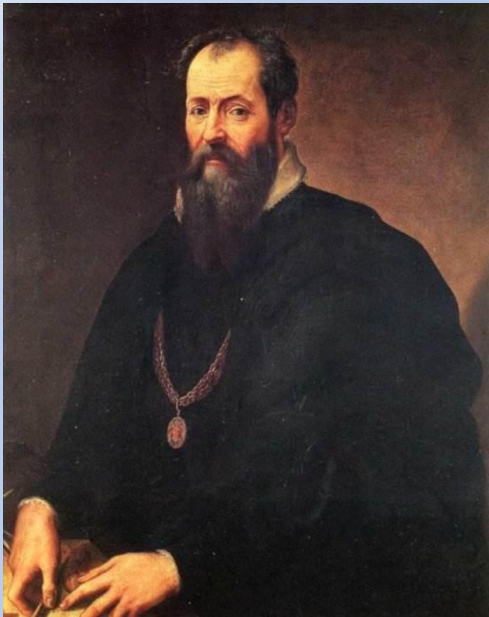
Джорджо Вазари автопортрет