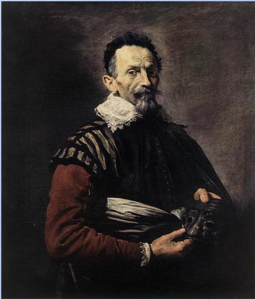
Портрет актера. Доменико Тетти. 17 век