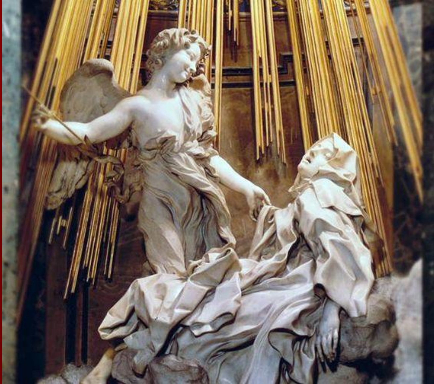
"Экстаз Святой Терезы" (1647-1652)