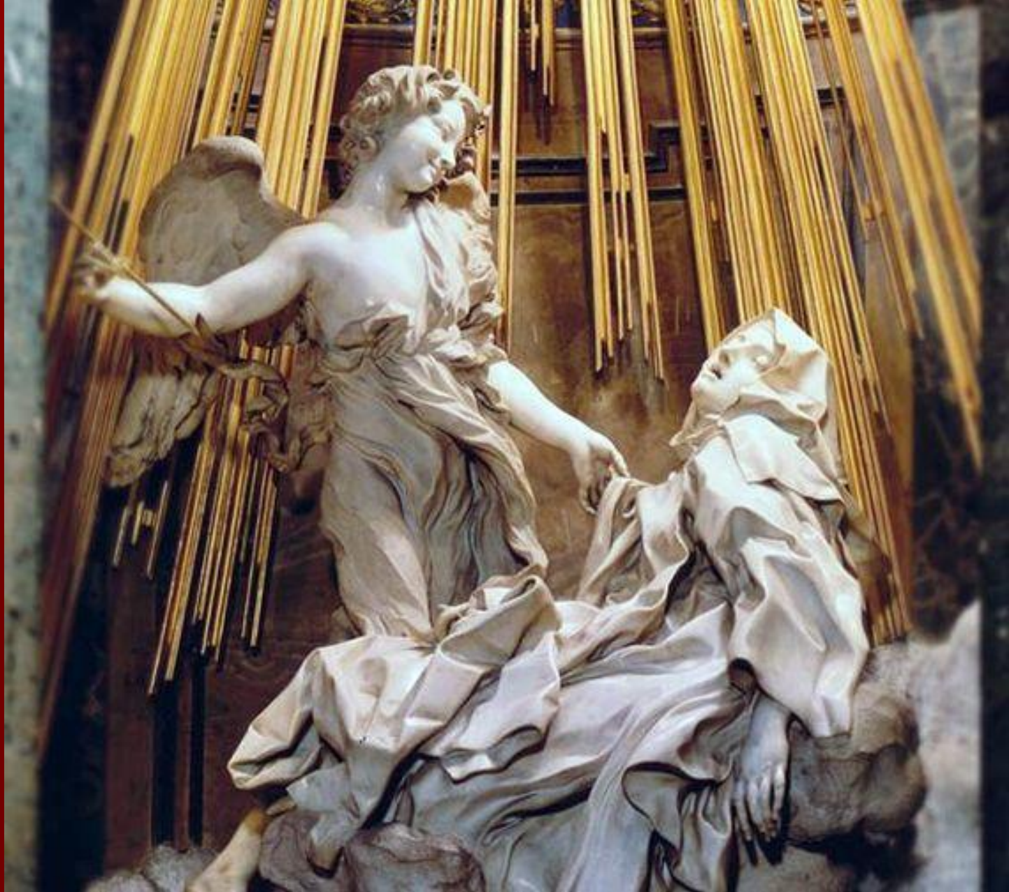
"Экстаз Святой Терезы" (1647-1652)