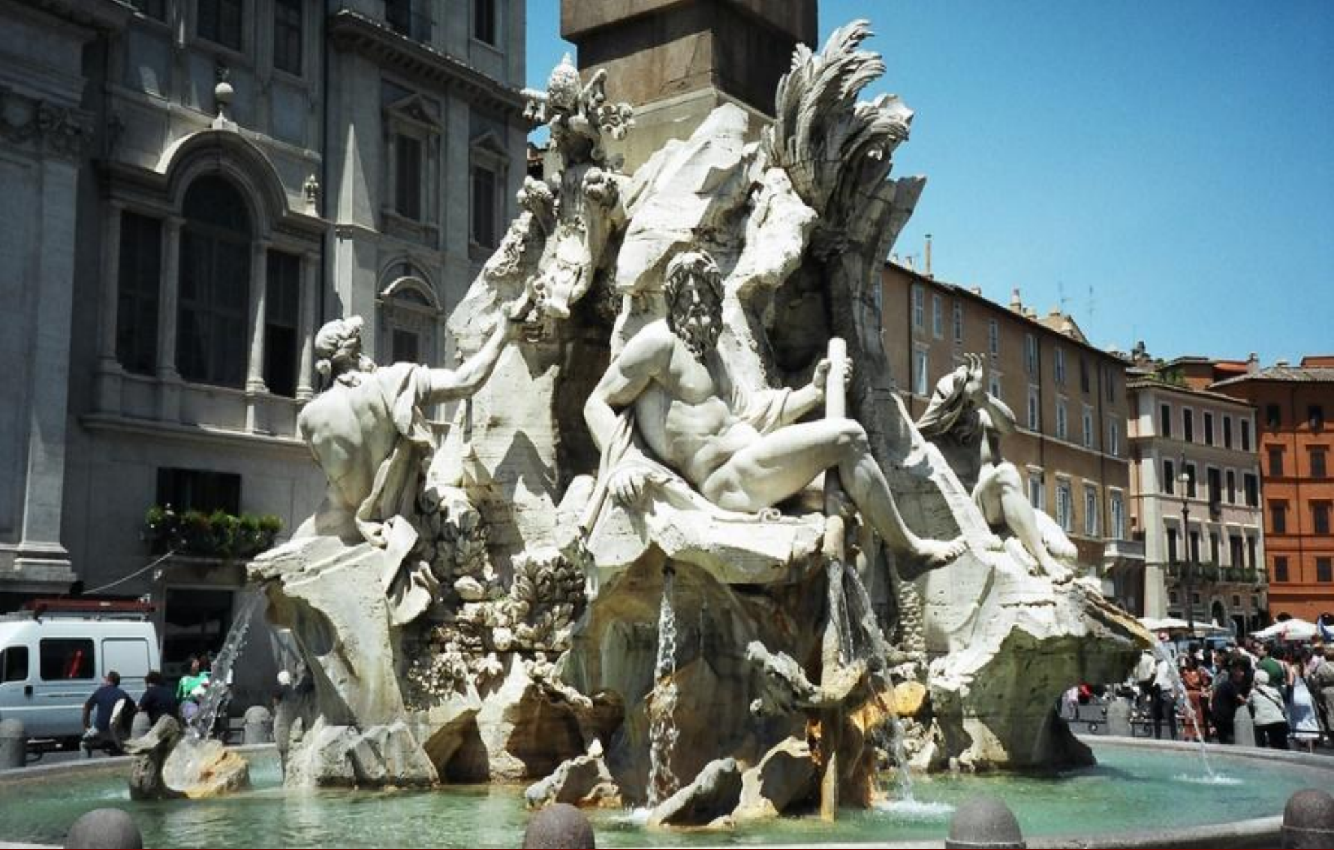
Фонтан Тритона (1624-1643)