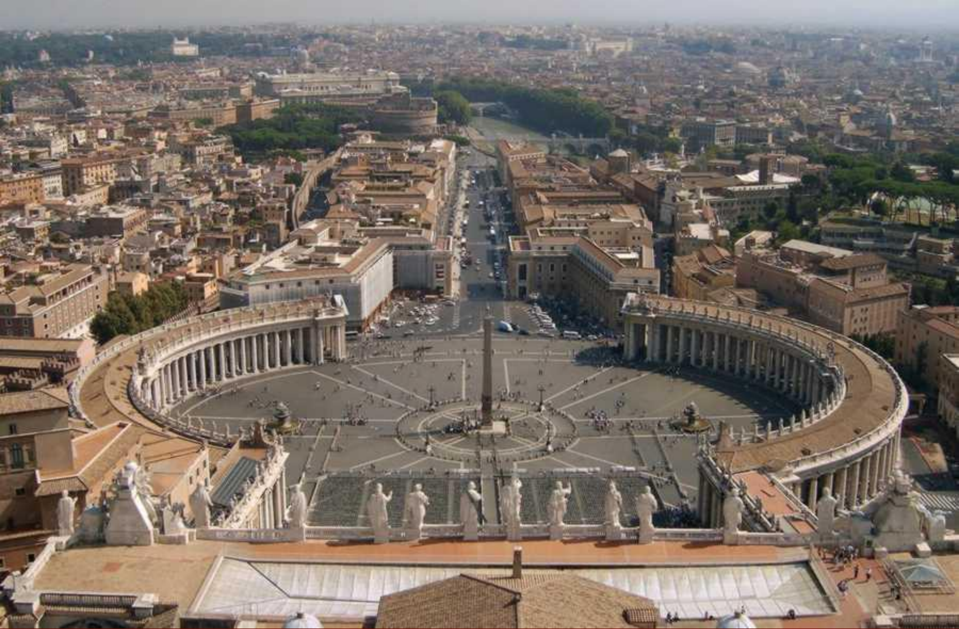
Площадь Святого Петра (1656-1667)