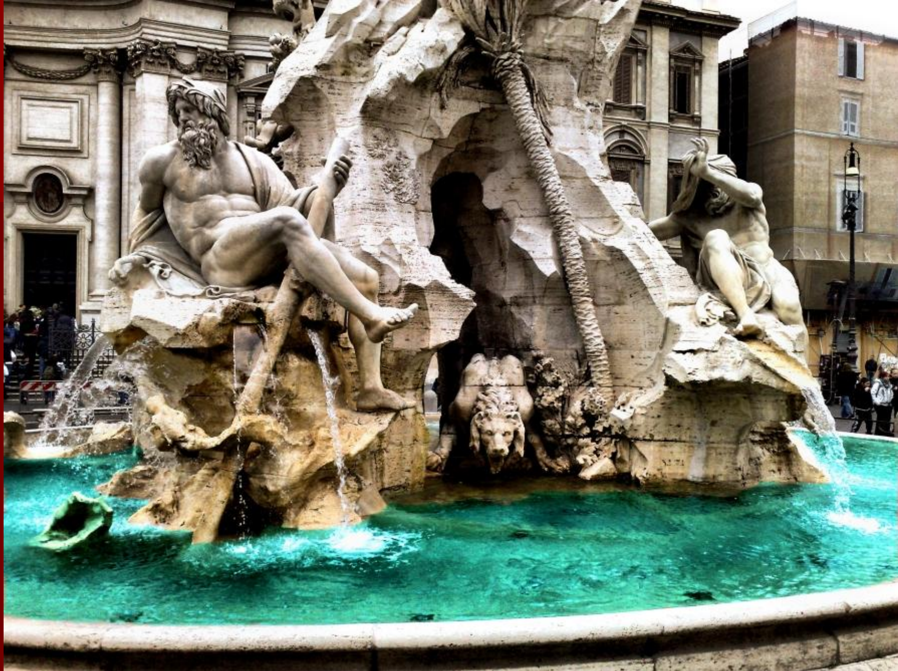
Фонтан Четырёх рек (1648—1651)