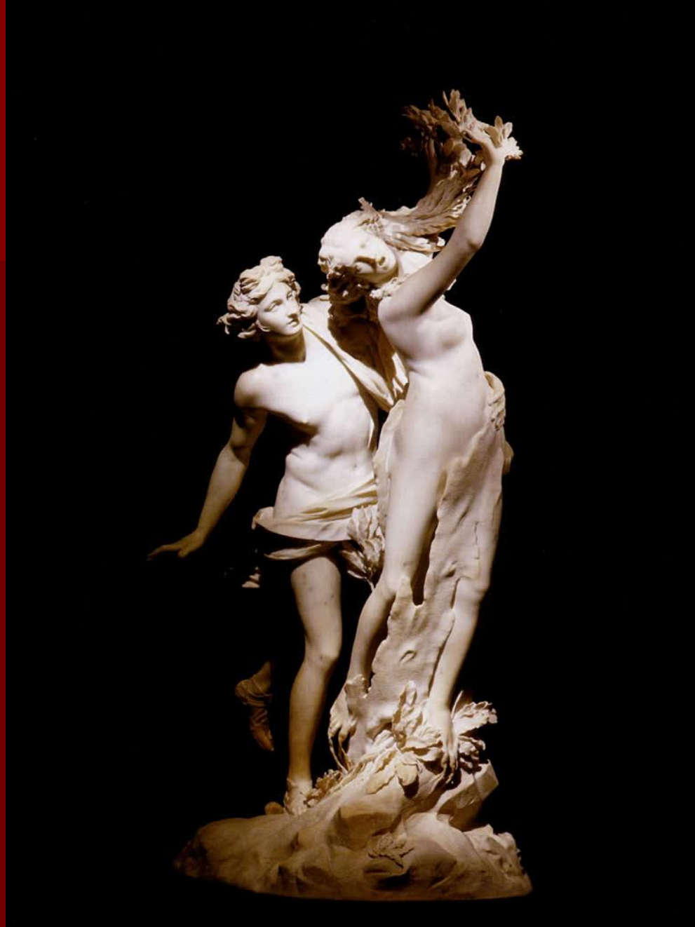
"Аполлон и Дафна" (1622-1625)