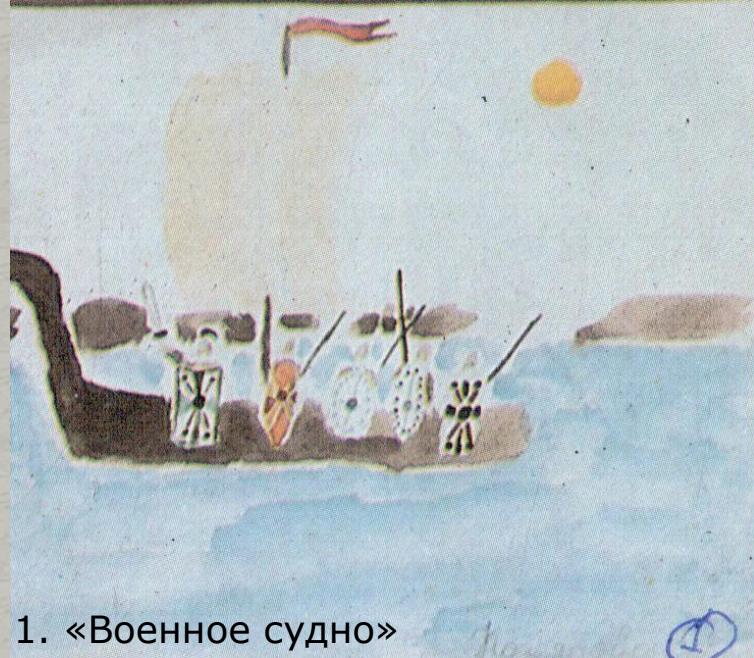
1. «Военное судно»