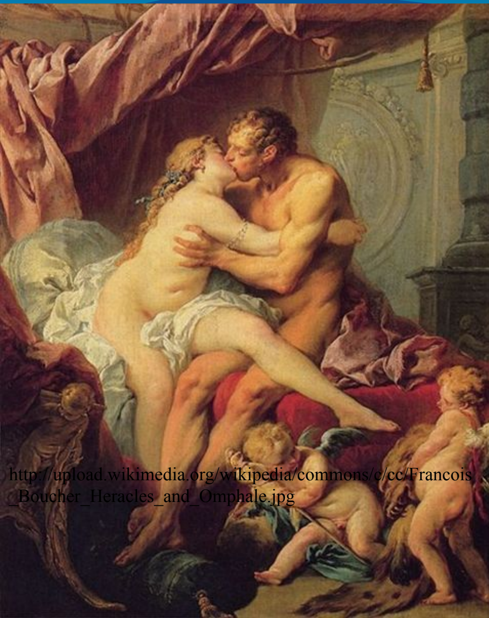
Геркулес и Омфала, 1731—40 гг.

http://upload.wikimedia.org/wikipedia/commons/c/cc/Francois_Boucher_Heracles_and_Omphale.jpg