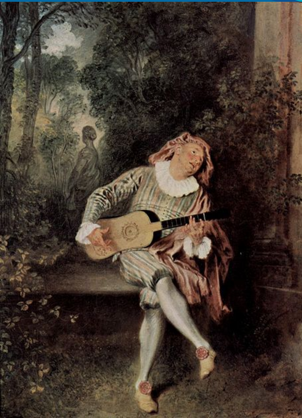
Меццетен. 1717—1719. Музей Метрополитен. Нью-Йорк