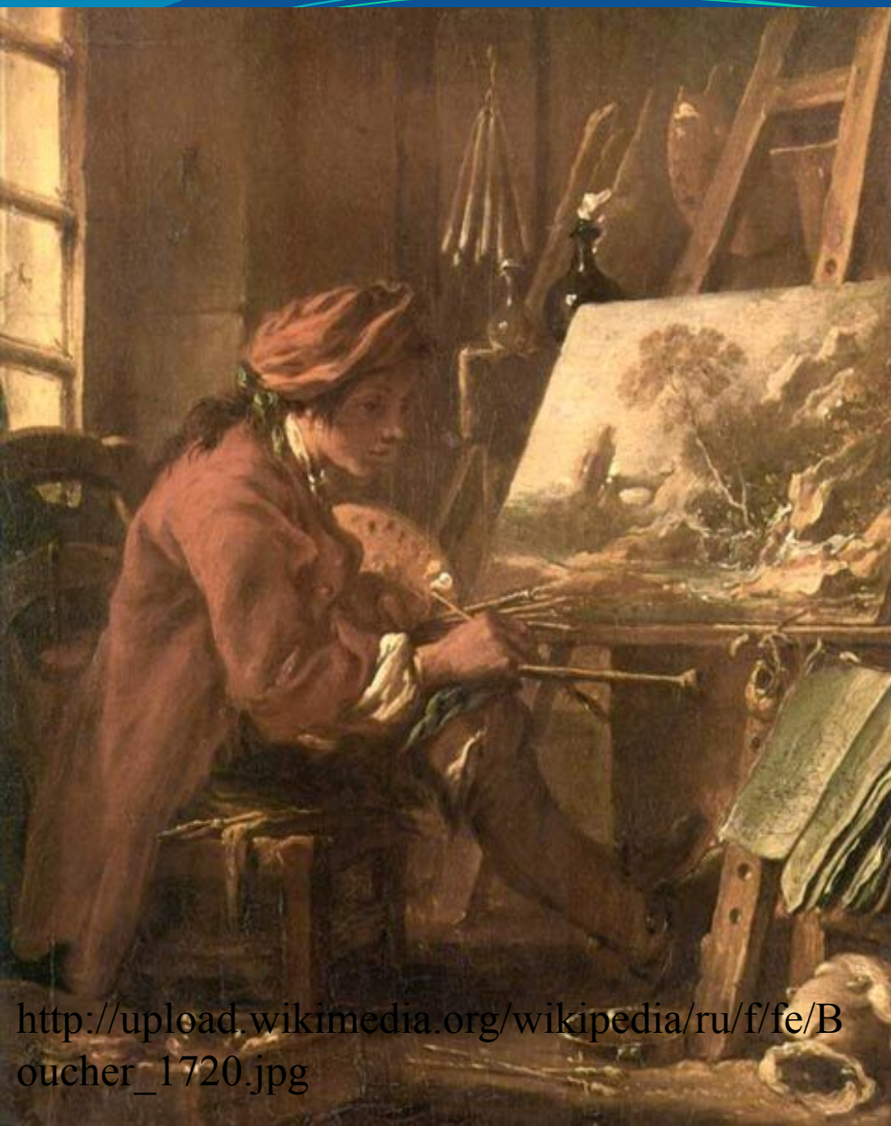
Художник в своей мастерской (автопортрет), 1720

http://upload.wikimedia.org/wikipedia/ru/f/fe/Boucher_1720.jpg