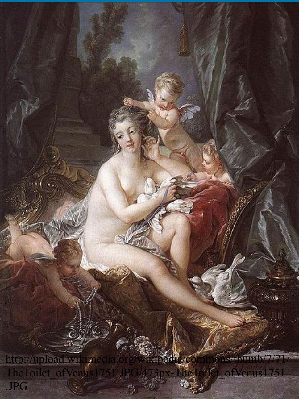
Туалет Венеры, 1751