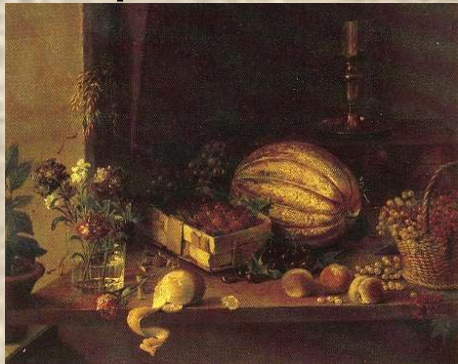
И. Т. Хруцкий «Цветы и плоды»