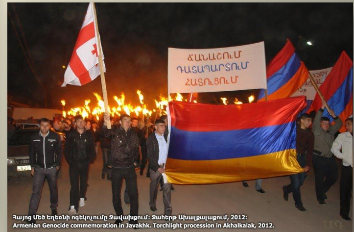
Հայոց Մեծ Եղեռնի ղեկավարը Ջավախքում: Ճահերի Ախալքալակում, 2012: Armenian Genocide commemoration in Javakhk. Torchlight procession in Akhalkalak, 2012.