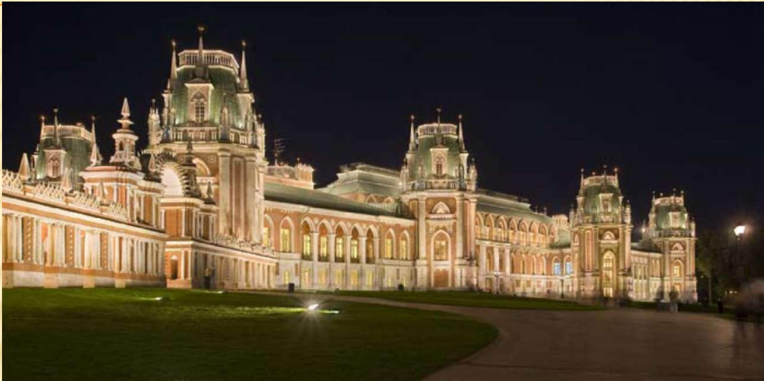
Дворцово-парковый ансамбль в Царицыно 1775 – 1785 гг. г. Москва