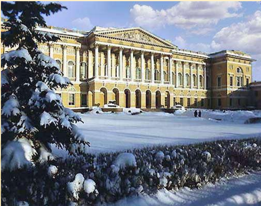
Михайловский дворец г. Санкт-Петербург Архитектор Карл Росси