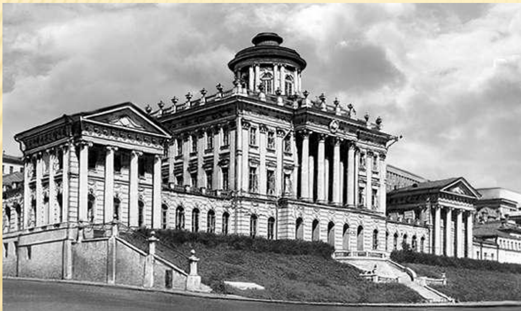
Пашков дом. 1784 – 1788 гг. г. Москва