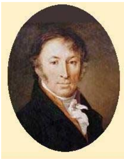
Карамзин Николай Михайлович (1766—1826)