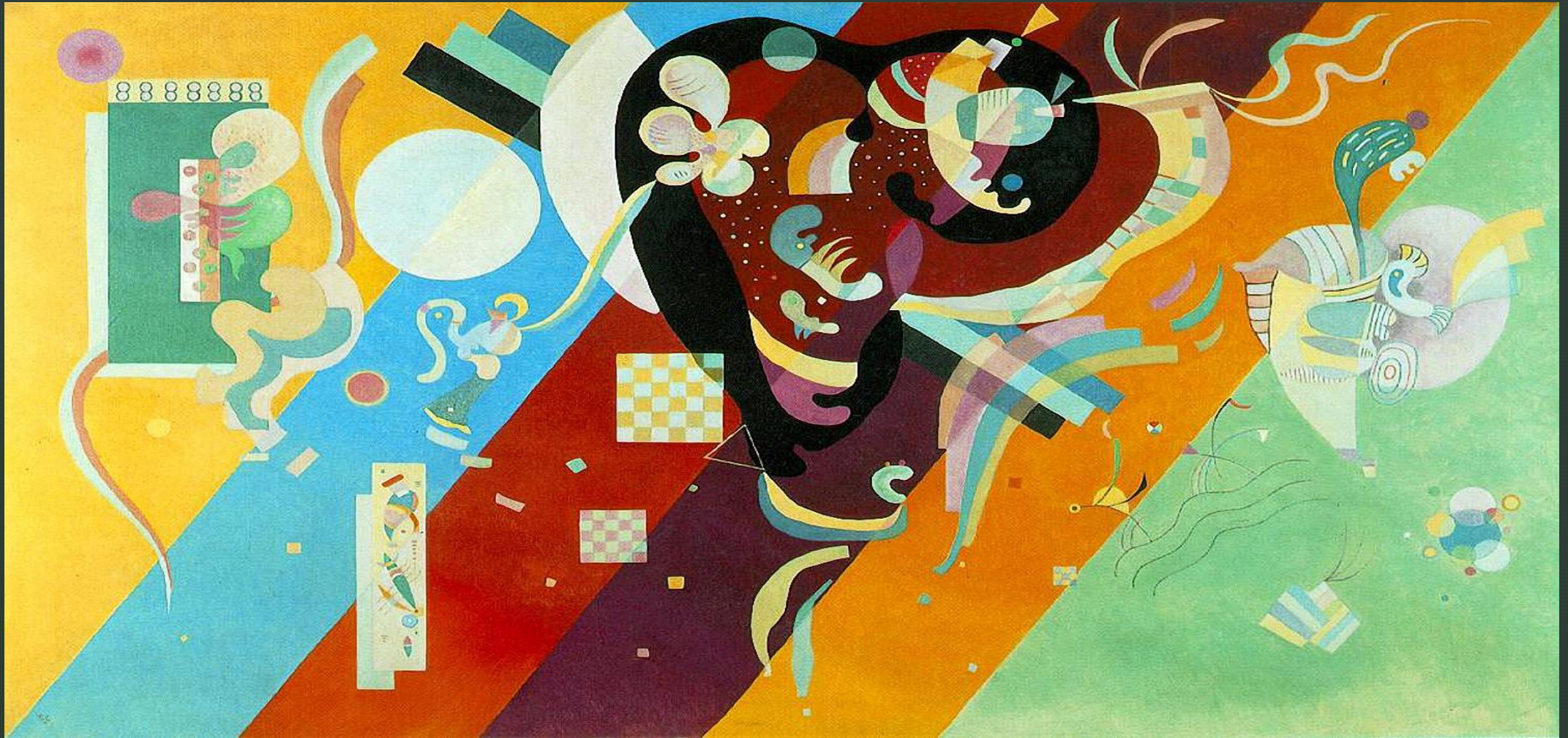
Кандинский Василий " Композиция IX "