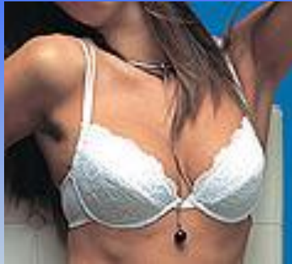
Рис.6. Типова бюстгальтеру „коробей”