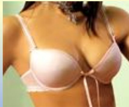
Рис 8. Типова модель бюстгальтеру „пуш-ап”