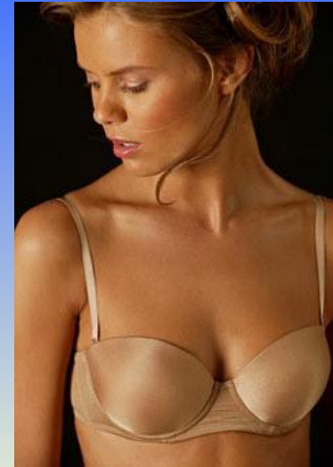
Рис.5. Типова модель бюстгальтеру „балонет”