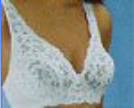
Рис. 4. Типова модель класичного бюстгальтеру