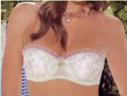
Рис. 7. Типова модель бюстгальтеру „бра сьєр”