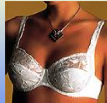
Рис.9. Типова модель бюстгальтеру-кошик