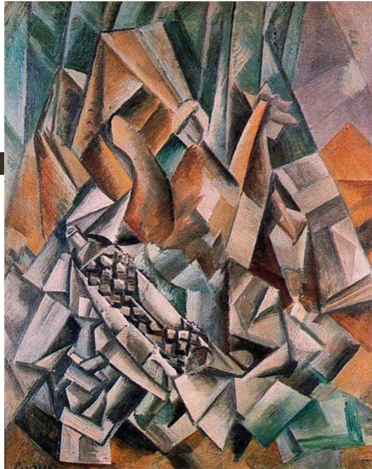
Пабло Пикассо. Бутылки ликера. 1909