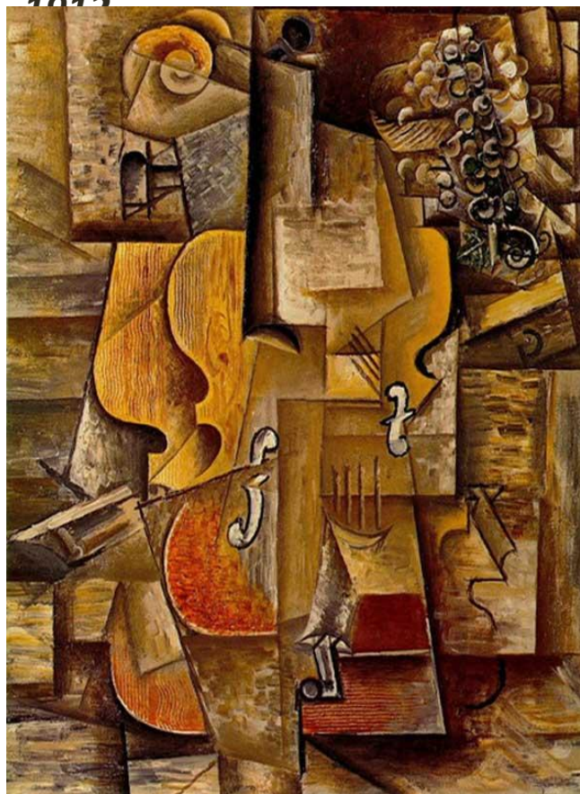
Пабло Пикассо. Скрипка и виноград. 1912