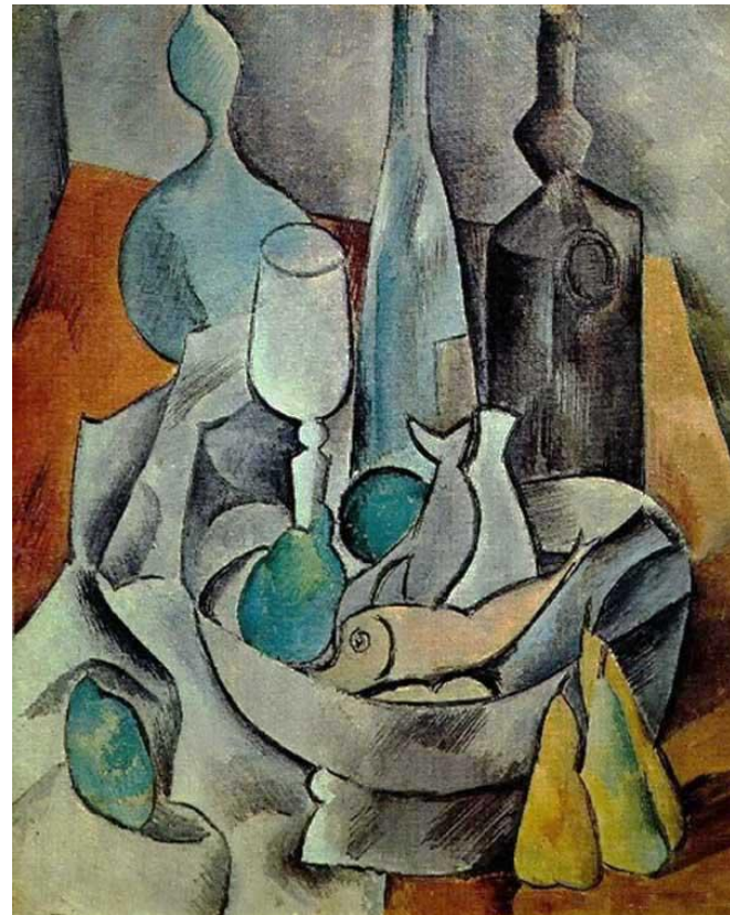
Рыба и бутылки. 1908