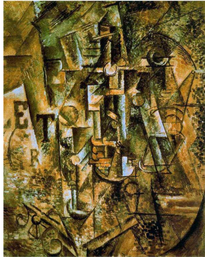
Пабло Пикассо. Бутылка рома. 1911