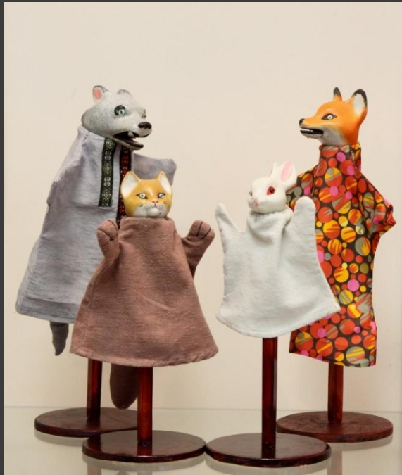
5. Перчаточная кукла