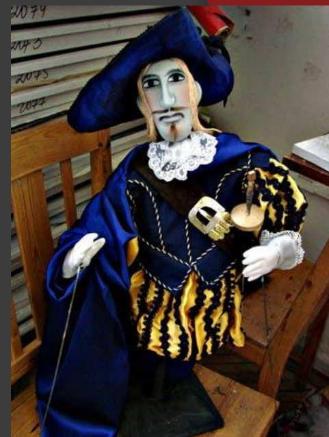
3. Тростевая кукла