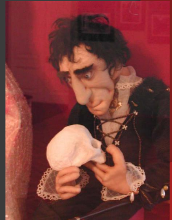
7. Мимирующая кукла