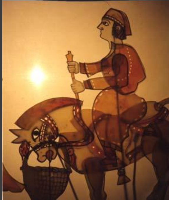
6. Куклы театра теней