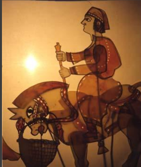
6. Куклы театра теней