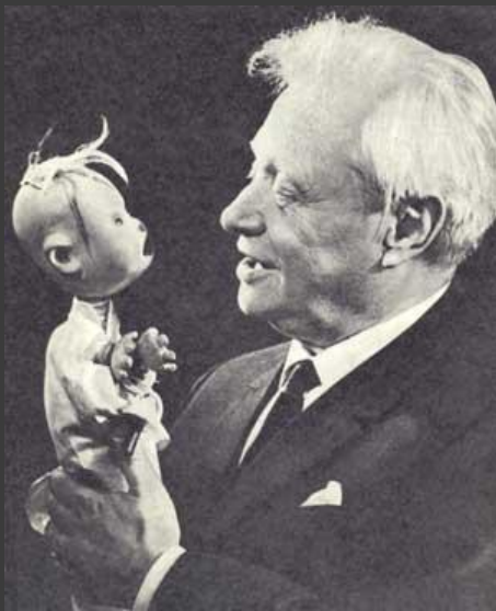
С. В. Образцов с куклой Тяпой.