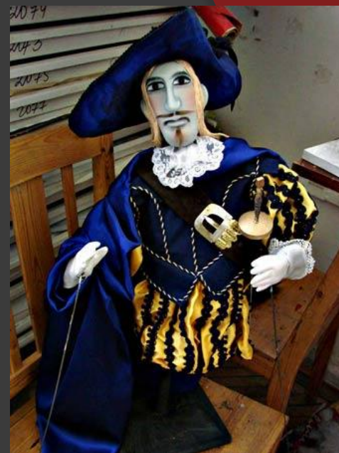
3. Тростевая кукла