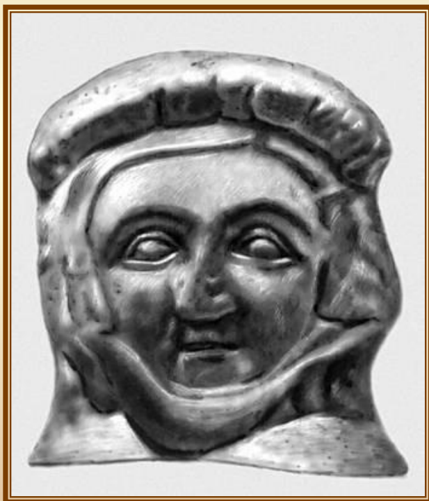
Кей Кобад шах. Головка терракотовой статуэтки Около 1 в. до н. э. 1 в. н. э.