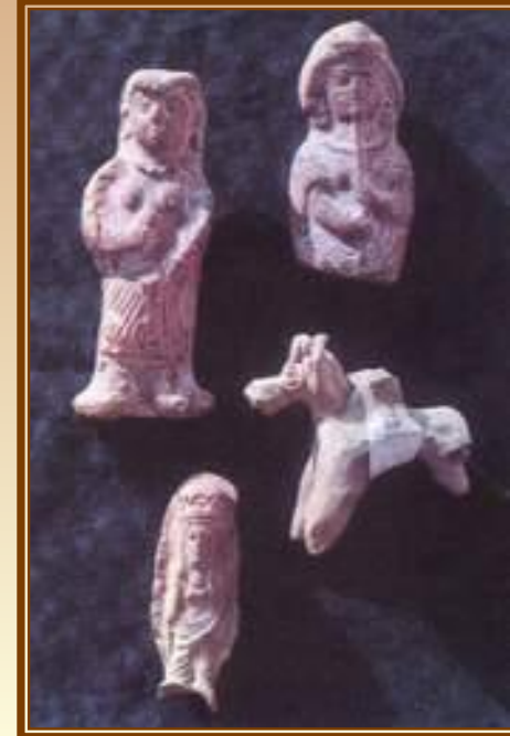
Терракотовые статуэтки I-VI вв н. э. Самарканд и его окрестности

Распространение в Индии буддизма «великой колесницы» способствовало появлению обширного пантеона святых бодхисатв. Массовые находки терракотовых статуэток говорят о широком спросе на произведения искусства, связанного с буддизмом.