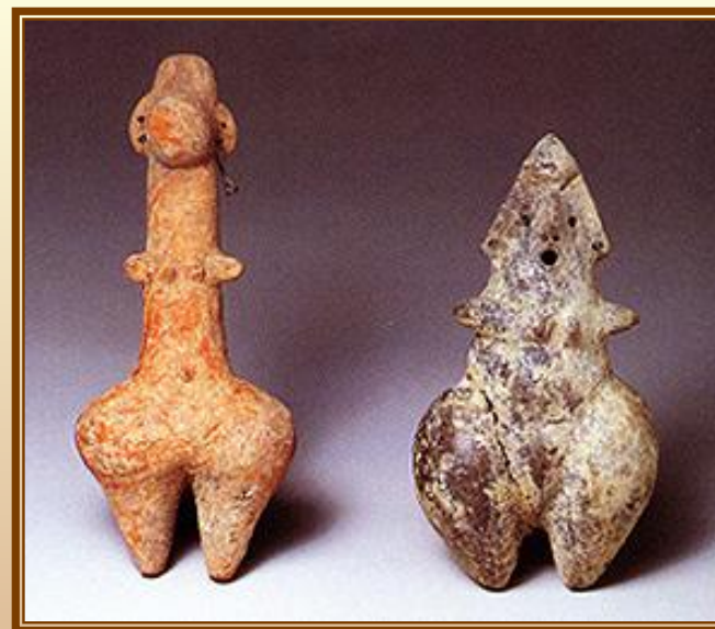
Терракотовые статуэтки Богини матери Иран нач. 1 тыс. до н. э.