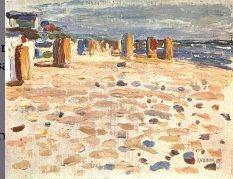
«Пляжные корзины в Голландии»

Знаменитые картины Василия Кандинского Василий Кандинский - русский художник и теоретик искусства, оказавший глубокое влияние на развитие современного изобразительного искусства. Он был тем, кто освободил картину от ограничивающего представления и создал основу для эволюции абстракционизма. Его огромное влияние на мир искусства навсегда изменило способ восприятия живописи. Работы художника основывались на философских положениях, которые неуклонно прогрессировали в картинные