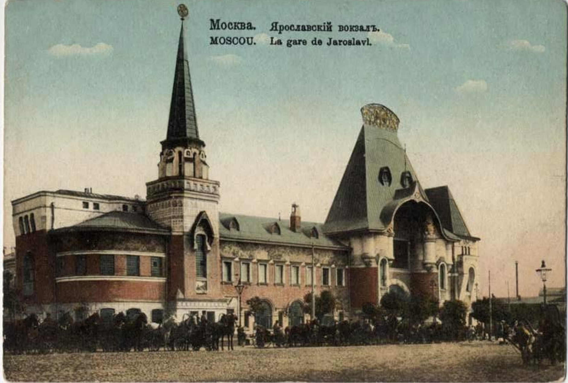
Москва. Ярославскій вокзалъ. MOSCOU. La gare de Jaroslavl.