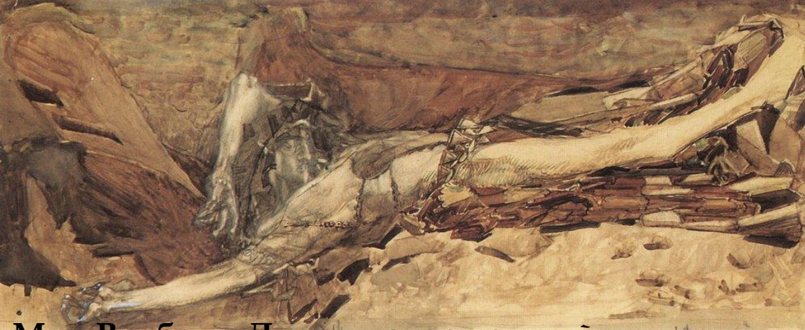
Мир Врубеля. Демон поверженный. Иллюстрация к поэме. 1901