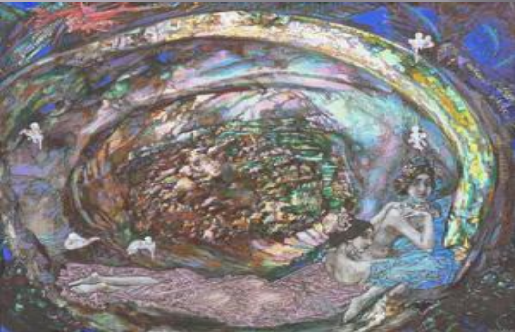
Михаил Александрович Врубель Жемчужина [1904]