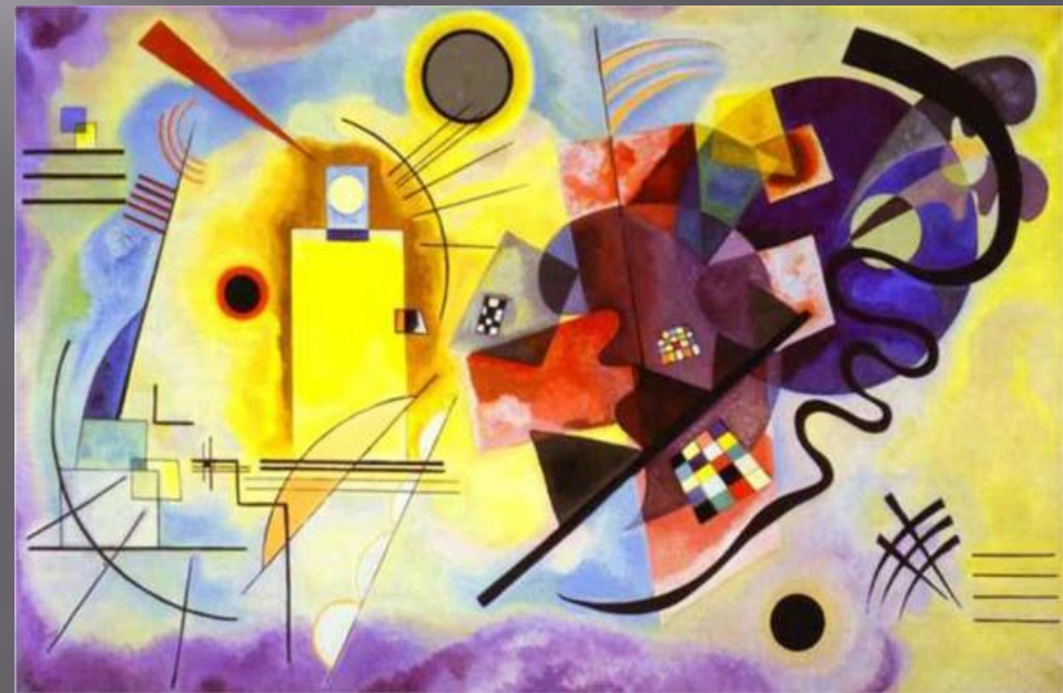
«Желтый, красный, синий»