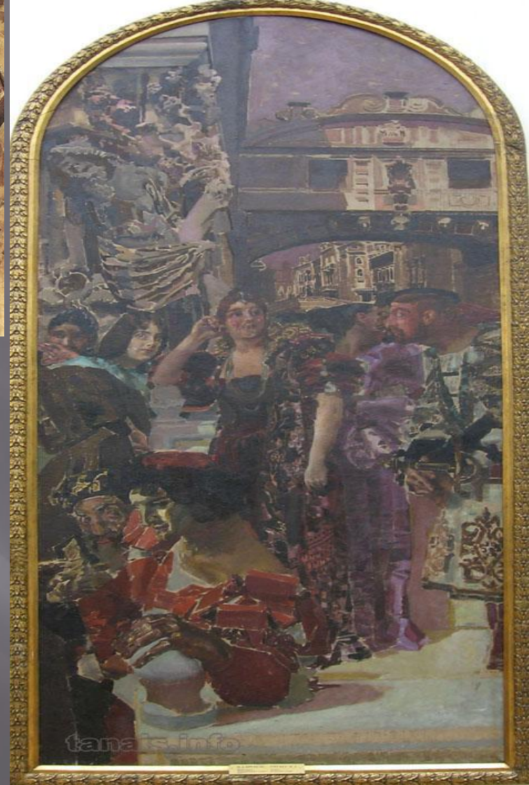
Михаил Врубель. Венеция. 1893. Декоративное панно. Холст, масло. Государственный Русский Музей, Санкт Петербург, Россия. Декоративное панно, исполненное для дома К.Г. и Е.Д. Дункеров в Москве. Верх скруглен