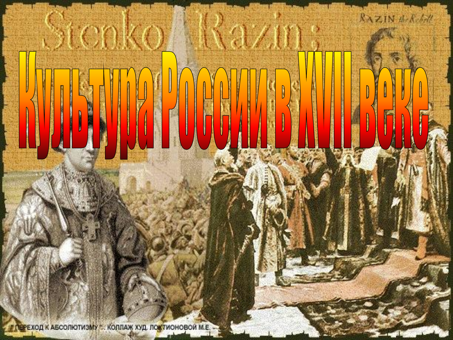
« ПЕРЕХОД К АБСОЛЮТИЗМУ ». КОЛЛАЖ ХУД. ПОХТИОНОВОЙ М.Е.