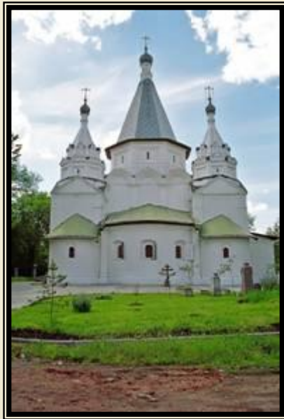
Церковь Троицы Живоначальной в Троицком-Голенищеве (1644-1645)

Патриарх Никон запретил строительство шатровых храмов