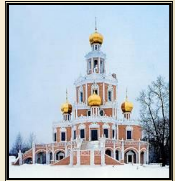
Церковь Покрова в Филях (1690-1695)

Нарядность, элегантность декора, строгая симметричность