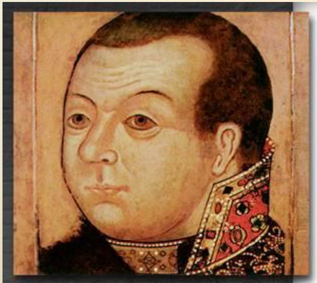
Князь М.В. Скопин-Шуйский. Парсуна