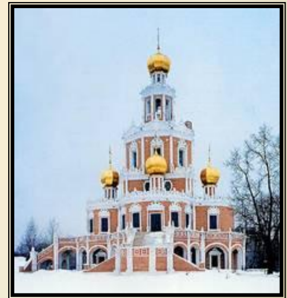
Церковь Покрова в Филях (1690-1695)

Нарядность, элегантность декора, строгая симметричность