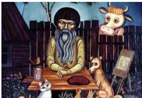
Картина художника X