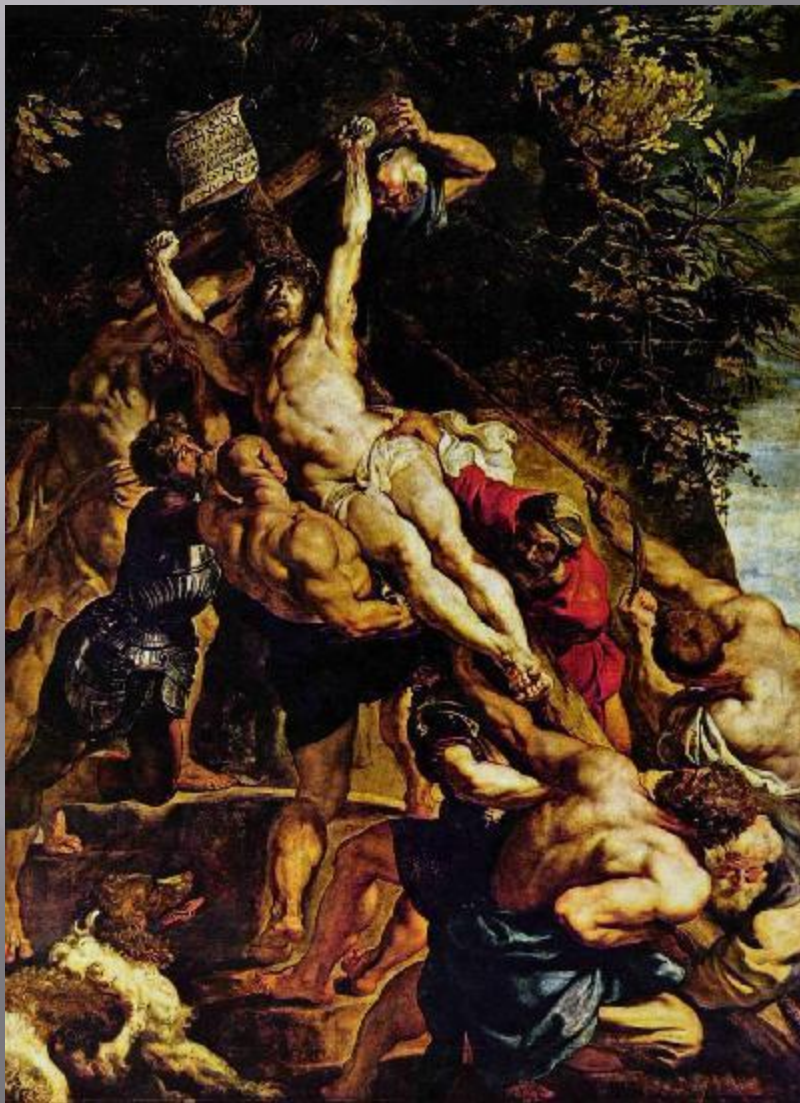
«Воздвижение креста» (1610)