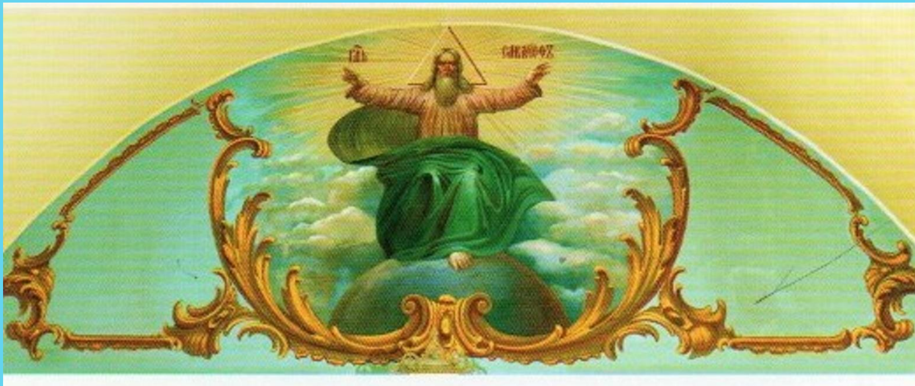
ГОСПОДЬ САВАОФ НА ФОНЕ ТРОИЦЫ. XVIII ВЕК.