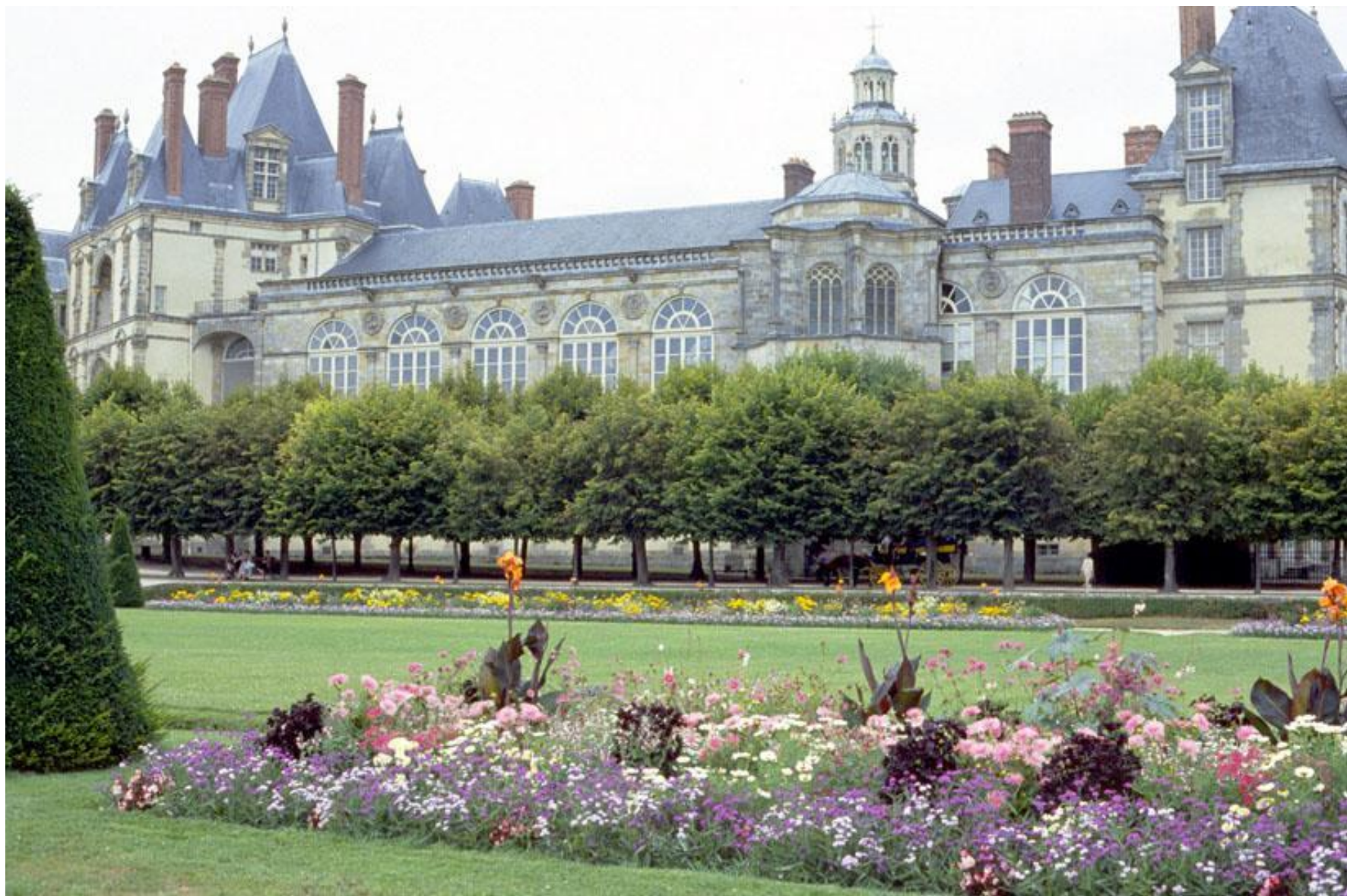
Замки-крепости перестраиваются в замки – дворцы Замок Фонтенбло