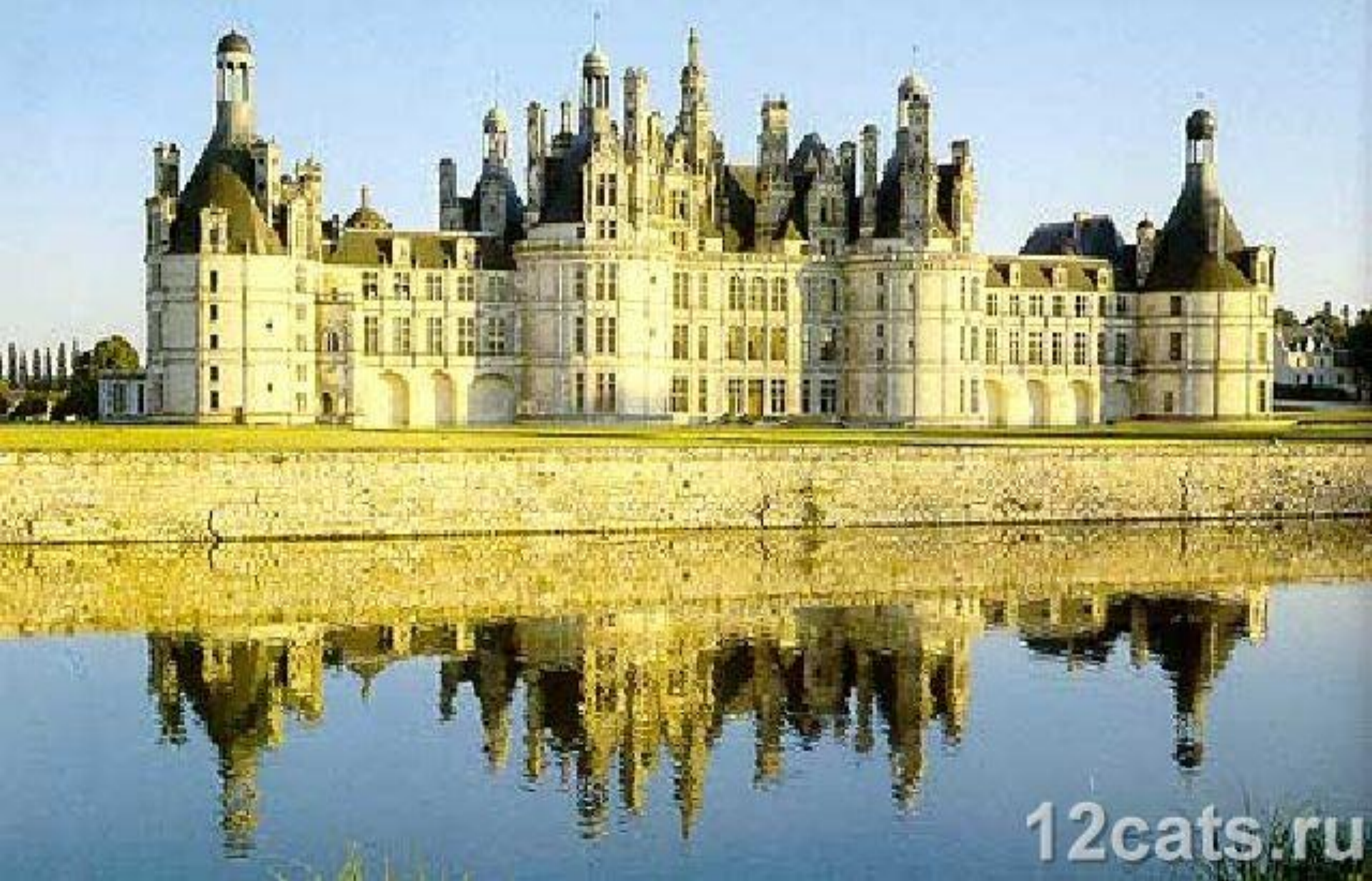
Королевский замок Шамбор (1519-1559). Франциск 1 построил его на месте охотничьего поместья