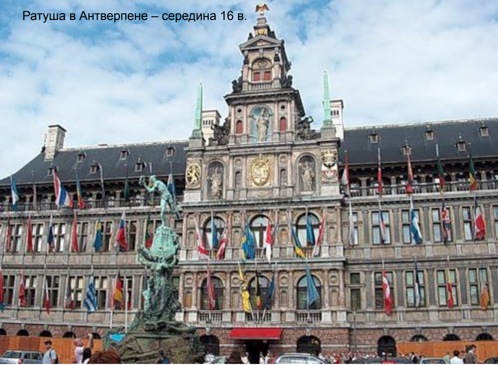
Ратуша в Антверпене – середина 16 в.