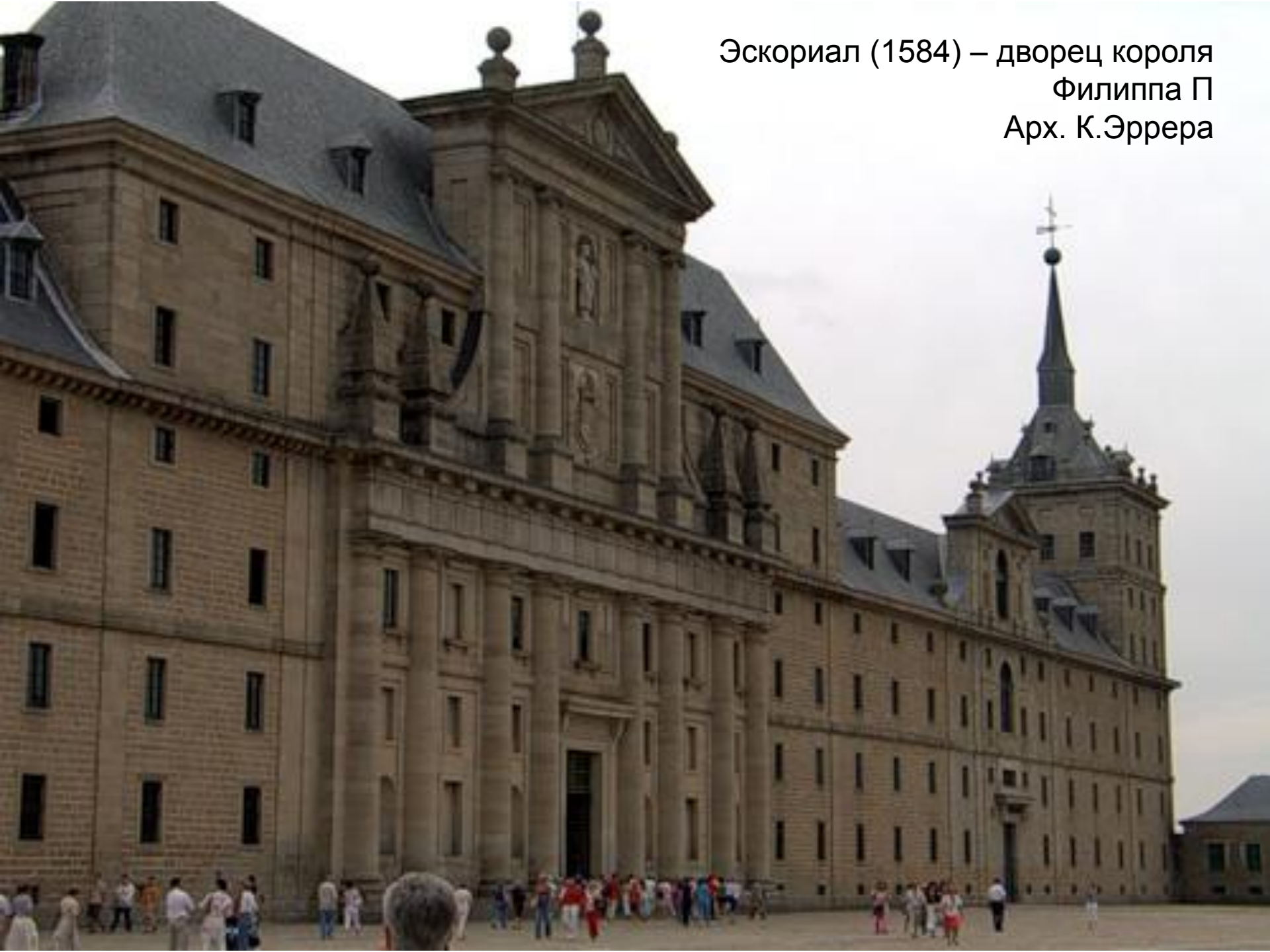
Эскориал (1584) – дворец короля Филиппа II Арх. К.Эррера