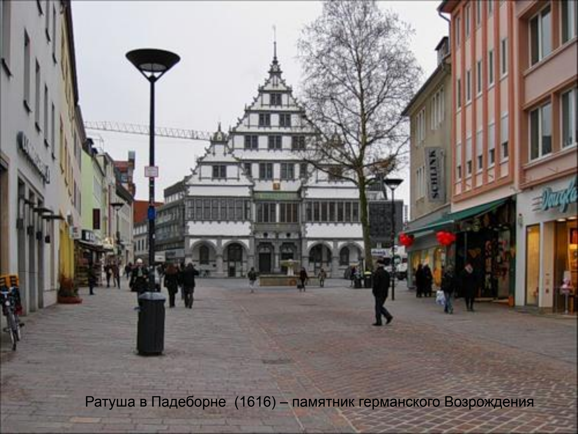
Ратуша в Падеборне (1616) – памятник германского Возрождения