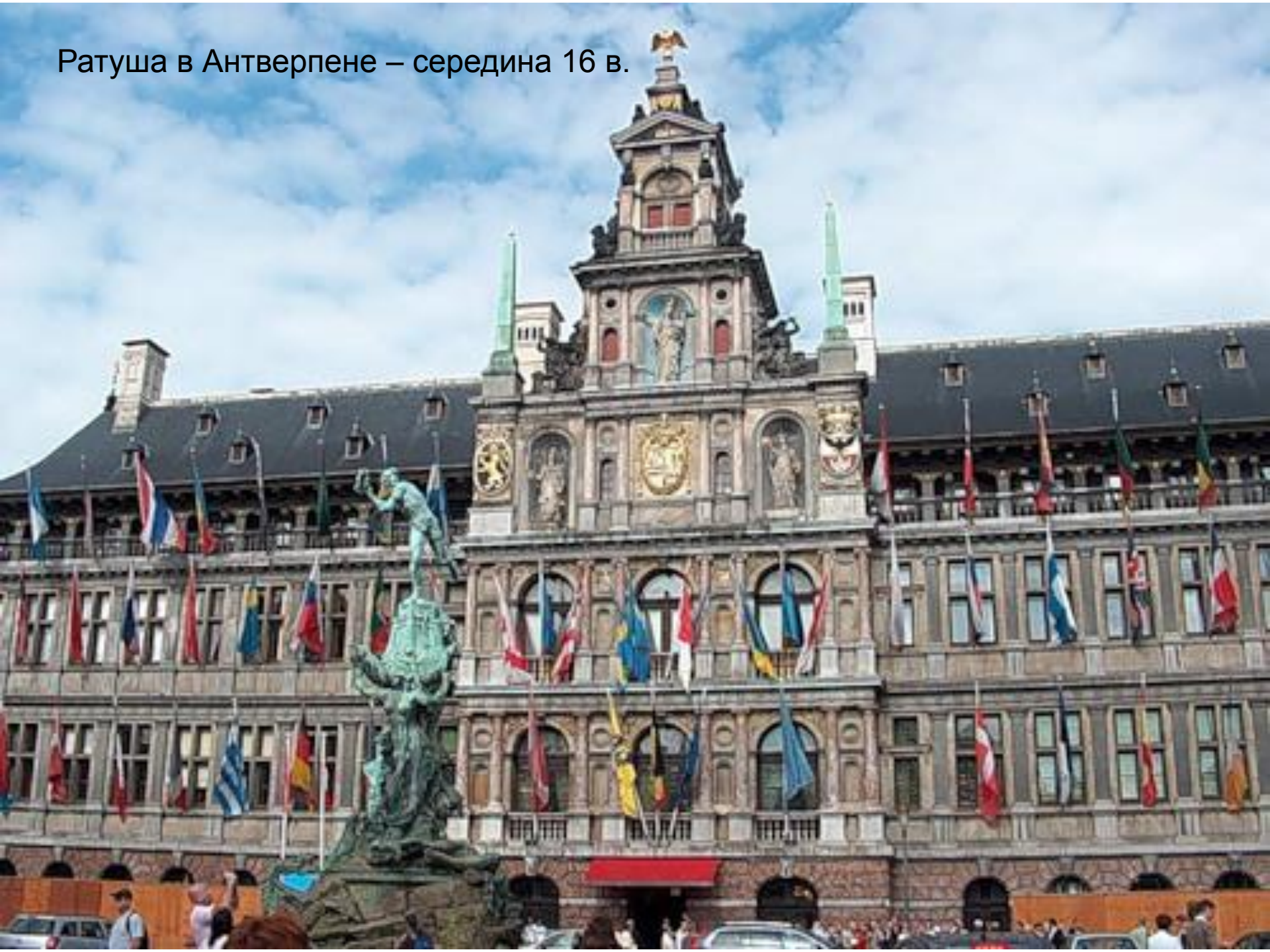
Ратуша в Антверпене – середина 16 в.