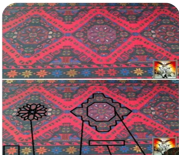
"Лезгинская звезда" "Лезгинский крест" "Волны" "Кувшины" „Цветок“ „Цветок“ „звезда“ „Лезгинский“ „Крест“ „Лезгинский“ „Волны“ „Волны“ „Кувшины“ „Кувшины“