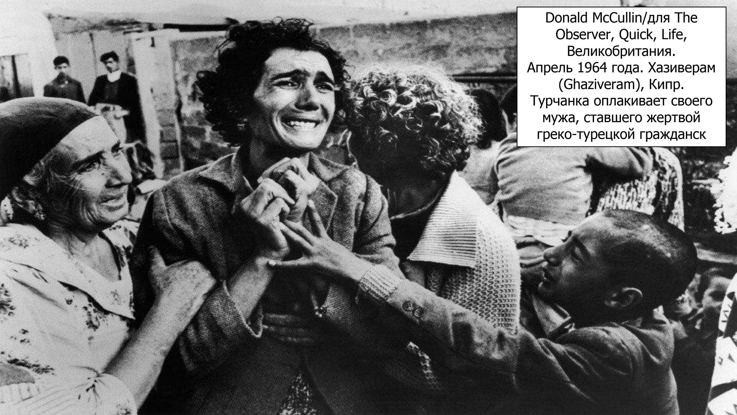
Donald McCullin/для The Observer, Quick, Life, Великобритания. Апрель 1964 года. Хазиверам (Ghaziveram), Кипр. Турчанка оплакивает своего мужа, ставшего жертвой греко-турецкой гражданск