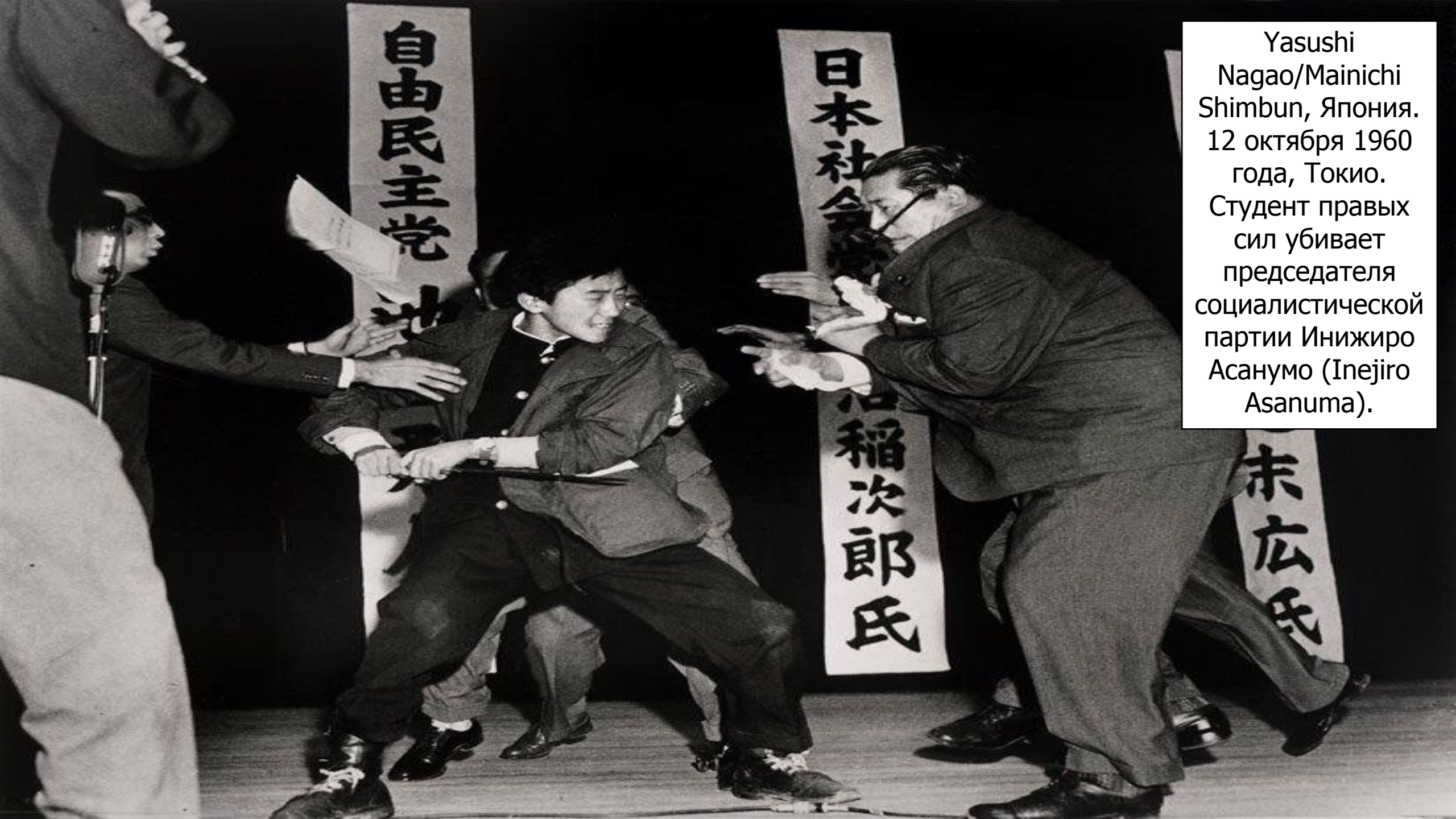
Япония. 12 октября 1960 года, Токио. Студент правых сил убивает председателя социалистической партии Инежиро Асанумо (Inejiro Asanuma).