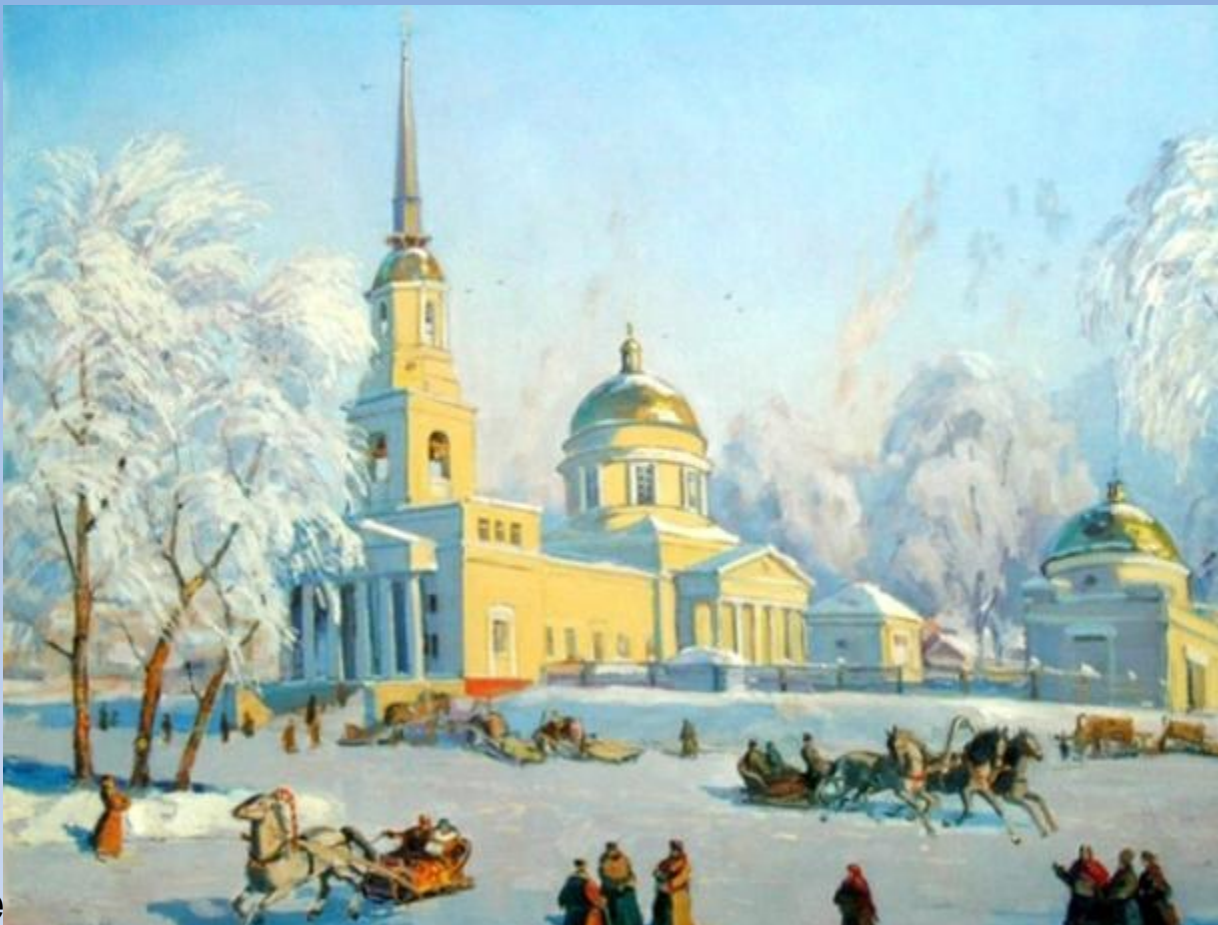
Вале 1908 г.