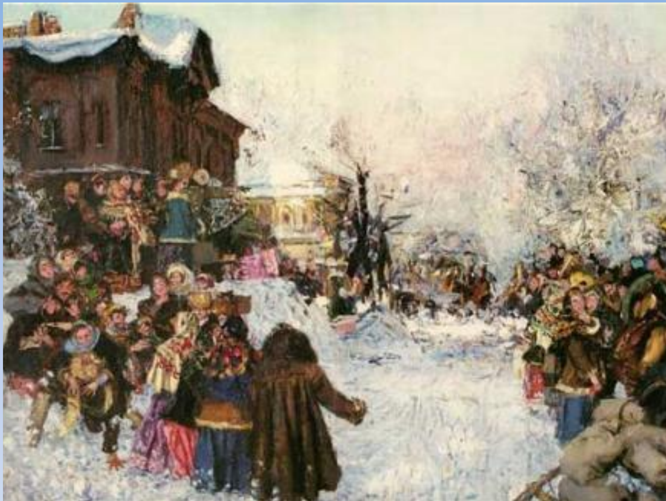
А. М Знак. "Проводы зимы в старом Красноярске" 1996 г.