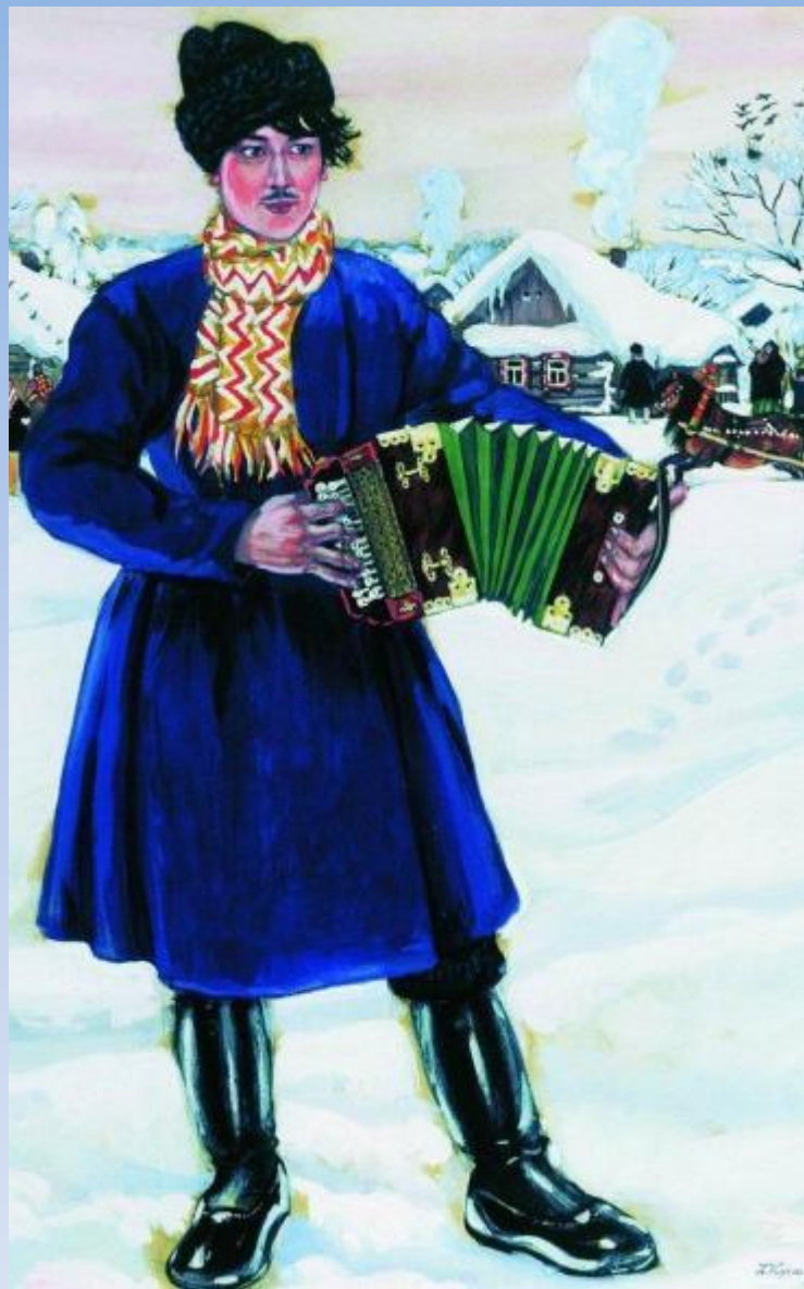
Деревенская масленица (Гармонист).1916