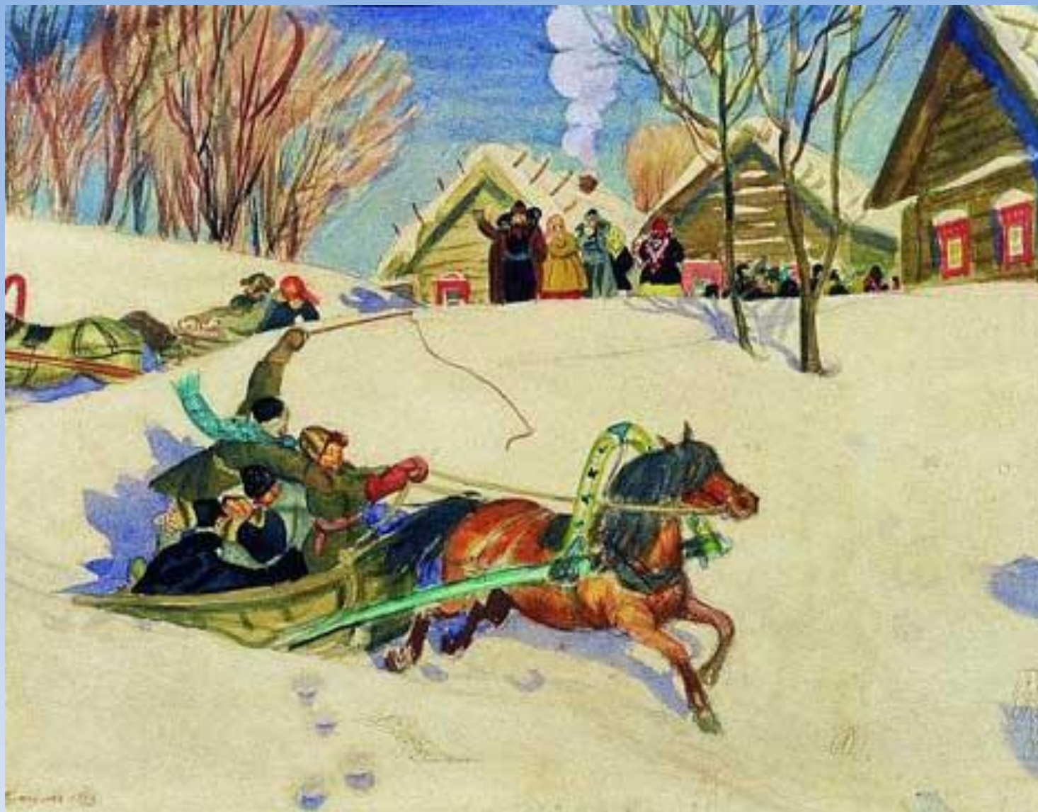
Борис Кустодиев "Масленица" 1920 г