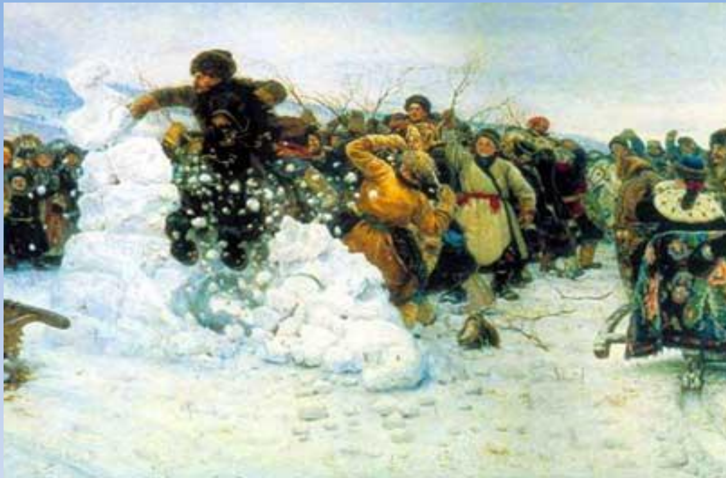
В.И Суриков "Взятие снежного города"

Суриков изобразил старинную казачью игру, издавна устраиваемую в Сибири на Масленицу.