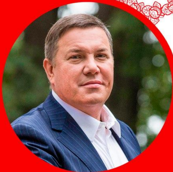
Олег Кувшинников Губернатор Вологодской области