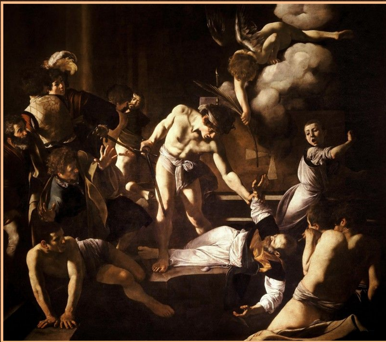
Мученичество апостола Матфея