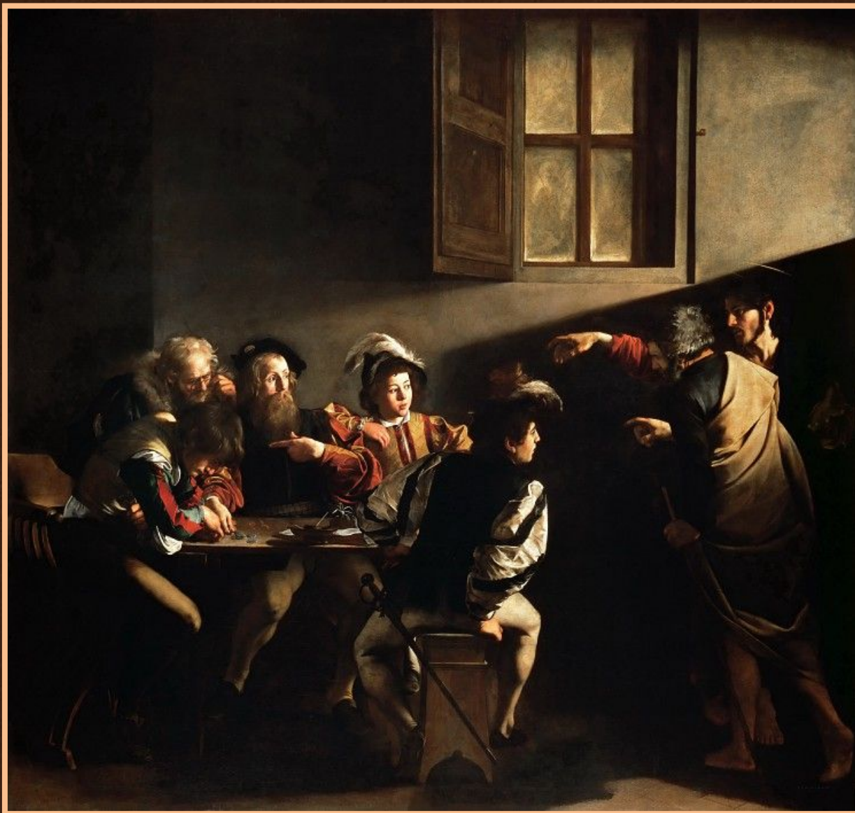
Призвание апостола Матфея