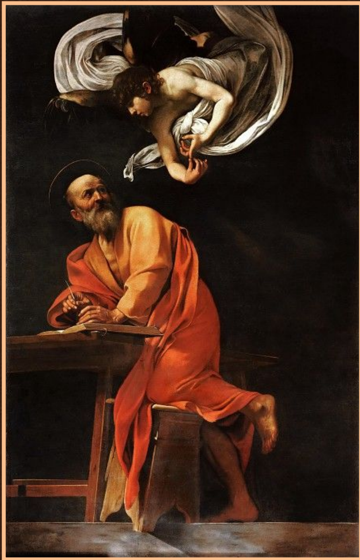
Апостол Матфей и ангел

Цикл из трех картин, посвященных жизни апостола Матфея («Апостол Матфей и ангел», «Призвание апостола Матфея», «Мученичество апостола Матфея») становится поворотным в творчестве художника. Здесь во всей полноте проявляется сила его реалистического видения. В этих картинах Караваджо по-новому активизирует роль света в живописном пространстве и пластическую моделировку персонажей