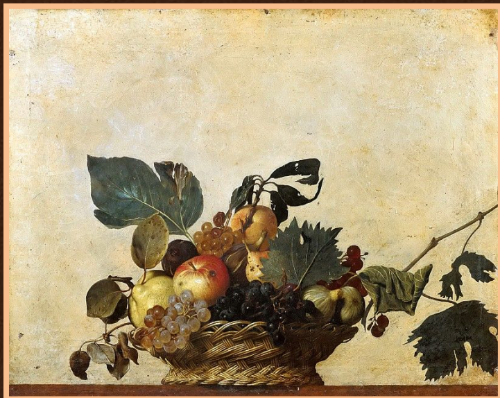
Корзина с фруктами

Караваджо создавал свои образы, смело обращаясь к натуре, так как считал её единственным источником творчества. Интерес к вещественному миру приводит мастера к созданию одного из первых в европейской живописи натюрмортов