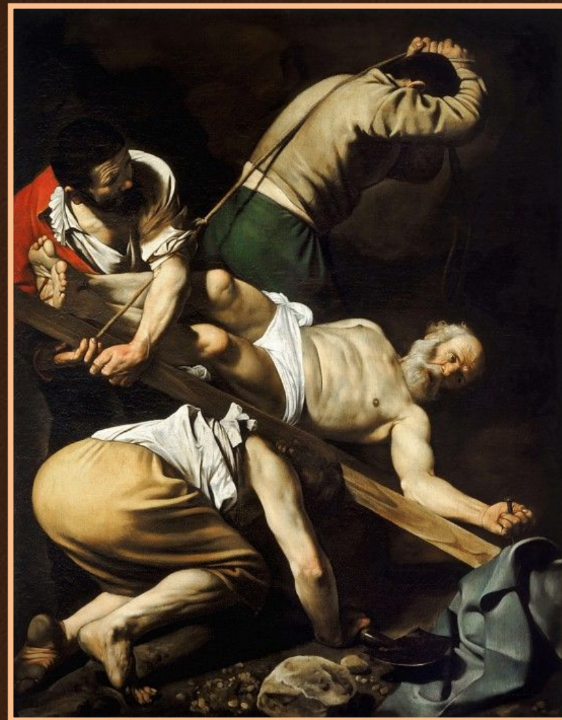
Распятие святого Петра

Параллельно Караваджо создает свои знаменитые алтарные картины для церкви Санта Мария дель Пополо в Риме – «Распятие св. Петра» и «Обращение Савла»