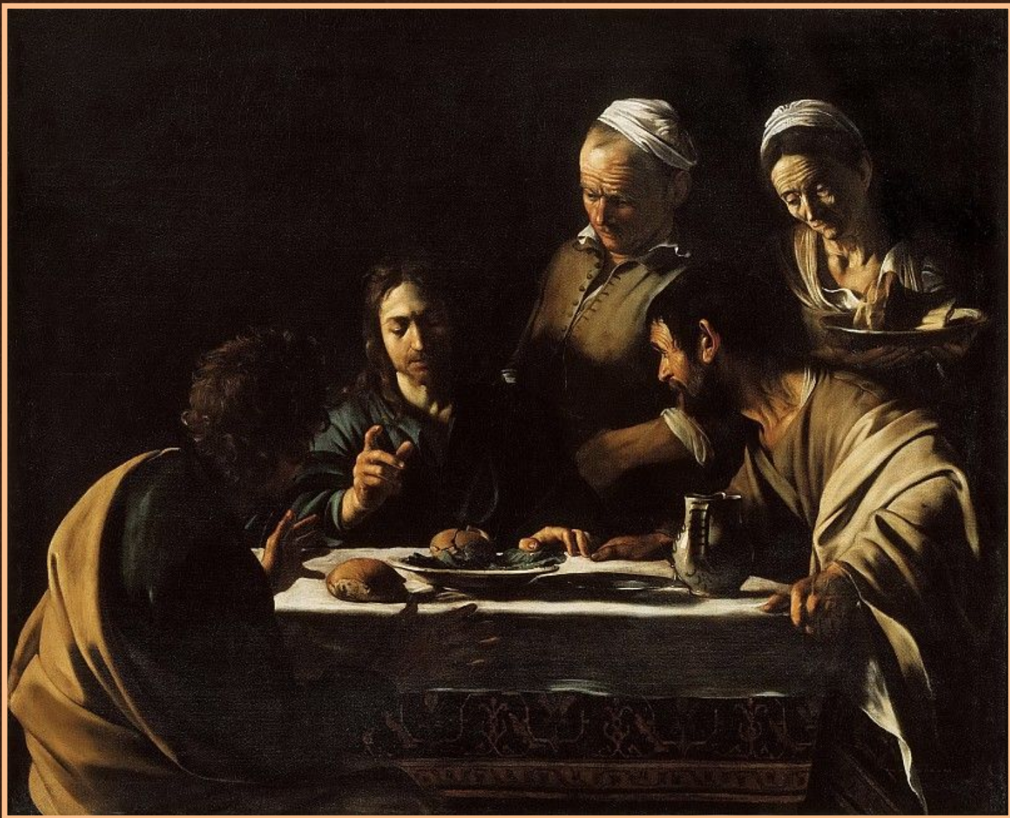
Ужин в Эммаусе