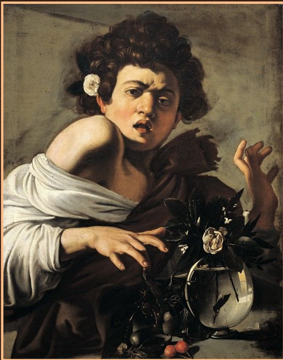
Юноша, укушенный ящерицей