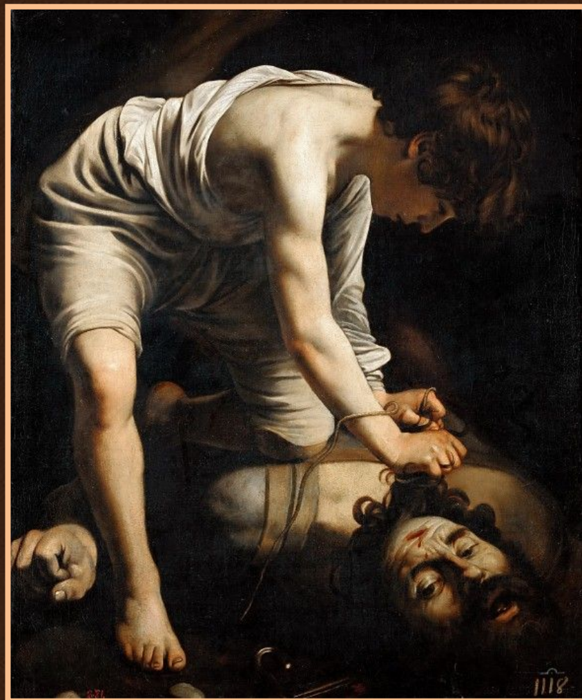
Давид и Голиаф