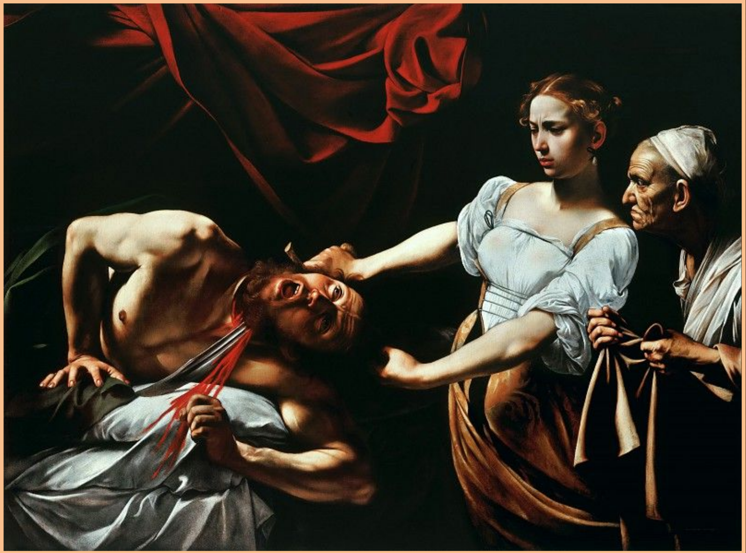
Юдифь, убивающая Олоферна