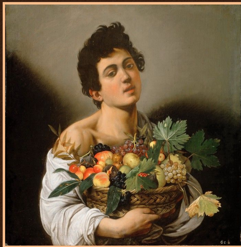
Юноша с корзиной фруктов