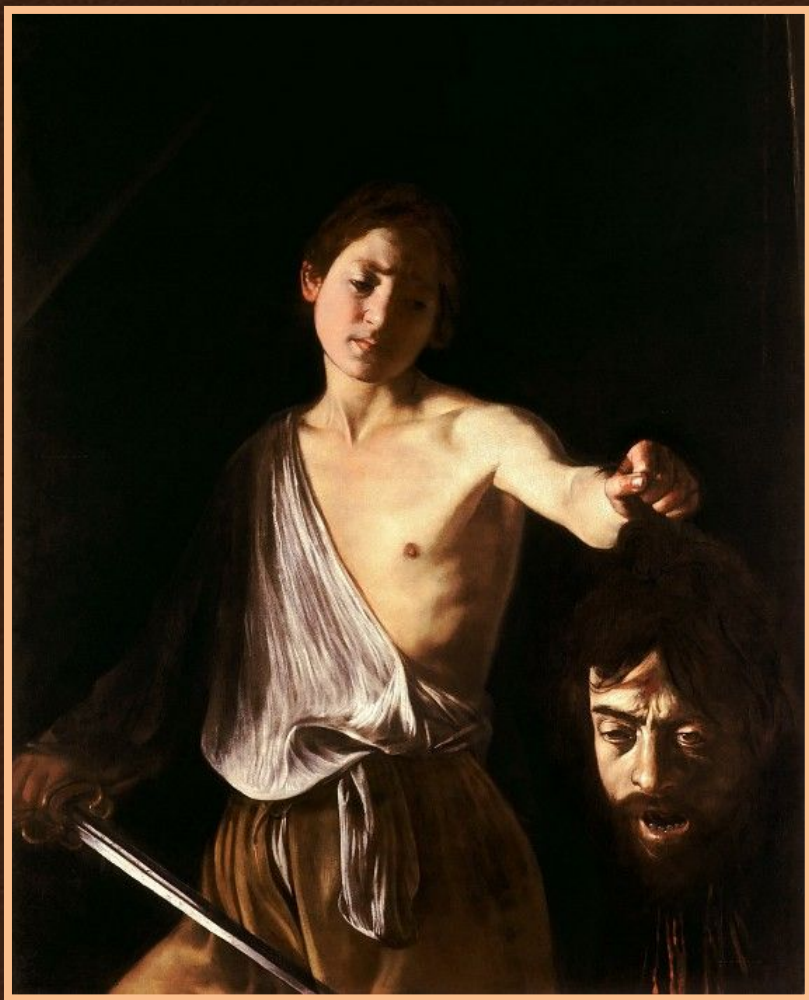
Давид с головой Голиафа