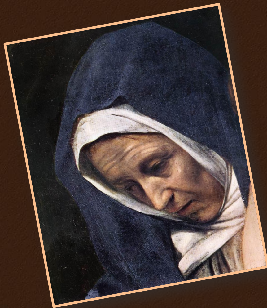
Положение во гроб