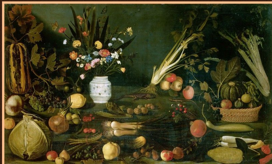
Спокойная жизнь с цветами и фруктами