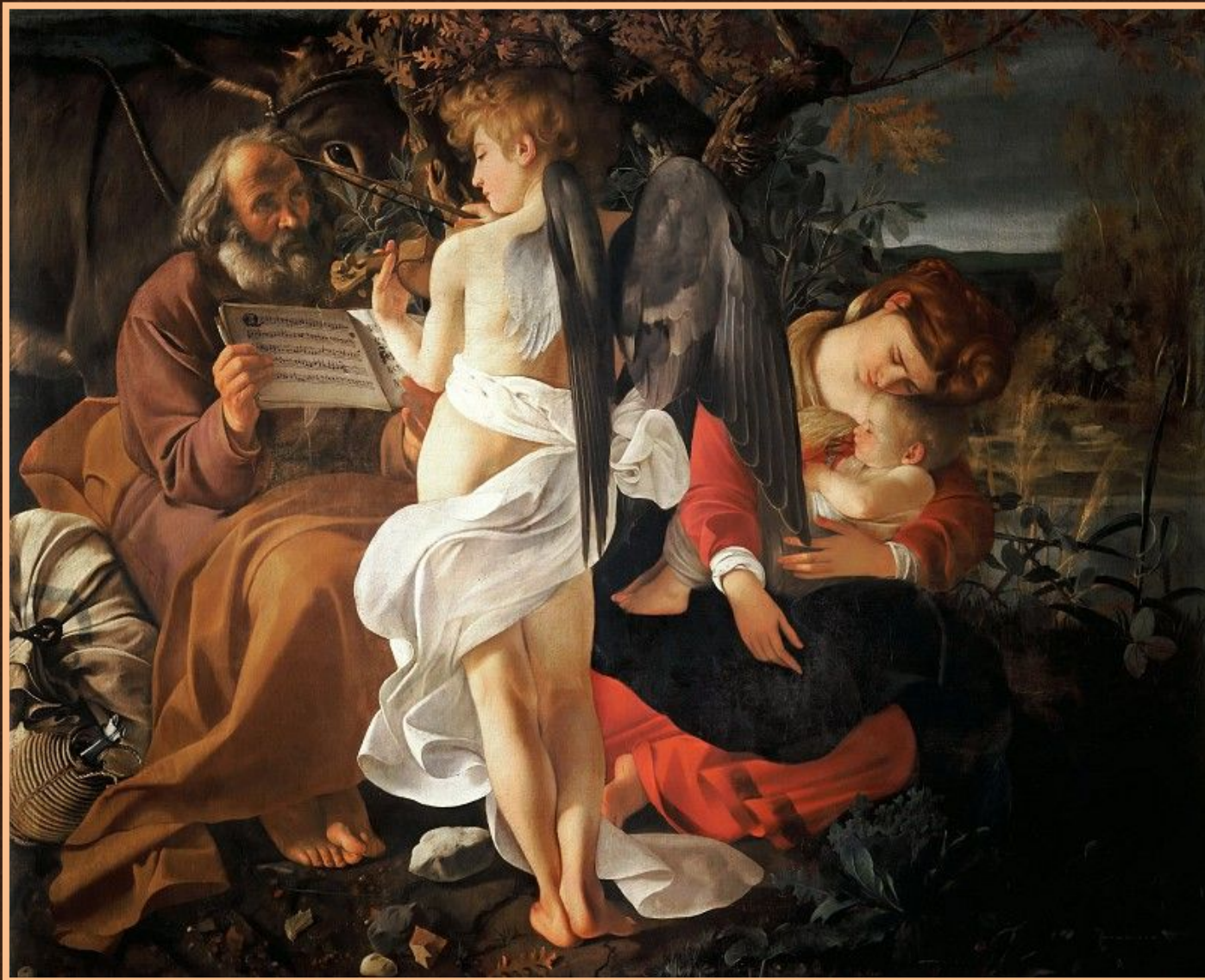
Отдых на пути в Египет