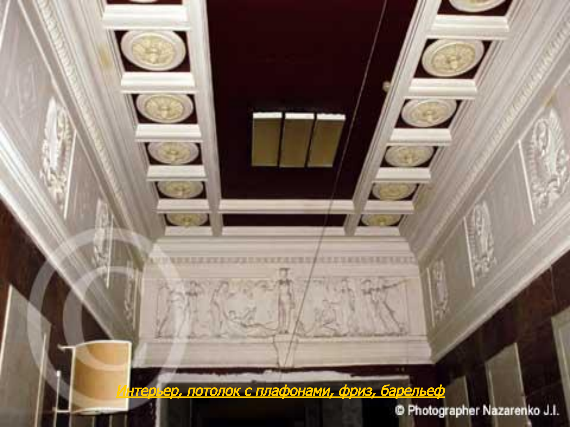
Интерьер, потолок с плафонами, фриз, барельеф