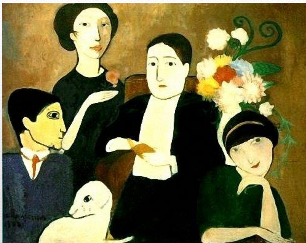
Мари Лорансен. Аполлинер и его друзья.