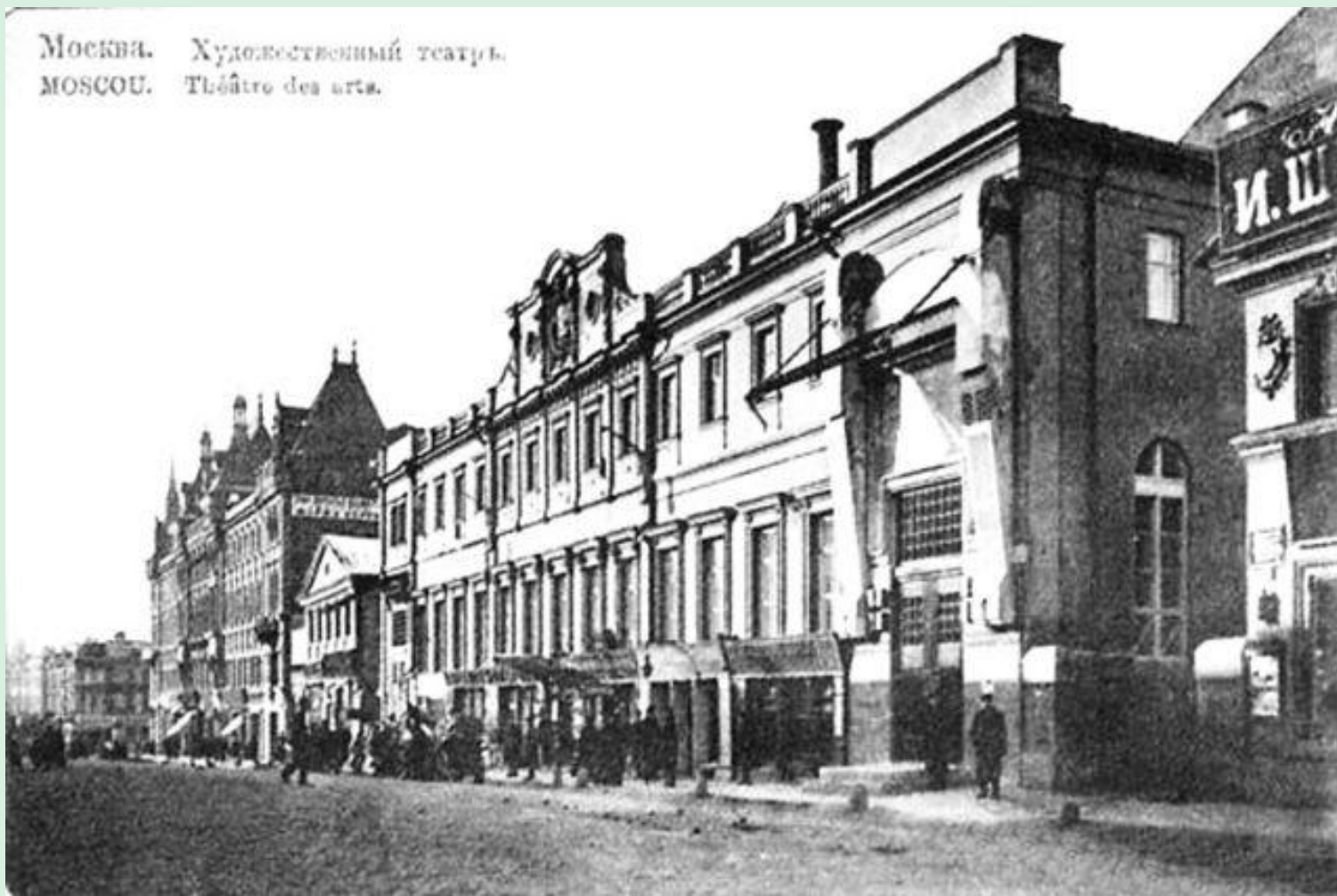
Москва. Художественный театр. MOSCOU. Théâtre des arts.