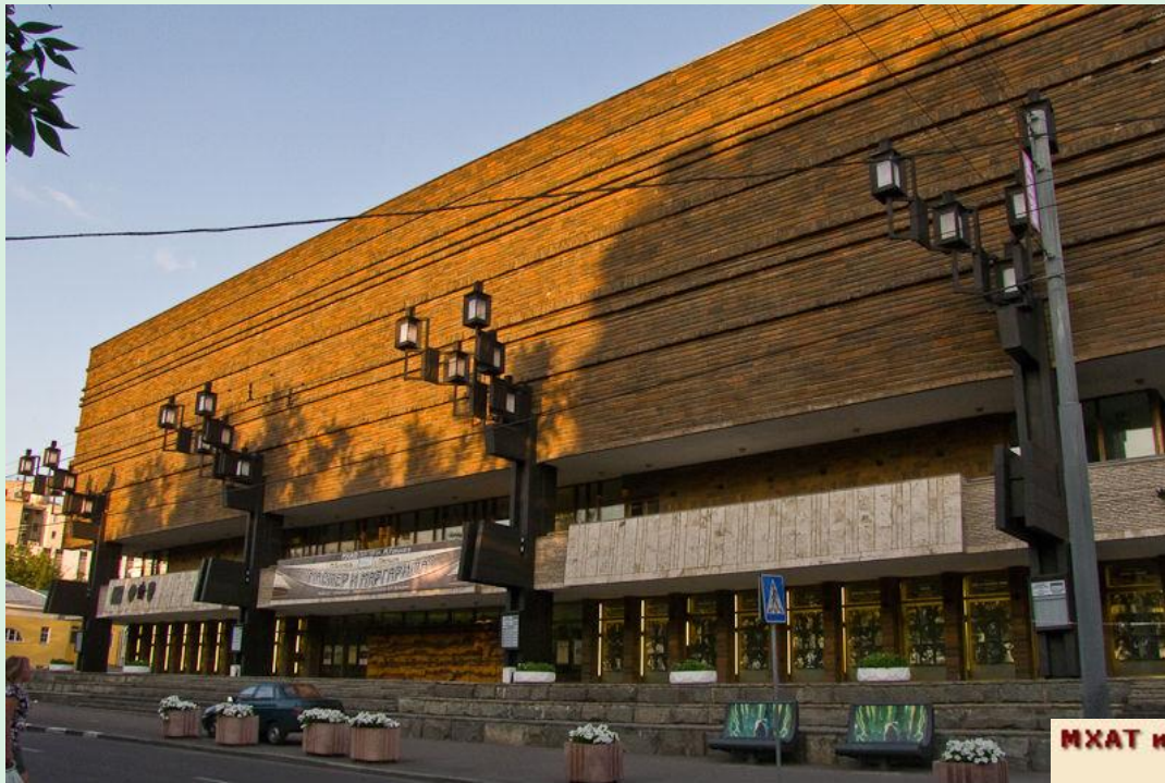
МХАТ имени Горького.