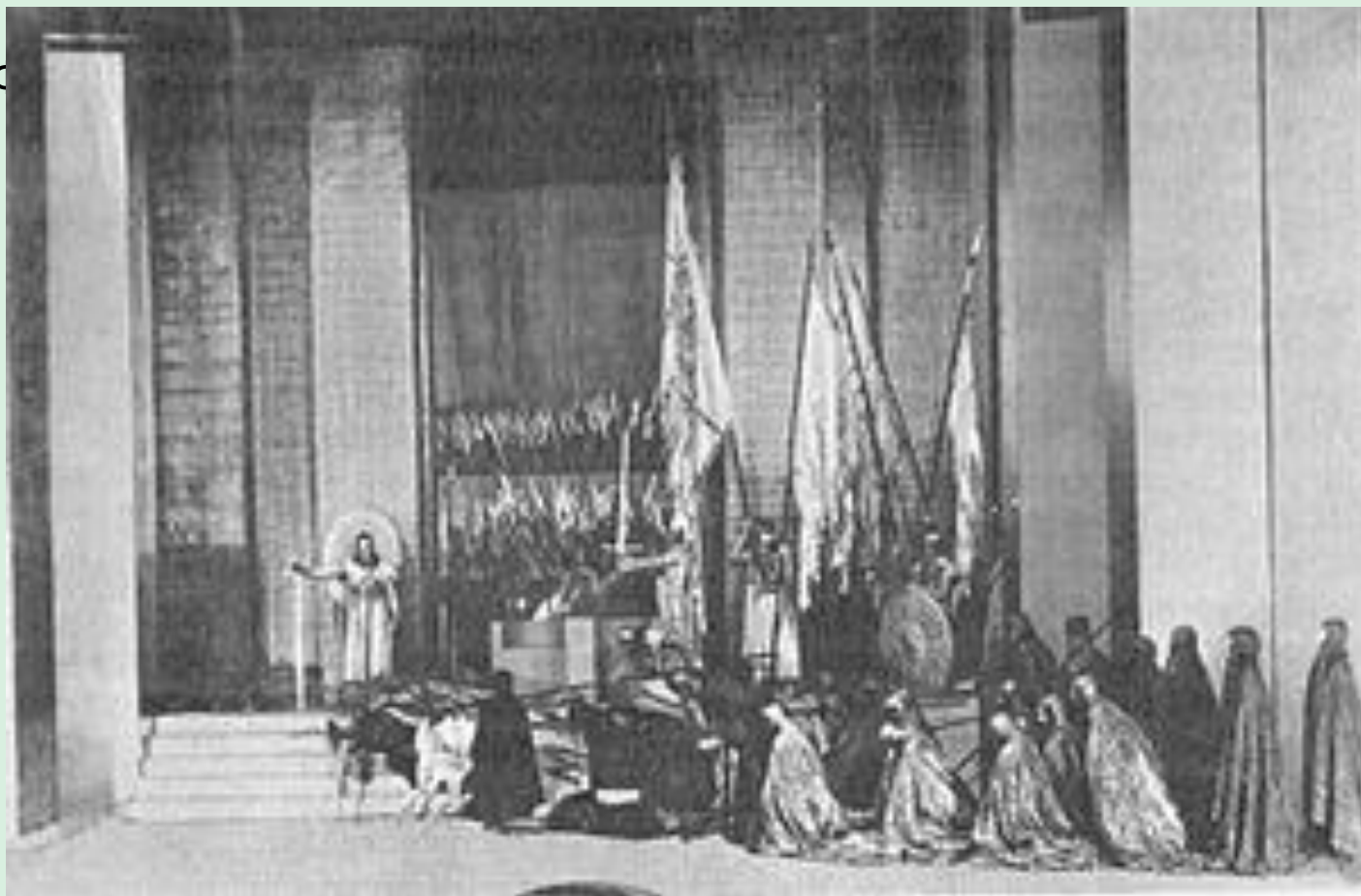
Финальная сцена «Гамлета» Г. Крэга, 1911 год