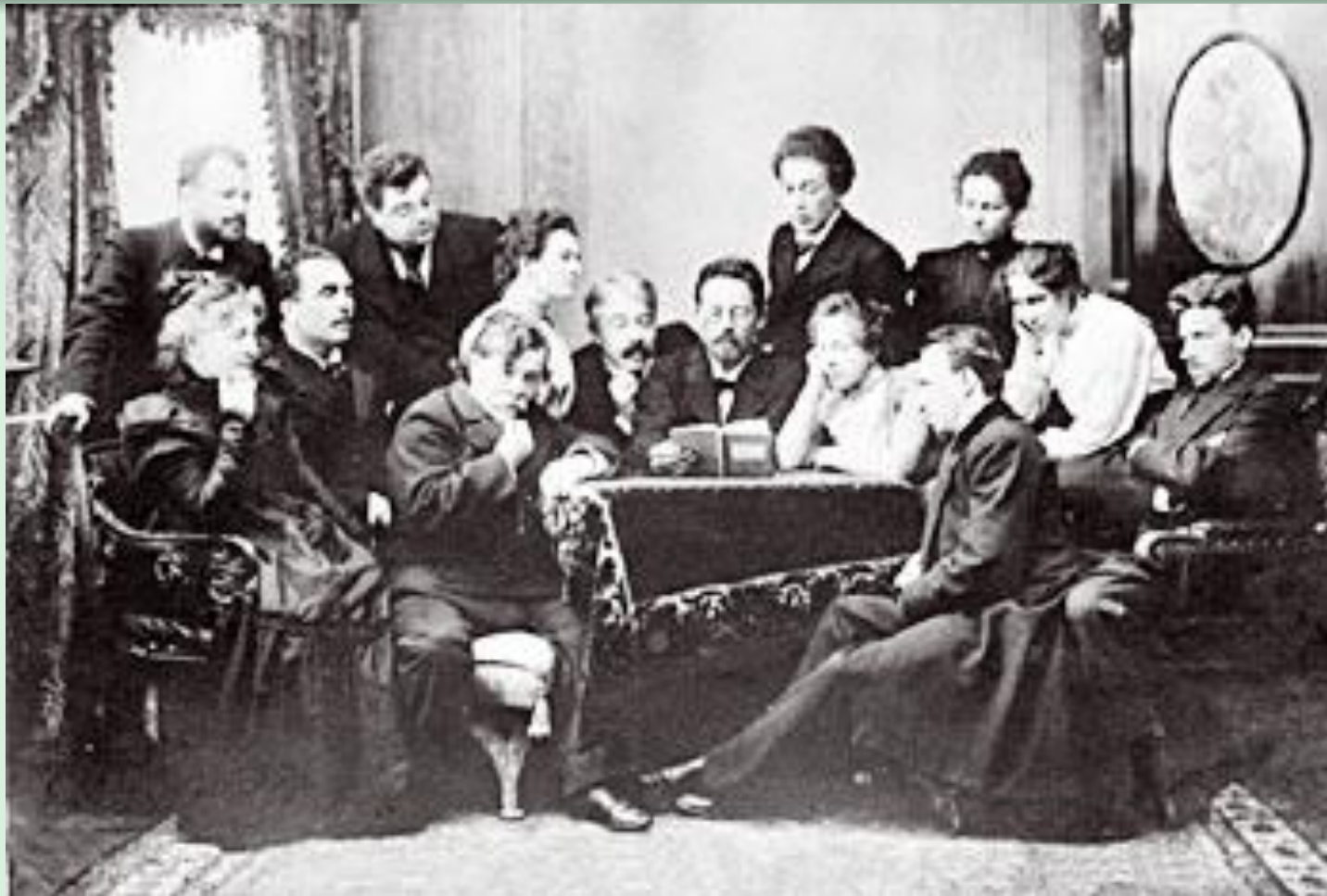
А. П. Чехов читает «Чайку» артистам театра, 1898 год. Слева от Чехова сидит К. С. Станиславский, рядом с ним стоит О. Л. Книппер, в левом углу стоит В. И. Немирович-Данченко. Справа сидит М. П. Лилина, рядом стоит В. Э. Мейерхольд