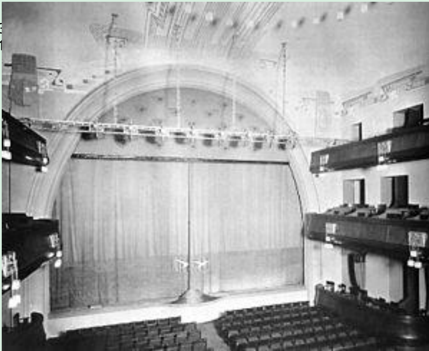
Зал Московского художественного театра после перестройки 1900—1903. Архитектор Фёдор Шехтель