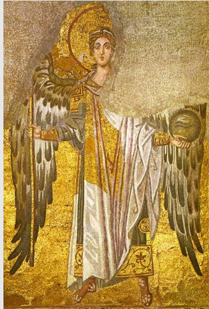
Архангел Гавриил (мозаика свода вимы)

Мозаика — от этого слова веет роскошью римских терм и величием византийских храмов. Само понятие мозаики необратимо включено в нашу жизнь. По сути, это одна из функций анализа нашего сознания, осязающего окружающую реальность и создающего из разных фрагментов жизни единую картину мира.