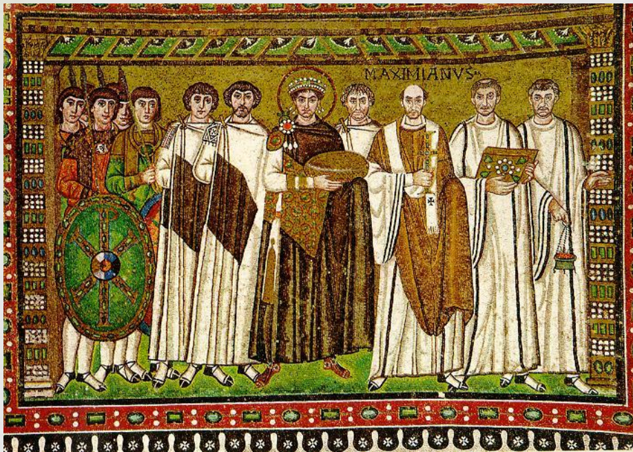
Император Юстиниан со свитой