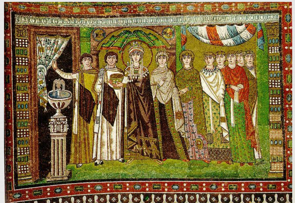
Императрица Феодора со свитой