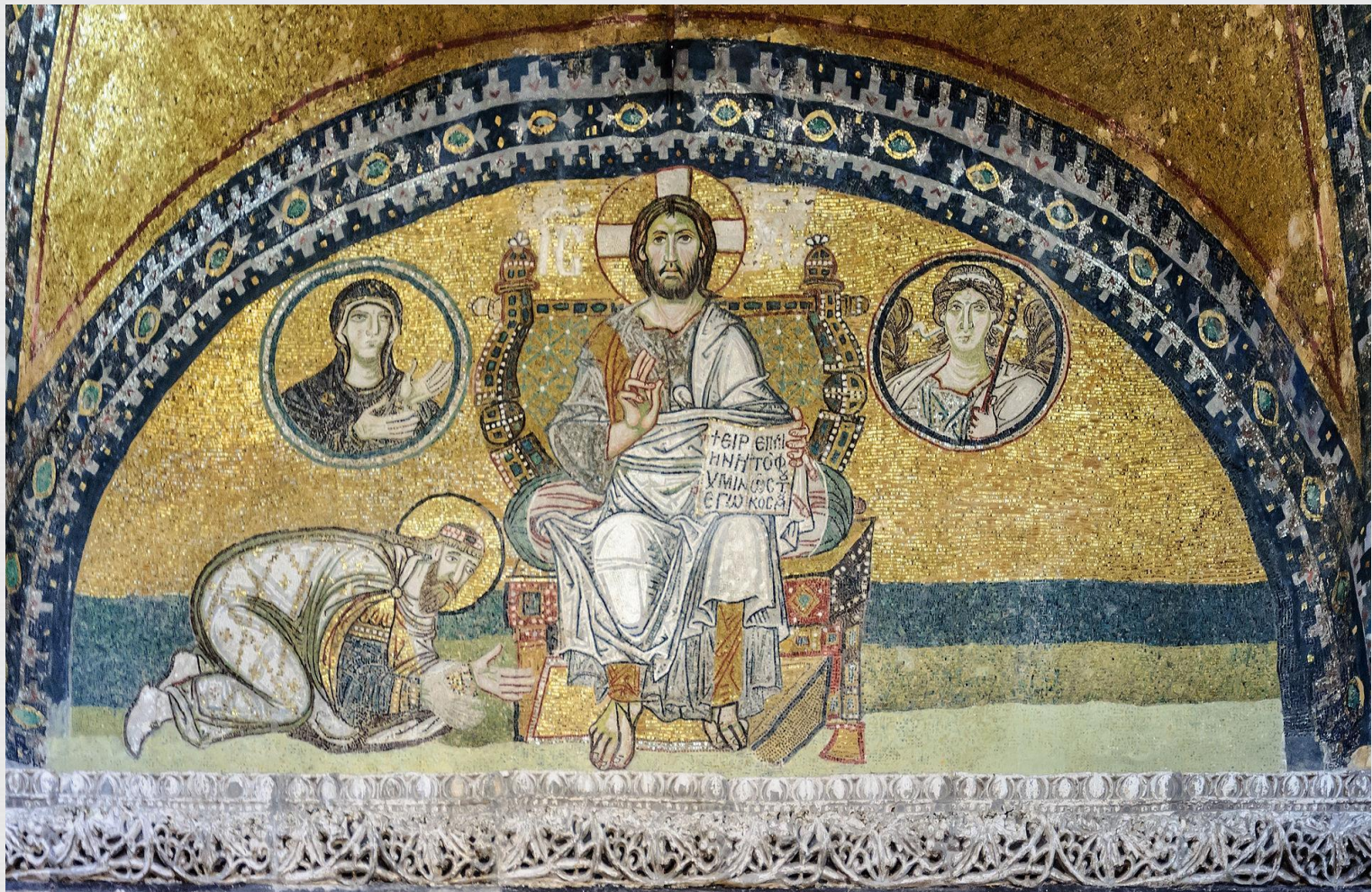
Император Лев VI преклоняет колени перед Иисусом Христом