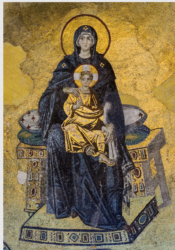
Мозаичное изображение Богородицы в апсиде

? Считается, что именно византийцы придумали смальту — подкрашенное при помощи добавления различных металлов стекло, которое становится главным материалом при изготовлении мозаик. Примеси золота, ртути и меди в разных пропорциях придавали стеклу различные оттенки.