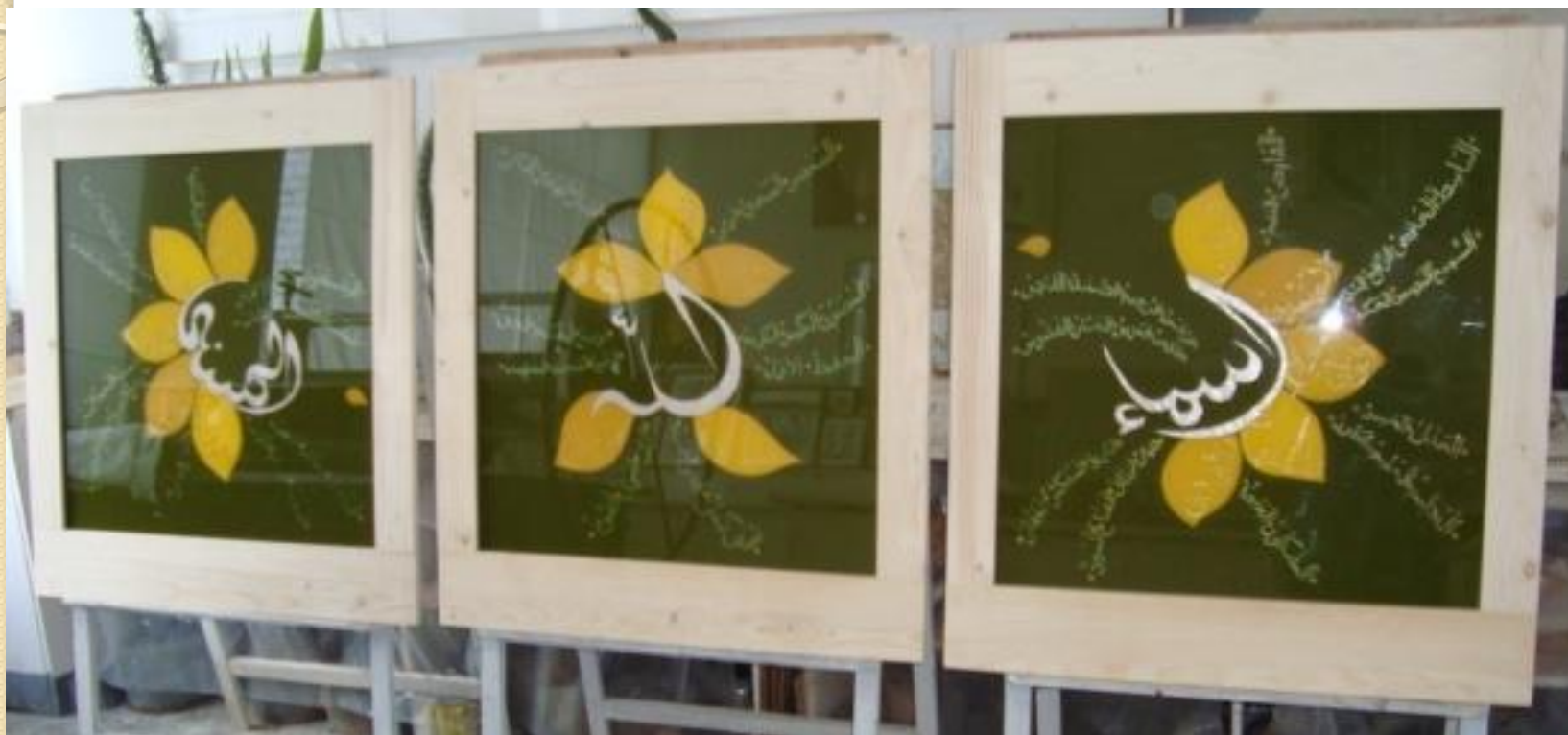
Авторские работы О.М. Асанбаевой