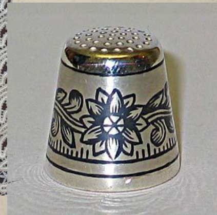
Великоустюжское чернение по серебру