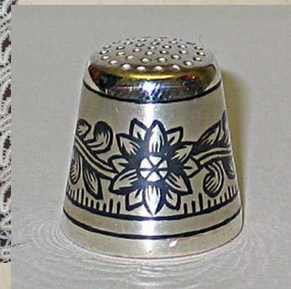
Великоустюжское чернение по серебру