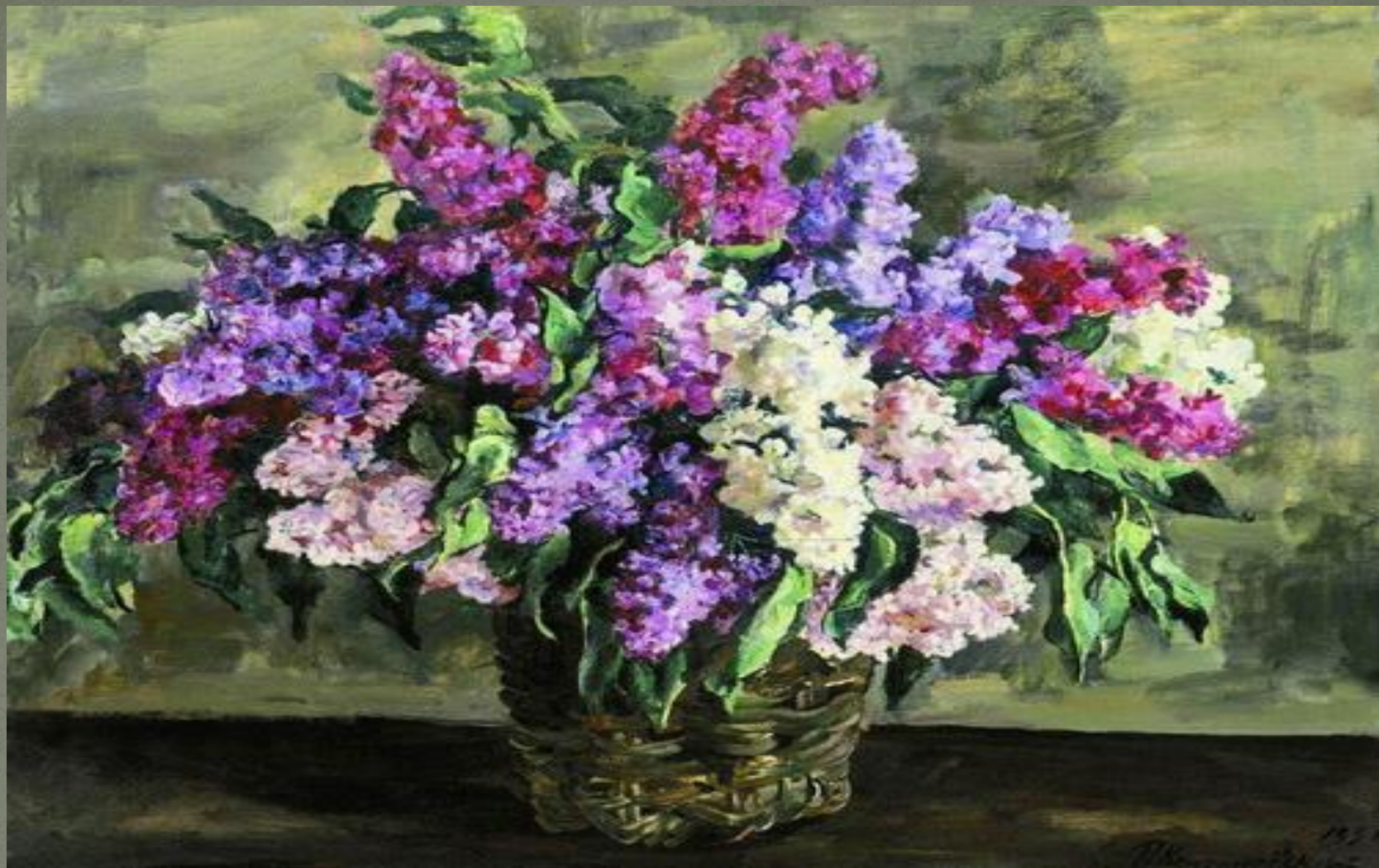
П. Кончаловский «Сирень» (1939)