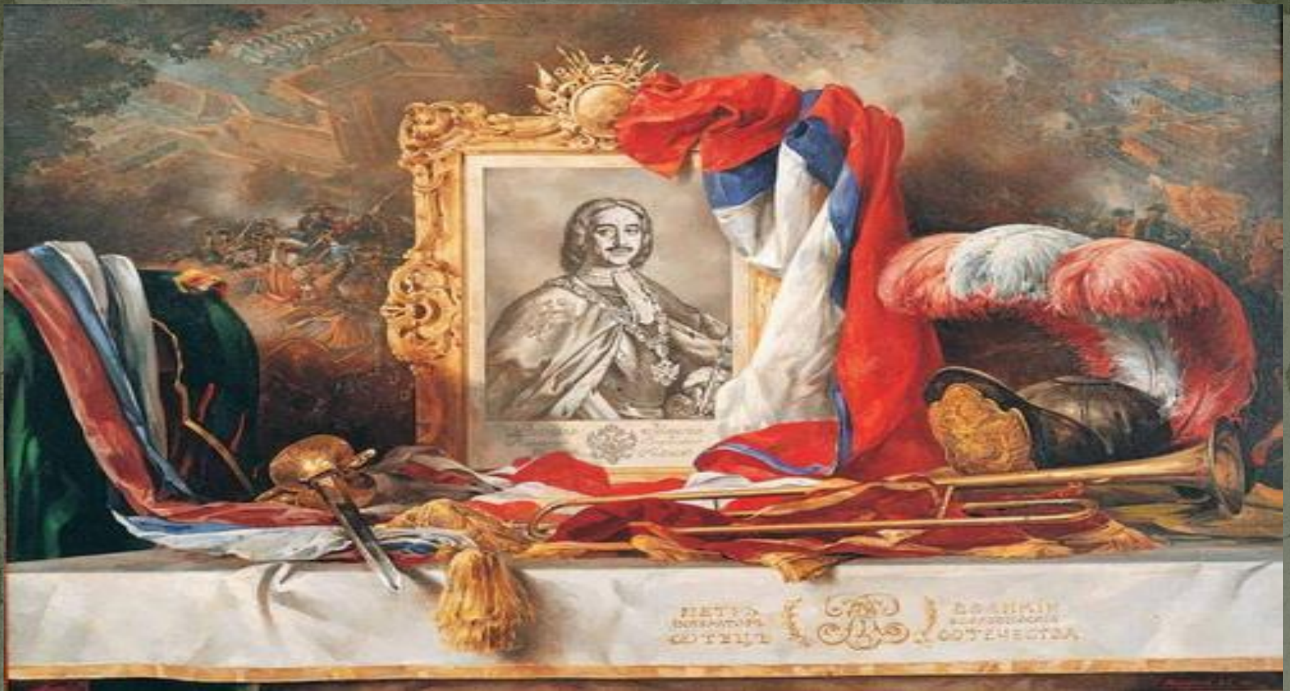
В. Нестеренко «Отец Отечества» (1997)